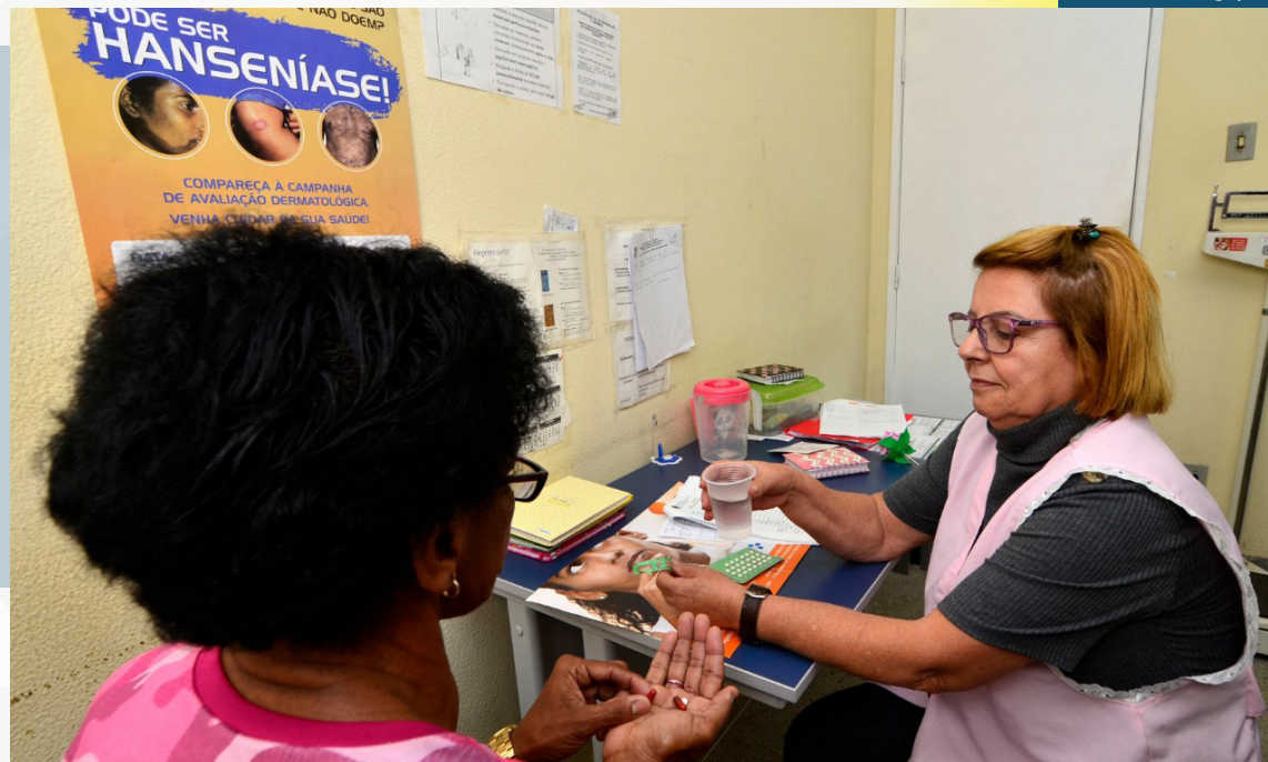
Nova Iguaçu recebe nesta semana o projeto 'Roda-Hans

O Brasil ocupa a 2ª posição do mundo, entre os países que registram casos novos de hanseníase, segundo o Ministério da Saúde.