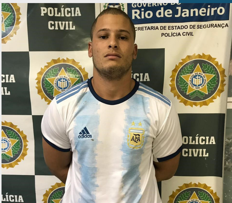
Com a dupla foi encontrado um revólver calibre 32