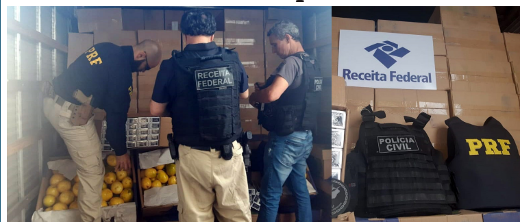
A apreensão aconteceu em uma ação conjunta

Um carregamento com mais de 270 mil maços de cigarros contrabandeados foi apreendido na Rodovia Presidente Dutra (BR-116), em Seropédica, na Região Metropolitana do Rio. A carga estava escondida atrás de caixas de maracujá que eram transportadas num caminhão. A apreensão aconteceu em uma ação conjunta entre a Polícia Rodoviária Federal (PRF), Polícia Civil e Receita Federal, nesta terça-feira.