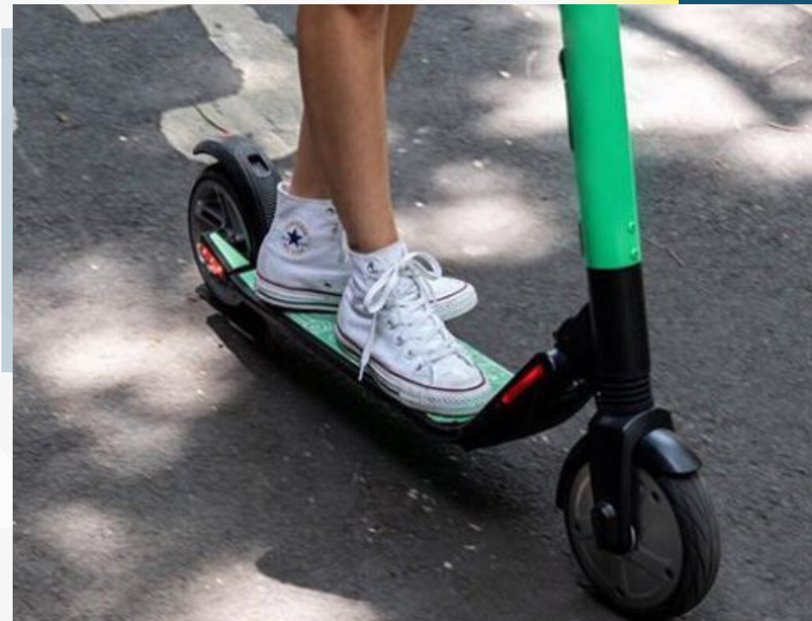
Agentes vão apreender patinetes não cadastrados

Os limites de velocidade para o patinete em cada situação: