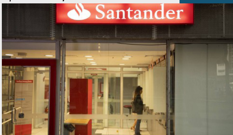
Retirada dos valores poderá ser feita de setembro a março de 2020

Haverá cinco etapas no processo seletivo. A primeira (inscrição) e segunda etapas já vão inserir o candidato na jornada de seleção online. A terceira envolverá entrevista e dinâmica online em grupo, e as duas etapas finais terão