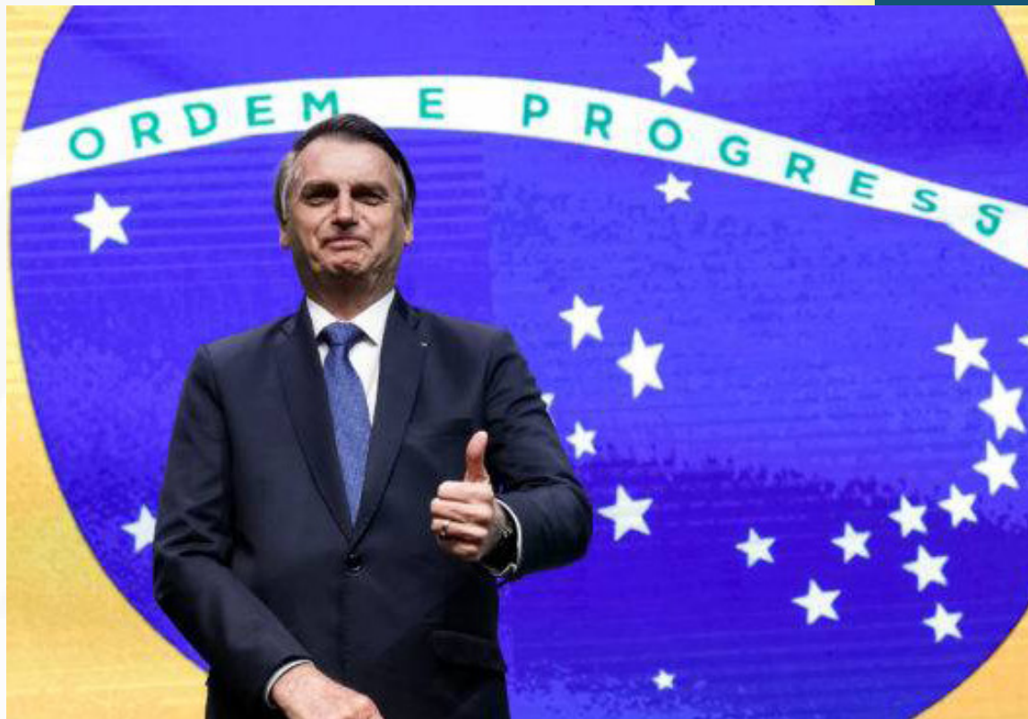
O presidente voltou a defender que Eduardo Bolsonaro, seu filho, seja nomeado embaixador do Brasil nos Estados Unidos

"Ontem a imprensa perguntou para mim se o meu filho teria coragem de dizer 'não' caso fosse embaixador nos Estados Unidos. Eu falei: pior são