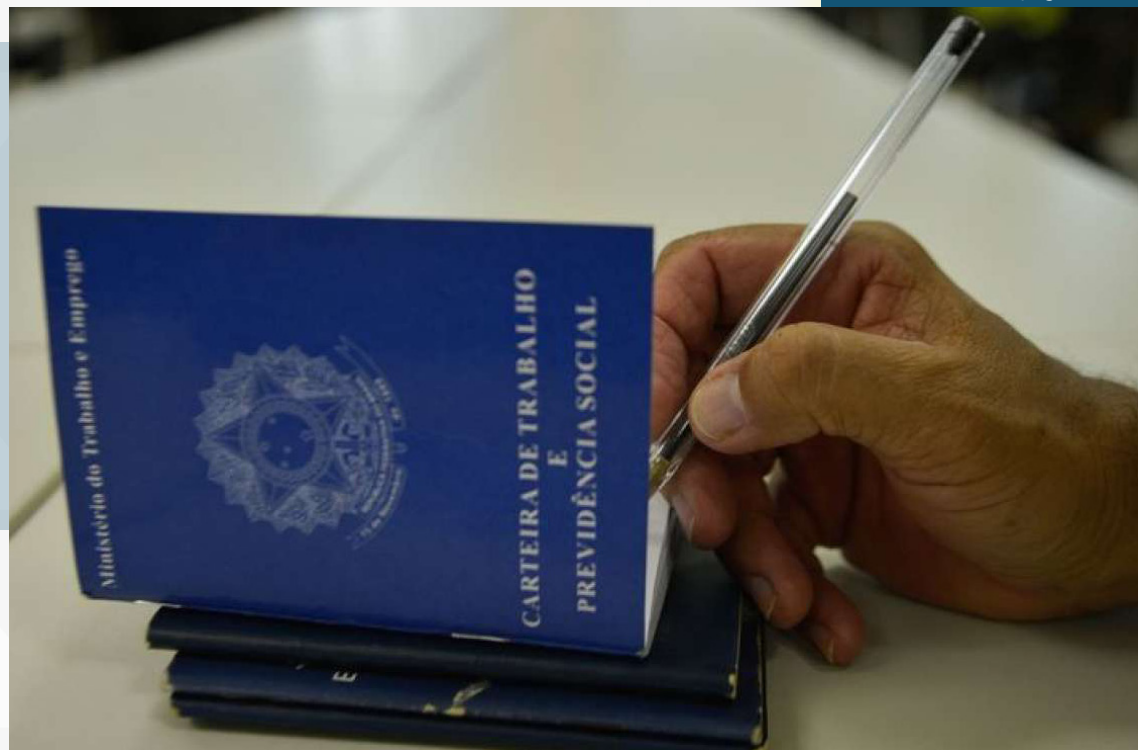
São 562 vagas para pessoas com deficiência e reabilitados do INSS e 393 para candidatos sem deficiência

De acordo com a pasta, não existe possibilidade de en-