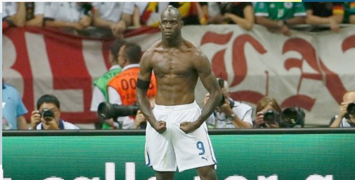
O Flamengo está buscando recursos para acertar a contratação de Mario Balotelli