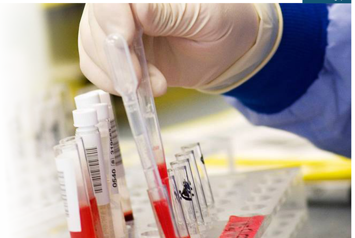
Novo estudo indica que o método apresenta 94% de precisão no diagnóstico precoce e considera os três principais

Para identificar a presença da proteína beta-amiloide no cérebro,