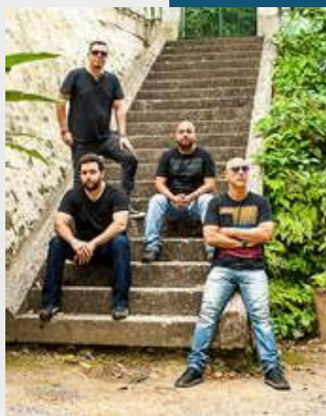
Os shows acontecem sempre às 18h e às 21h