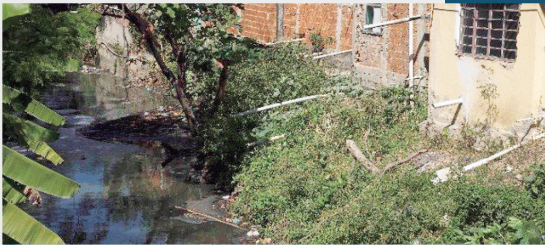
Barracos despejam dejetos no Canal do Arroio Fundo, em Jacarepaguá

A Câmara Municipal do Rio criou uma Frente Parlamentar do Saneamento nesta terça-feira. A iniciativa é do vereador Alexandre Arraes (PSDB) que quer discutir a qualidade do serviço prestado pela Cedae no município. Para iniciar o trabalho, ele conseguiu o apoio de outros 27 parlamentares, dispensando, assim, a aprovação em plenário.