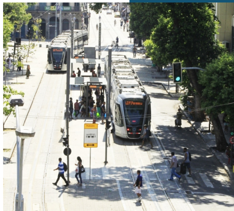
Estação do VLT da Praça Tiradentes