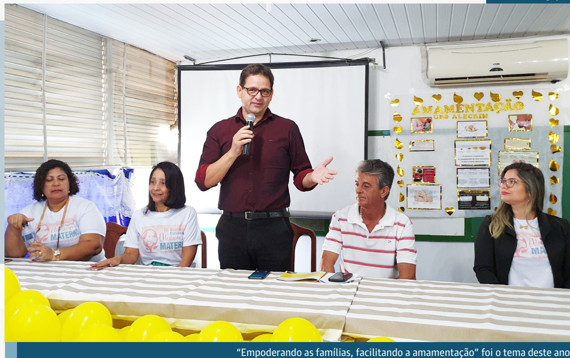
“Empoderando as famílias, facilitando a amamentação” foi o tema deste ano

O prefeito defendeu a campanha e afirmou que, como pai, reconhece os riscos que podem ser evitados com a boa instrução. “Minha prioridade no município sempre será a saúde e isso inclui