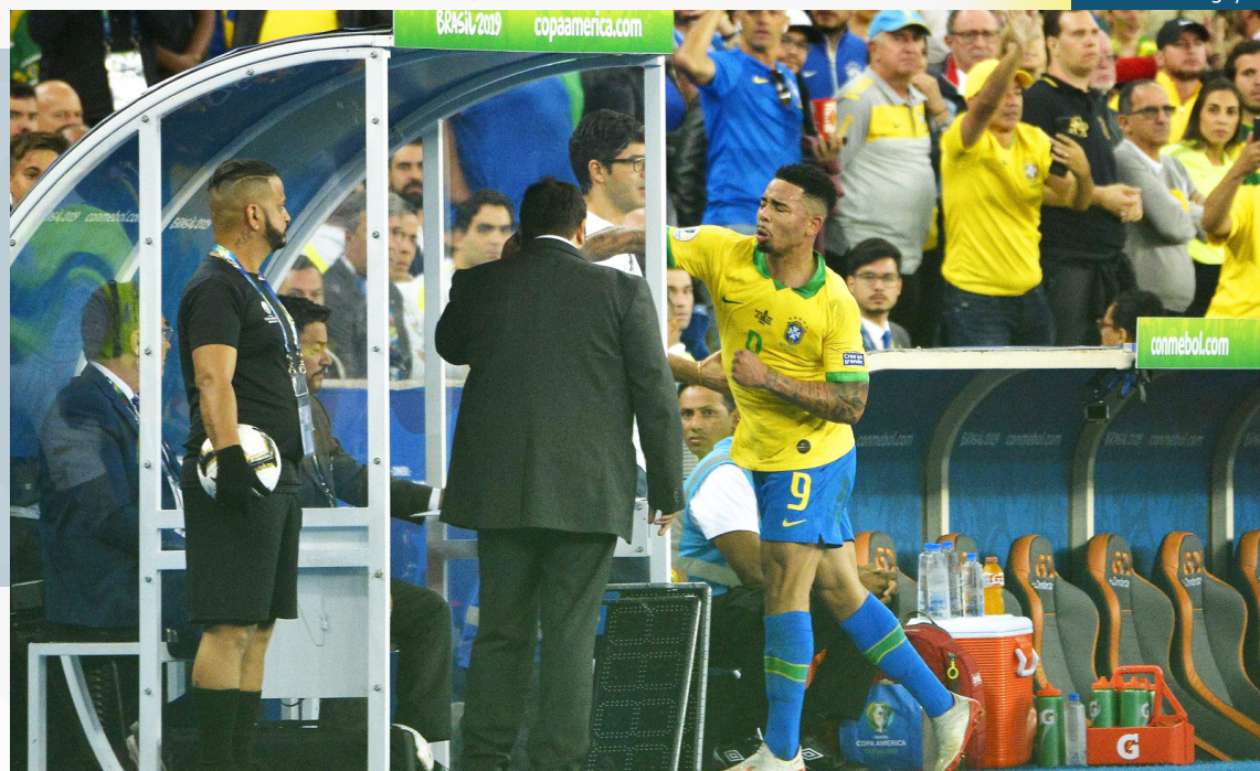
O jogador do Manchester City foi incluído nos artigos 7.1 e 7.2 do Regulamento Disciplinar

O jogador do Manchester City foi incluído nos artigos 7.1 e 7.2 do Regulamento Disciplinar por "comportar-se de maneira ofensiva, insultante ou realizar manifestações difa-