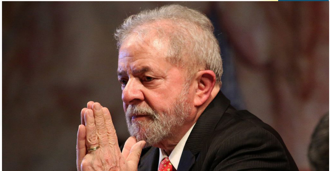
Ex-presidente Luiz Inácio Lula da Silva (PT) concede entrevista à Folha e ao El País dentro da sede da PF, em Curitiba

O julgamento também estabeleceu que a decisão de hoje tem validade até a Segunda Turma do STF julgar o pedido de liberdade de Lula que começou a ser analisado em dezembro mas teve o julgamento interrompido por um pedido de vista do ministro Gilmar Mendes.