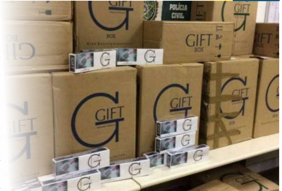
Cigarros ocupam o primeiro lugar de produtos contrabandeados

Nos últimos três anos, o Disque Denúncia do Rio de Janeiro registrou aproximadamente 3,5 mil informações sobre falsificação e contrabando de produtos em geral.