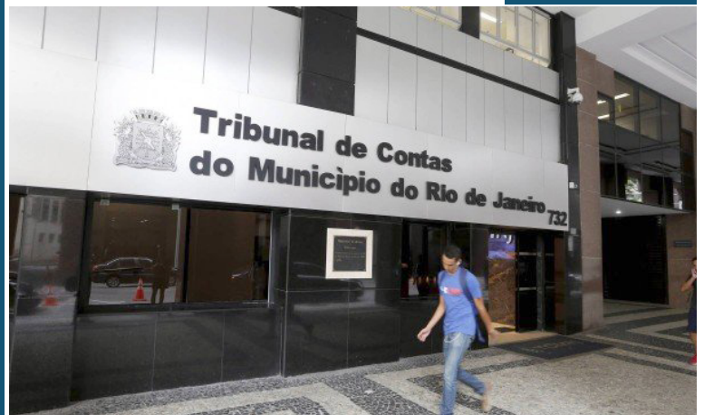
O calendário oficial prevê o pagamento dos mais de 470 mil servidores ativos

A Secretaria Geral de Controle Interno do Tribunal de Contas do Município do Rio (TCM) apurou que, dos 1.020 secretários escolares da prefeitura, 944 recebem a Gratificação por Desempenho no Cargo Técnico (GD) no nível inicial e 63 desses servidores que ocupam o mesmo cargo não recebem o benefício, porque não fizeram cursos de capacitação. De acordo com a legislação municipal (Lei 5.335/2011 e Decreto 44.679/2018), esse curso deveria ser ofertado pela Secretaria municipal de Educação após seis meses do