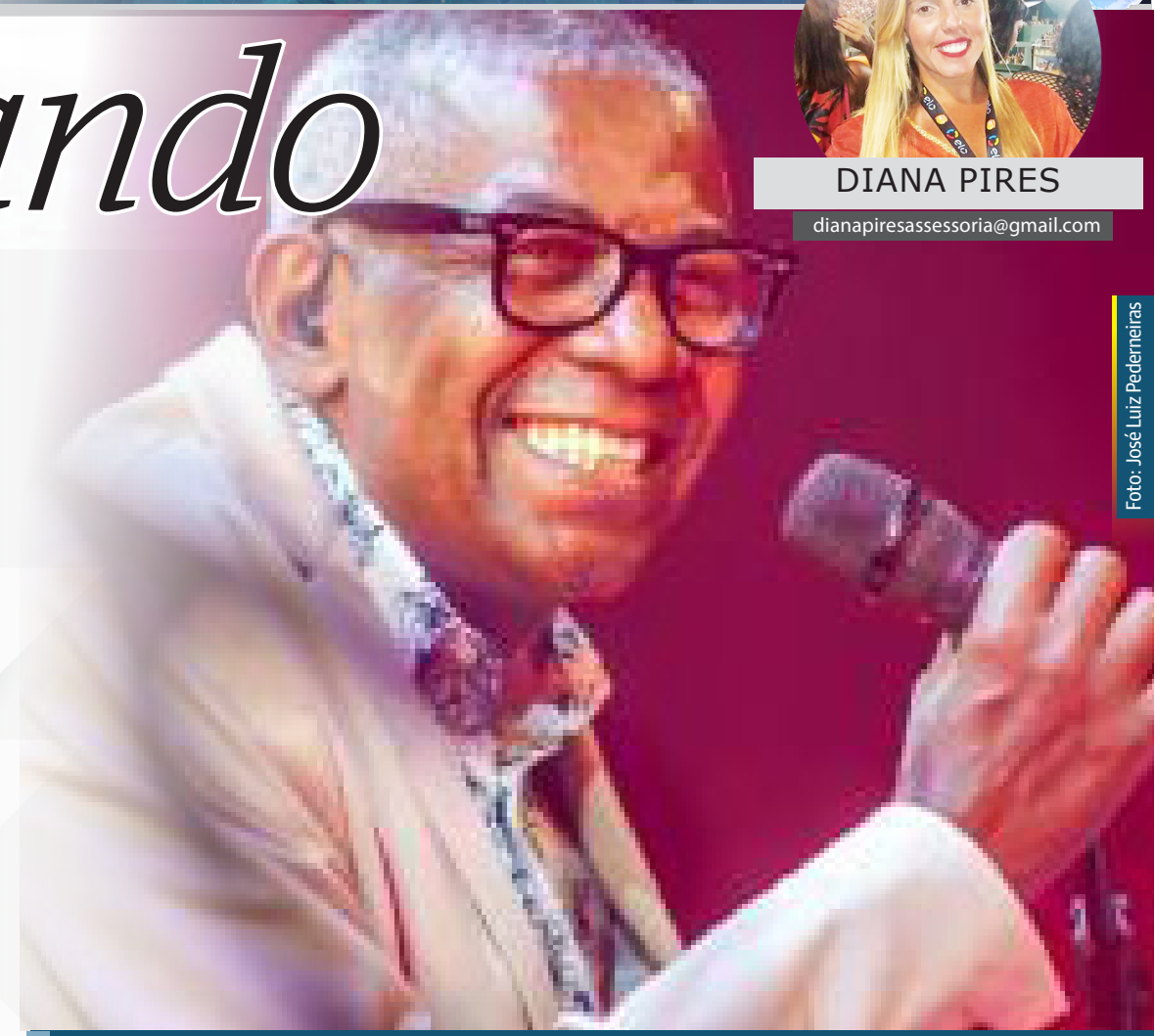
O Camarote Vivant!, que foi um sucesso na Sapucaí em 2019 como o Camarote do Samba