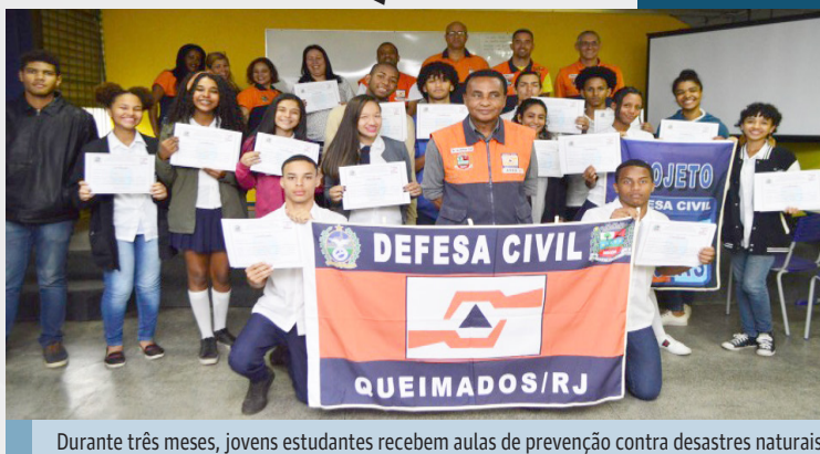
Durante três meses, jovens estudantes recebem aulas de prevenção contra desastres naturais

O curso, que têm carga horária de 40 horas e dura aproximadamente três meses, aborda conceitos básicos da Defesa Civil tais como: medidas de prevenção contra in-