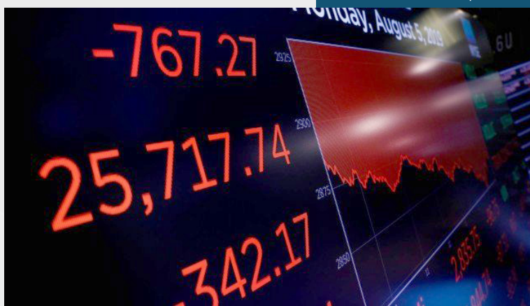
Os candidatos a gerente de captação devem ter graduação em qualquer área

Os candidatos a gerente de captação devem ter graduação em qualquer área e, pelo menos, cinco anos de experiência em bancos ou seguradoras. É exigida ainda a CPA-10, certificação para profissionais que atuam com comercialização e distribuição de produtos de investimento diretamente junto ao público investidor. A CPA-20,