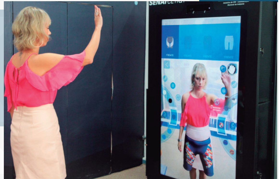
Os projetos selecionados serão desenvolvidos de forma gratuita na instituição