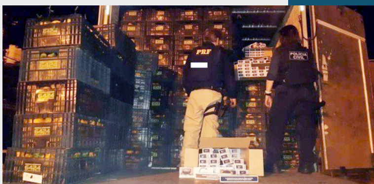
Somadas, as duas cargas chegam a 10 milhões de cigarros

O primeiro caminhão foi interceptado na pista sentido Rio, na manhã de terça-feira, e estava carregado de maracujás. Em meio as frutas, foram encontrados mais de 271 mil maços e cerca de 5 milhões