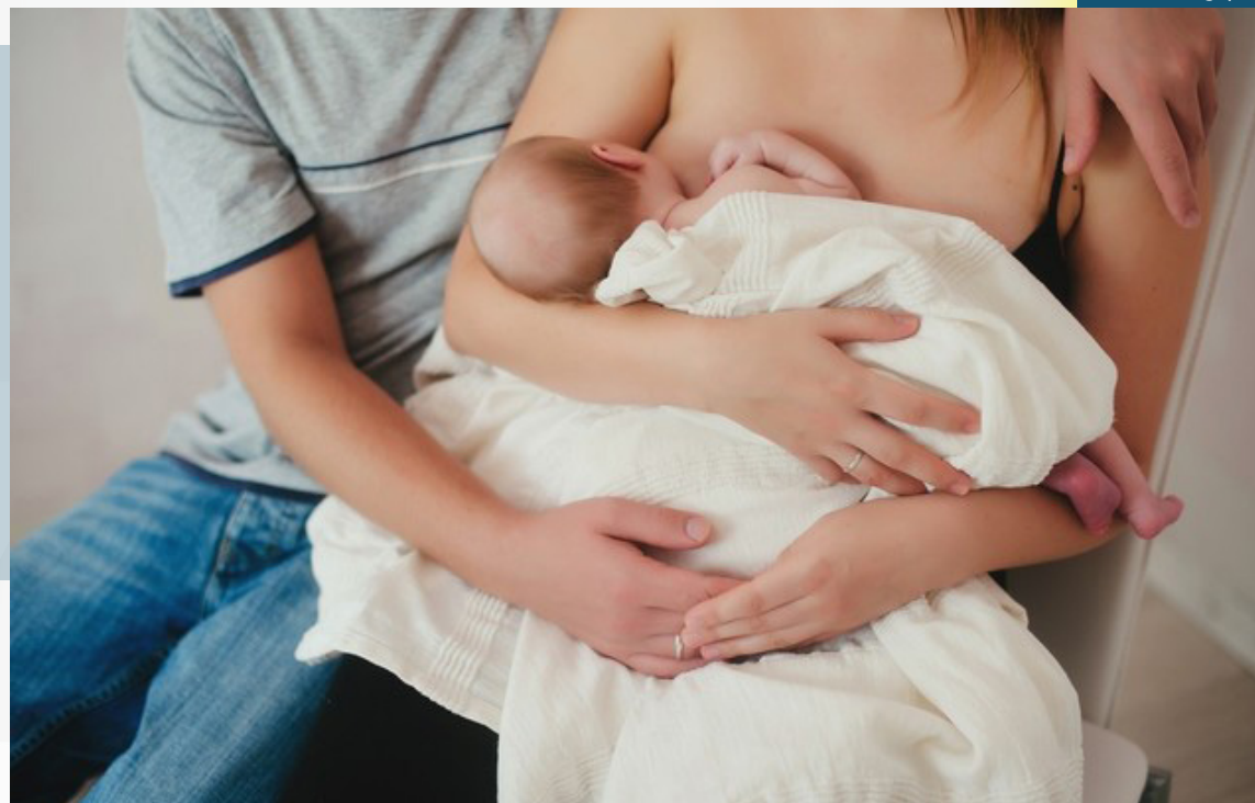
No Rio, vários eventos trazem palestras e orientações sobre o tema

sáveis sobre a amamentação em livre demanda.