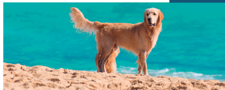
Projeto vai para sanção do prefeito Marcelo Crivella