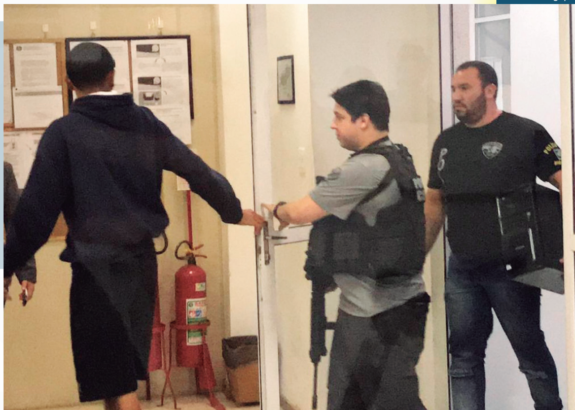
Os policiais então se infiltraram nos grupos de WhatsApp e constataram o compartilhamento de fotos

Os 13 alvos desta operação de busca e apreensão estão localizados nos seguintes municípios: Rio de Janeiro (Jacarepaguá, Campo Grande e Andaraí), Itaguaí, Miracema, Campos dos Goytacazes, Araruama, Silva Jardim, Barra Mansa, Nova Iguaçu e São Gonçalo.