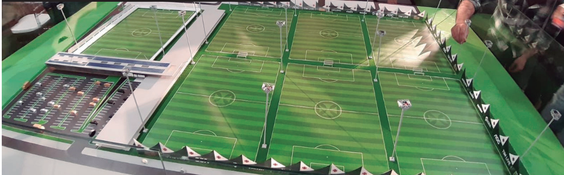
A projeção do Centro de Treinamentos está sendo feito por etapas