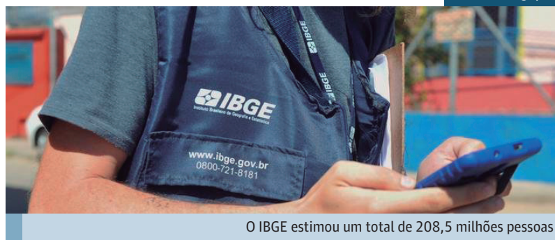
O IBGE estimou um total de 208,5 milhões pessoas

As estimativas populacionais são um dos parâmetros utilizados pelo Tribunal de Contas da União para o cálculo do Fundo de Participação de Estados e Municípios e são referência para vários indicadores sociais, econômicos e demográficos.