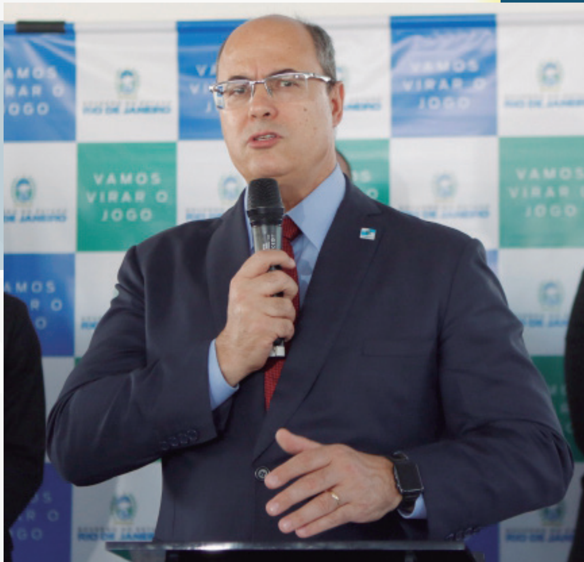
De acordo com Witzel, as cerca de 150 delegacias existentes serão encerradas e os policiais serão concentrados em 40 distritos

"Esse modelo vai permanecer para os próximos 20, 30 anos. Ele vai funcionar, porque o estado não tem receita tão grande. É um modelo que precisamos aprimorar e nada melhor do que nesse momento que estamos tratando de evolução para falar de evolução", acrescentou.