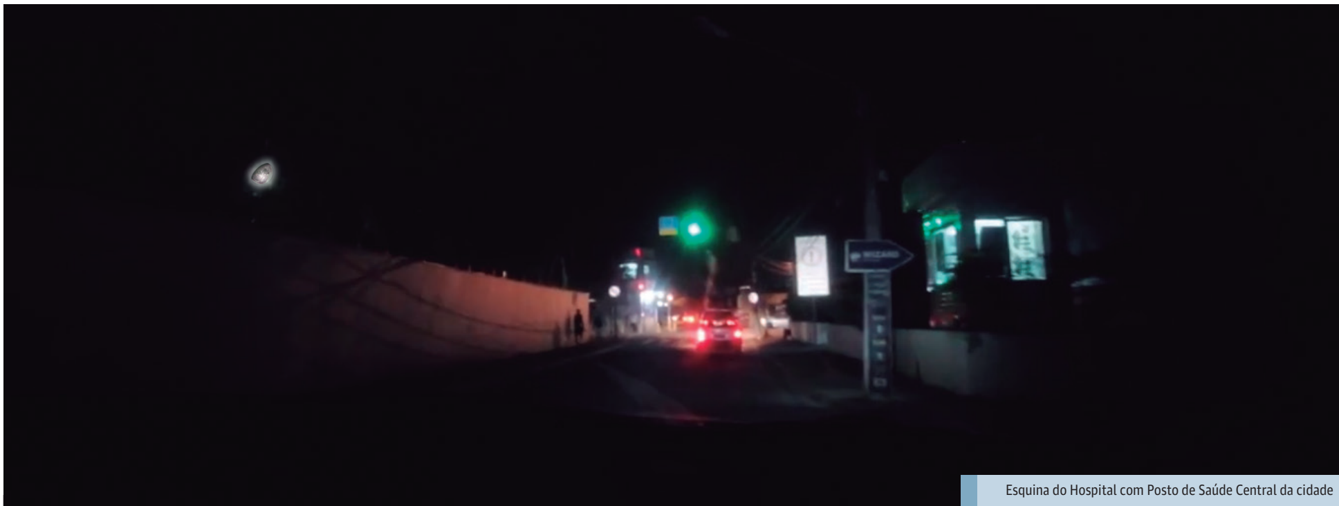
Esquina do Hospital com Posto de Saúde Central da cidade