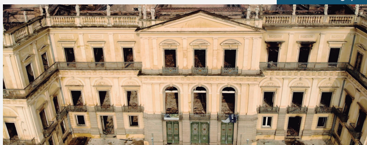
Desse total, R$ 8,9 milhões foram utilizados nas obras de emergência para a recuperação do prédio

Além disso, a Organização das Nações Unidas para a Educação, a Ciência e a Cultura (Unesco) vai gerir mais R$ 5 milhões - essa verba será utilizada na elaboração de dois projetos: um para a reconstru-