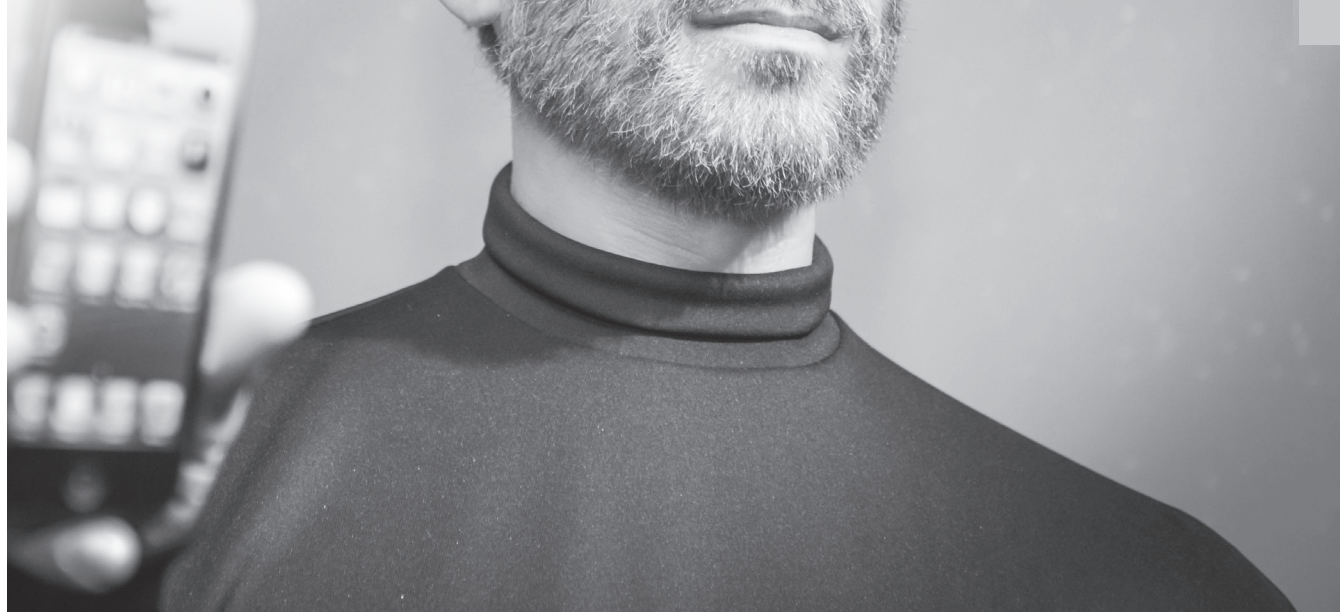
Na mostra estão expostas mais de 30 réplicas de personalidades, entre elas, a Margarida, tubarão mangona mais conhecida

Logo na entrada, o badalado personagem Tyrion Lannister, de Game of Thrones, interpretado pelo ator americano Peter Dinklage, dá as boas-vindas àqueles que pretendem se aventurar na nova atração.