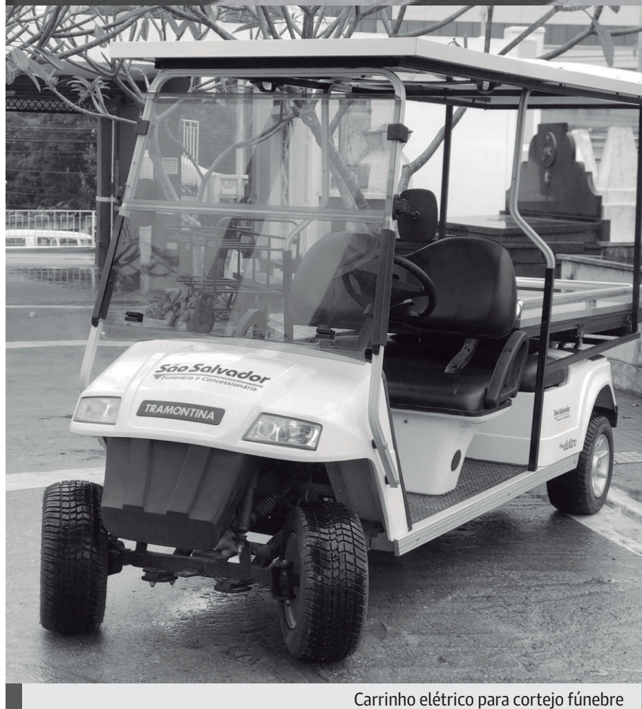
Carrinho elétrico para cortejo fúnebre