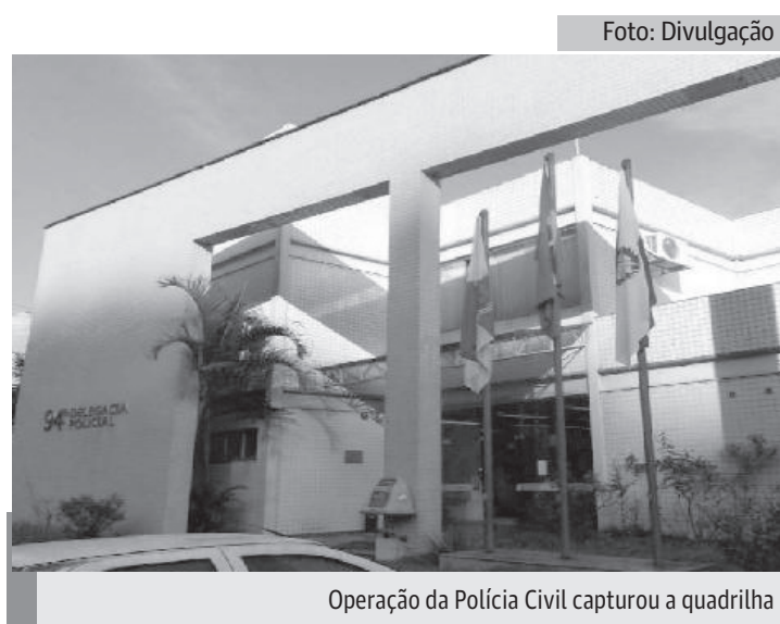
Operação da Polícia Civil capturou a quadrilha

A investigação, que durou cerca de um ano, teve início a partir de um inquérito instaurado pela 73ª DP (Neves), que apurou que as drogas vinham de fornecedores das cidades de Campos do Jordão, São José dos Campos e Ribeirão Preto, onde também