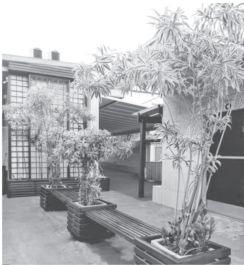
Reforma das capelas

Hoje no Cemitério Municipal de Nova Iguaçu, as ruas são chamadas de alamedas e todas tem nomes; Alameda da Saudade, Alameda do Adeus... Todos os nomes são lúdicos e remetem a saudade, a despedida, a falta que o ente querido fará em nossas vidas. Isso é respeito... Todos os detalhes são pensados com carinho para fazer com que essa experiência de perda seja o menos traumática possível. E pensando assim, a Funerária e Concessionária São Salvador segue seu caminho inovando e aperfeiçoando seu atendimento para melhor servir.