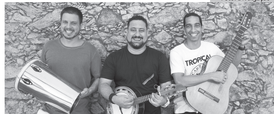
A proposta é iniciar uma temporada para celebrar o momento atual do samba

Domingo, a partir das 14 horas, o Renascença Clube traz quatro grupos, oriundos da Zona Norte, que se destacam no cenário atual do samba - Arruda, Galocantô, Samba do Xoxó e Samba do Chapéu - pela 1ª vez juntos, no mesmo evento: “Samba do nosso - imitado.