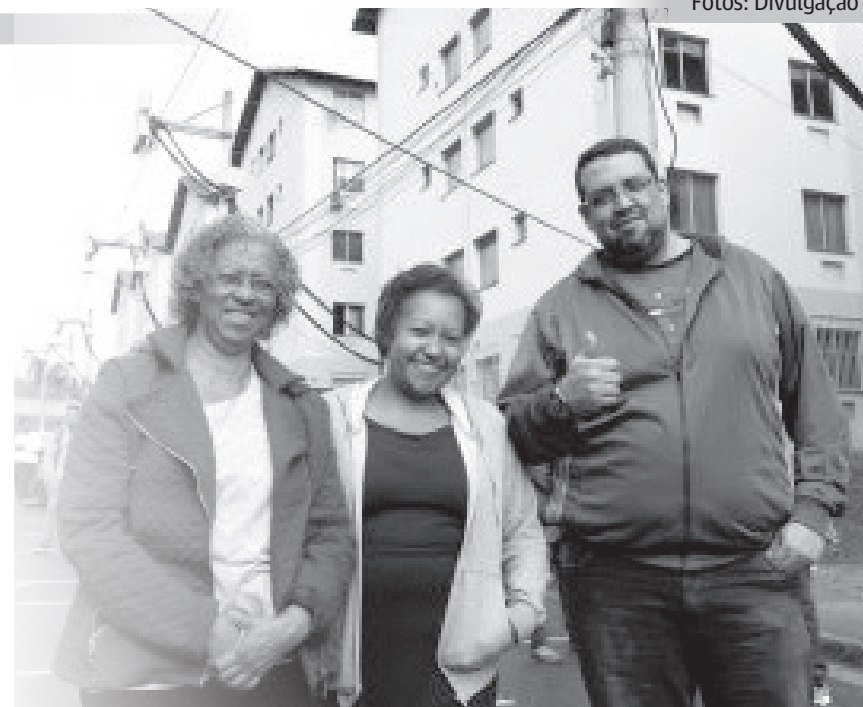
O RGI é muito mais que um pedaço de papel

- O RGI é muito mais que um pedaço de papel. É a posse de uma história que foi muito sofrida. Hoje esse documento sacramenta uma vitória, tradu-