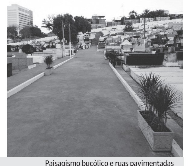
Paisagismo bucólico e ruas pavimentadas