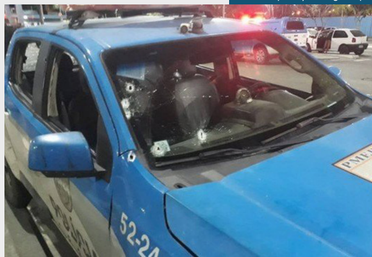
Um policial militar morreu e outros dois ficaram feridos após uma troca de tiros com bandidos

Os agentes feridos foram levados para o Hospital muni-