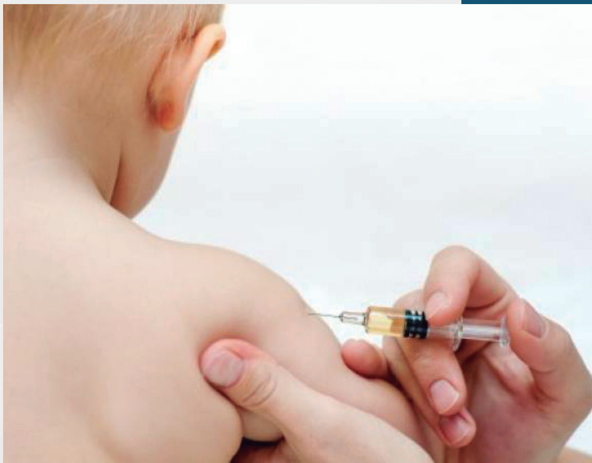
O Ministério da Saúde alerta que crianças de 6 meses a menores de um 1 de idade devem ser imunizadas antes de se deslocarem para cidades com surto da doença

Vale ressaltar que as vacinas não protegem somente contra o sarampo. A tríplice viral previne também contra rubéola e caxumba e a tetra viral, contra as três anteriores.