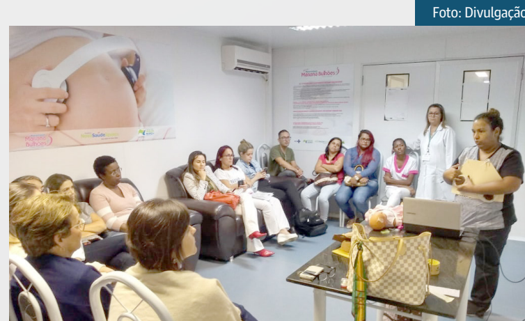
O aleitamento materno nos seis primeiros meses de vida supre todas as necessidades

O fechamento das ações do 'Agosto Dourado' será com uma capacitação para os profissionais da Maternidade, nos dias 26 e 27, sobre aleitamento