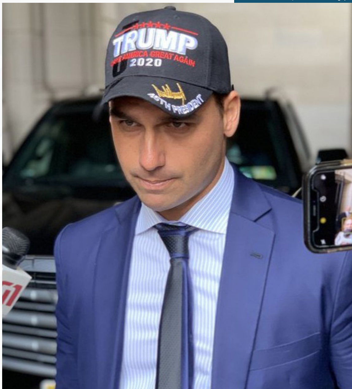
Na manhã desta sexta-feira, o presidente Bolsonaro indicou que deve enviar o nome de Eduardo ao Congresso

Porém, Jair Bolsonaro e o presidente dos Estados Unidos, Donald Trump, trataram do assunto publicamente. O chefe de estado brasileiro anunciou sua intenção de indicar o filho quando ele completou 35 anos - condição para assumir o posto.