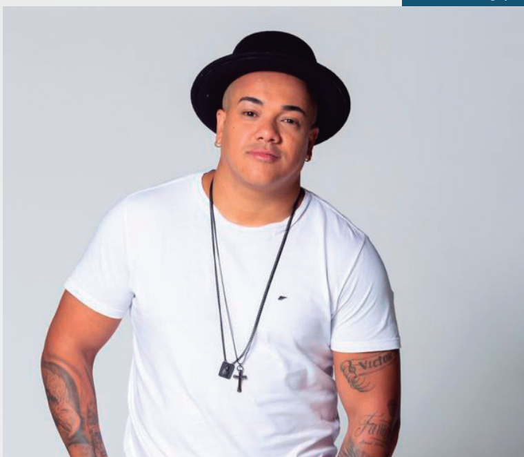
Os artistas se apresentam em mais uma edição do projeto 'Sou Feliz Assim'

Ainda no repertório do show, outros hinos já conhecidos da