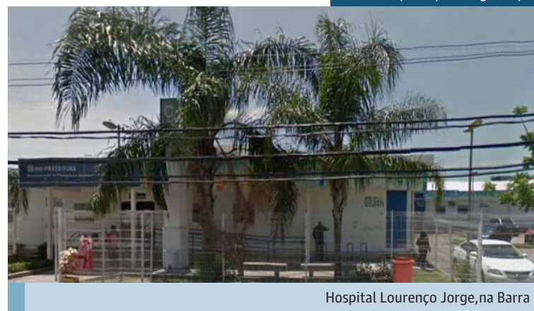
Hospital Lourenço Jorge, na Barra

Um bebê de nove meses deu entrada com graves sinais de espancamento, traumatismo craniano e queimaduras que seriam provocados por cigarro no Hospital Lourenço Jorge, na Barra da Tijuca, Zona Oeste, na noite desta quinta-feira. A mãe que chegou com a criança no local e teria dito que as agressões foram cometidas por uma cuidadora.