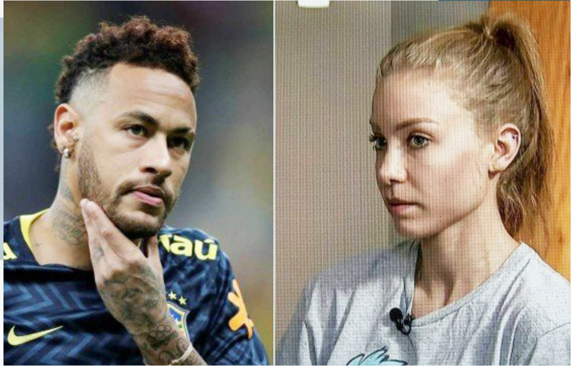
Polícia conclui que Neymar não cometeu crime de estupro

"Esse vai ser um capítulo jamais esquecido na minha vida por muitos motivos, o principal deles 'O DANO' causado em mim, na minha família e nas pessoas que realmente me conhecem. Vou ser sincero e não vou dizer que estou feliz, mas sim aliviado. A cicatriz vai continuar pra me lembrar o quanto o ser humano é capaz de fazer coisas boas mas também de fazer coisas RUINS!