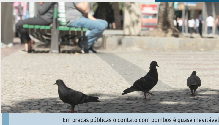
Em praças públicas o contato com pombos é quase inevitável

"A pessoa inala o fungo, que vai para o pulmão, cai na circulação sanguínea e pode atingir vísceras, ossos, sistema nervoso central e as meninges. Pode levar à morte especialmente