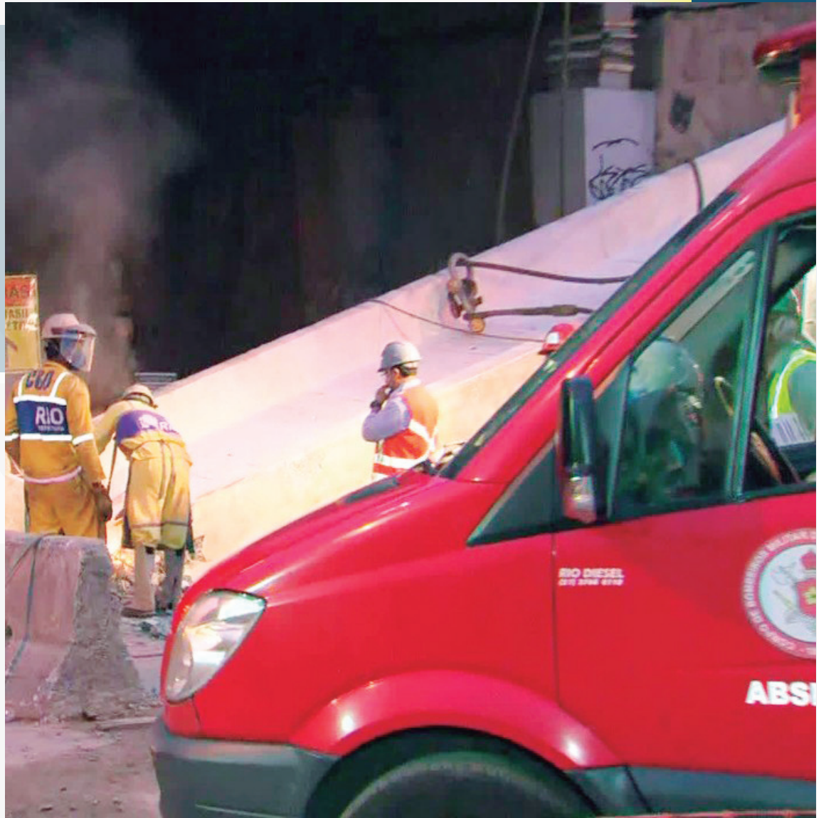
Acidente ocorreu na noite desta quinta-feira. Avenida Brasil foi liberada às 9h20

Dois guindastes foram acionados pra içar as novas vigas do viaduto. A primeira foi erguida às 2h. Só depois da retirada da segunda viga é que os corpos das vítimas puderam ser removidos pelos bombeiros.