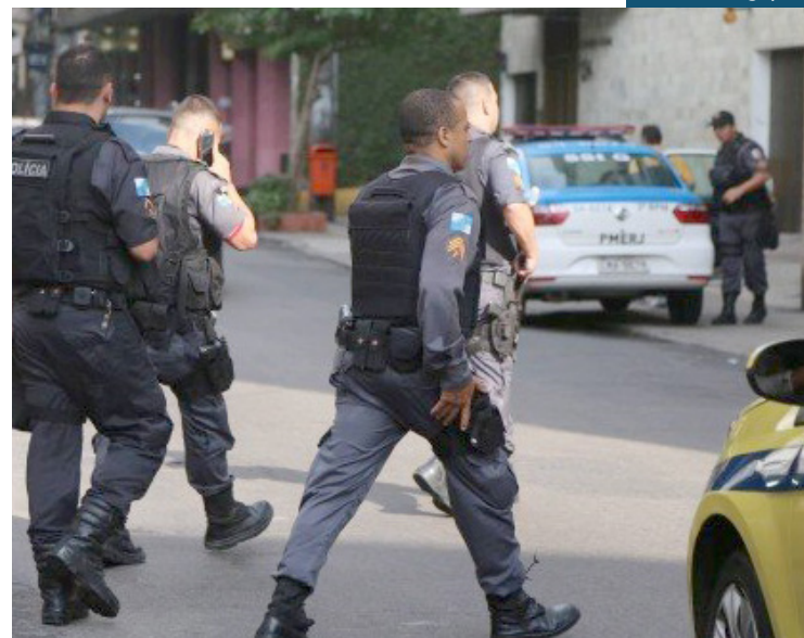
PMs receberão o pagamento em atraso

A Polícia Militar e a Polícia Civil informaram, ontem, que vão pagar na próxima terça-feira, dia 20, o Regime Adicional de Serviço (RAS) atrasado dos meses de junho e julho dos agentes das corporações.