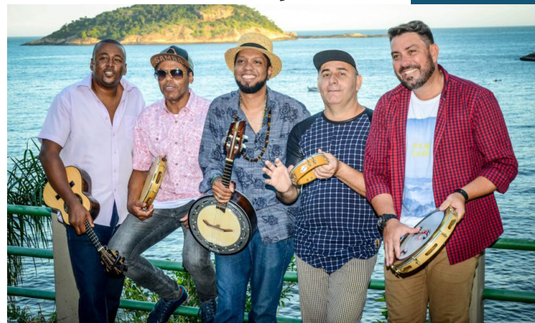
Neste sábado, a partir das 17h, no Renascença Clube

Samba e futebol... Não existe mistura melhor! Neste sábado, a partir das 17h, no Renascença Clube, os Grupos Explode Coração e Filhos da Guanabara prometem muito samba de raiz. Ainda, haverá a transmissão do jogo Flamengo e Vasco, que vai ter uma torcida muito animada, afinal, a cada gol será sorteado um balde de cerveja.