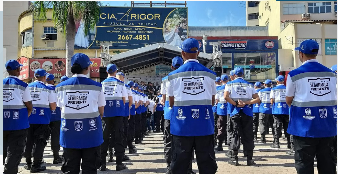
Programa de patrulhamento começou a atuar nas ruas de Nova Iguaçu

"O Rio de Janeiro todo merece respeito. E estamos governando para todo o Estado, e para a Baixada não é diferente. O programa vai ajudar no comércio, para que as famílias