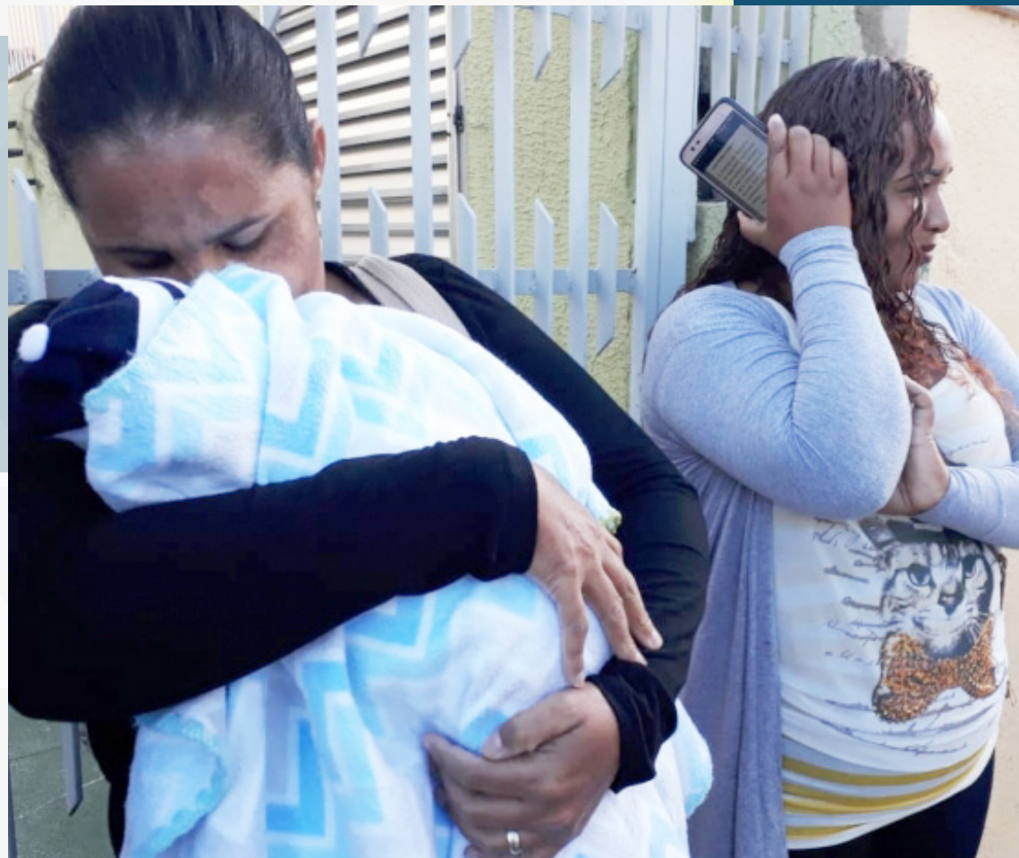
Avó não tinha com quem deixar o neto de quatro meses e trouxe para o local onde foi prometido emprego no Centro de Niterói. Anúncio era falso

No local onde se prometia 1.500 vagas de empregos só