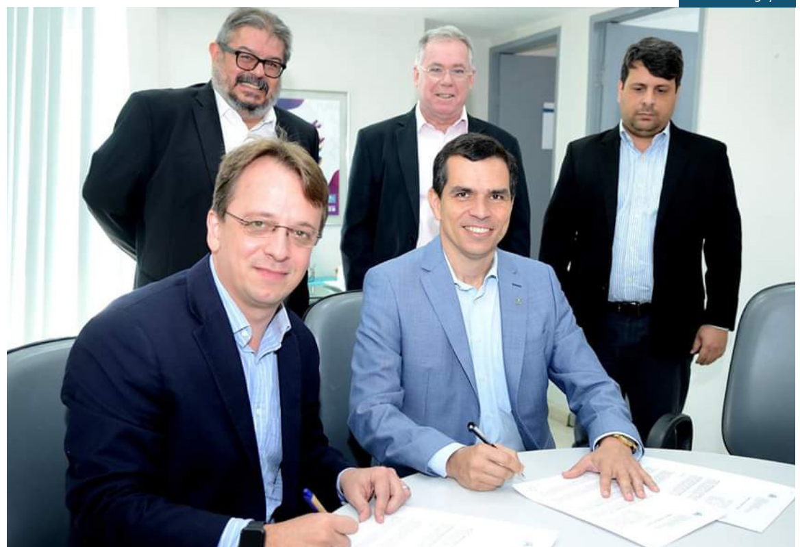
Procurador da Lava Jato em Curitiba responde a processo disciplinar