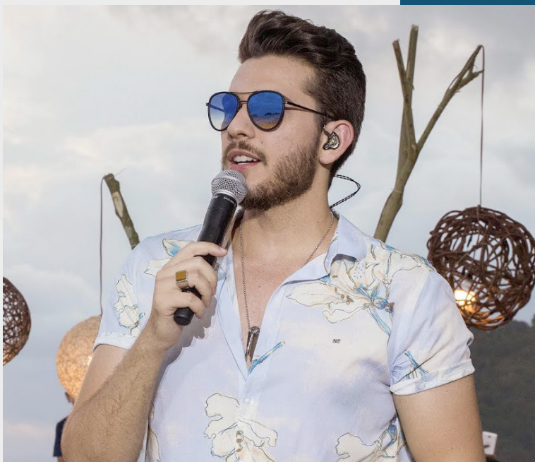
O cantor sertanejo mostra sua nova turnê 'Pé na Areia'

Em 2012, gravou seu primeiro álbum, 'Fora de Moda'. Uma das faixas, "Ela não gosta de mim", ultrapassou 10 milhões de acessos no Youtube. Mas foi em 2016, com a canção "Impressionando anjos", uma das mais tocadas nas rádios brasileiras, que Gustavo ficou conhecido. O videoclipe contou com a participação de Murilo Rosa e atingiu 25 milhões de visualizações na internet.