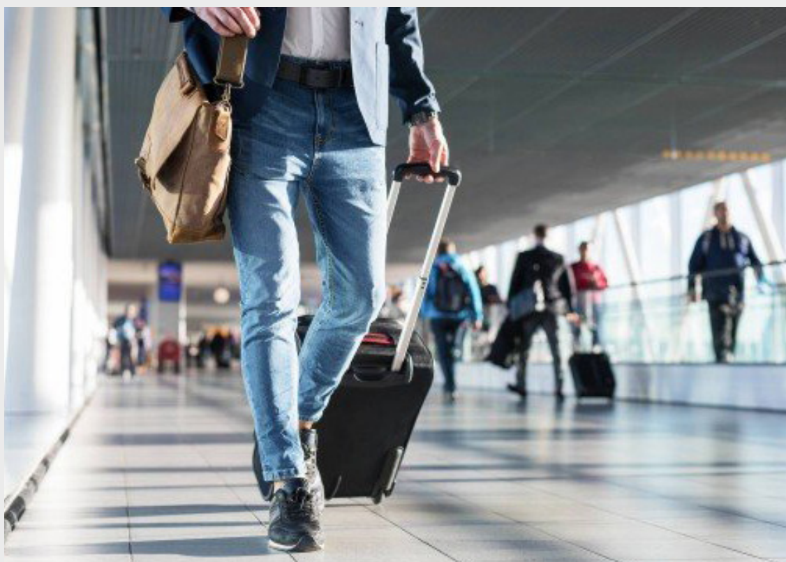
Empregado que foi transferido diversas vezes tem direito ao benefício

Empregado que precisa mudar de cidade várias vezes por causa de trabalho deve receber adicional de transferência. Esse foi o entendimento da 3ª Turma do Tribunal Superior do Trabalho ao julgar uma ação de um gerente de um banco o que foi transferido quatro vezes em oito anos.