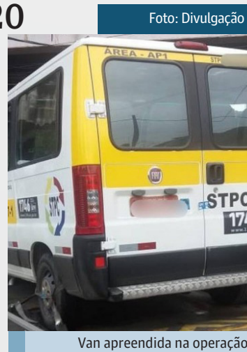
Van apreendida na operação

De 1º de janeiro a 10 de agosto de 2019 o órgão removeu das ruas 2.178 vans e kombis, sendo 483 piratas. Os bairros com maior número de veículos apreendidos por não