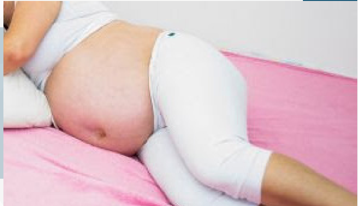
Os nove meses de gestação podem implicar na saúde dental. Saiba como evitar transtornos

“O travesseiro de corpo também é um ótimo aliado para ser