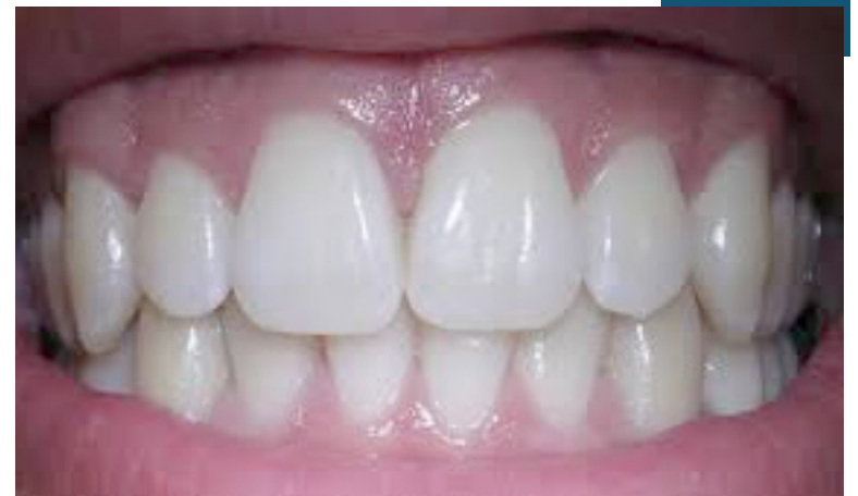
Especialista elenca cuidados para preservar e evitar doenças na região

Deve ser feita de pelo menos três vezes ao dia, principalmente depois das refeições e quando há um consumo maior de alimentos ricos em açúcar. Além disso, é importante prestar atenção na força aplicada ao escovar e também na maciez das cerdas da escova. “Colocar muita força durante a escovação pode afetar a gengiva, deixando-a mais propensa a desenvolver alguma retração, como consequência, vai expor a dentina e causar sensibilidade”, explica. Existe hoje no mercado escovas à bateria com vibrações sônicas que apresentam benefícios superiores quando comparado a escova manual, auxiliando na higienização da linha da gengiva e entre os dentes. “Usar a tecnologia ao nosso favor é algo funda-