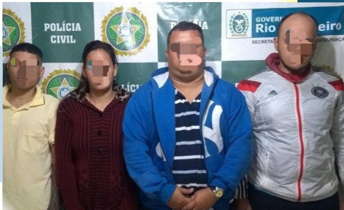
Polícia prendeu quatro acusados de integrar milícia em Belford Roxo

A milícia que atua na região também é acusada de matar uma pessoa,