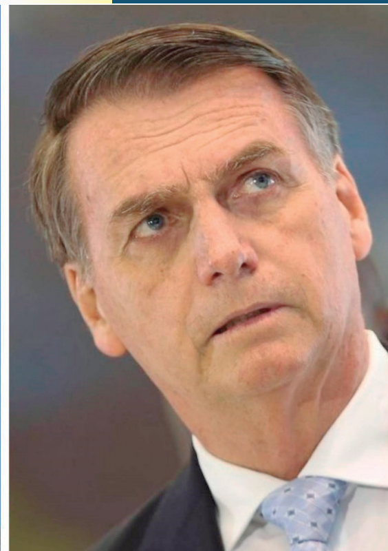
O presidente não é obrigado a dar os esclarecimentos

· se Bolsonaro sabe quem são as pessoas identificadas como responsáveis pelo crime;