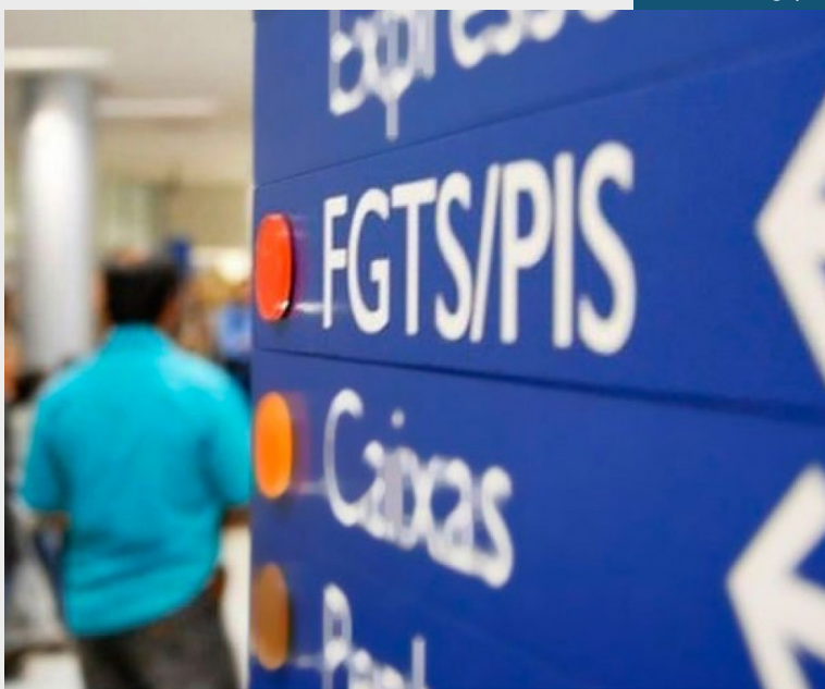
Retirada dos valores poderá ser feita de setembro a março de 2020

Além do saque imediato, a MP 889 traz a modalidade do saque aniversário que prevê, a partir de 2020, a possibilidade de o trabalhador retirar, anualmente, um percentual de seu saldo no FGTS. A previsão é de que o saque ani-