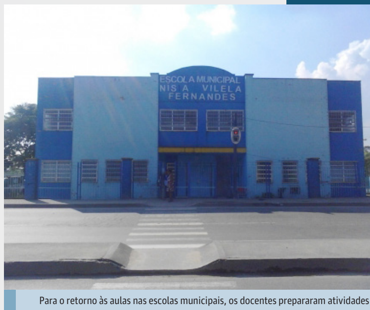
Para o retorno às aulas nas escolas municipais, os docentes prepararam atividades