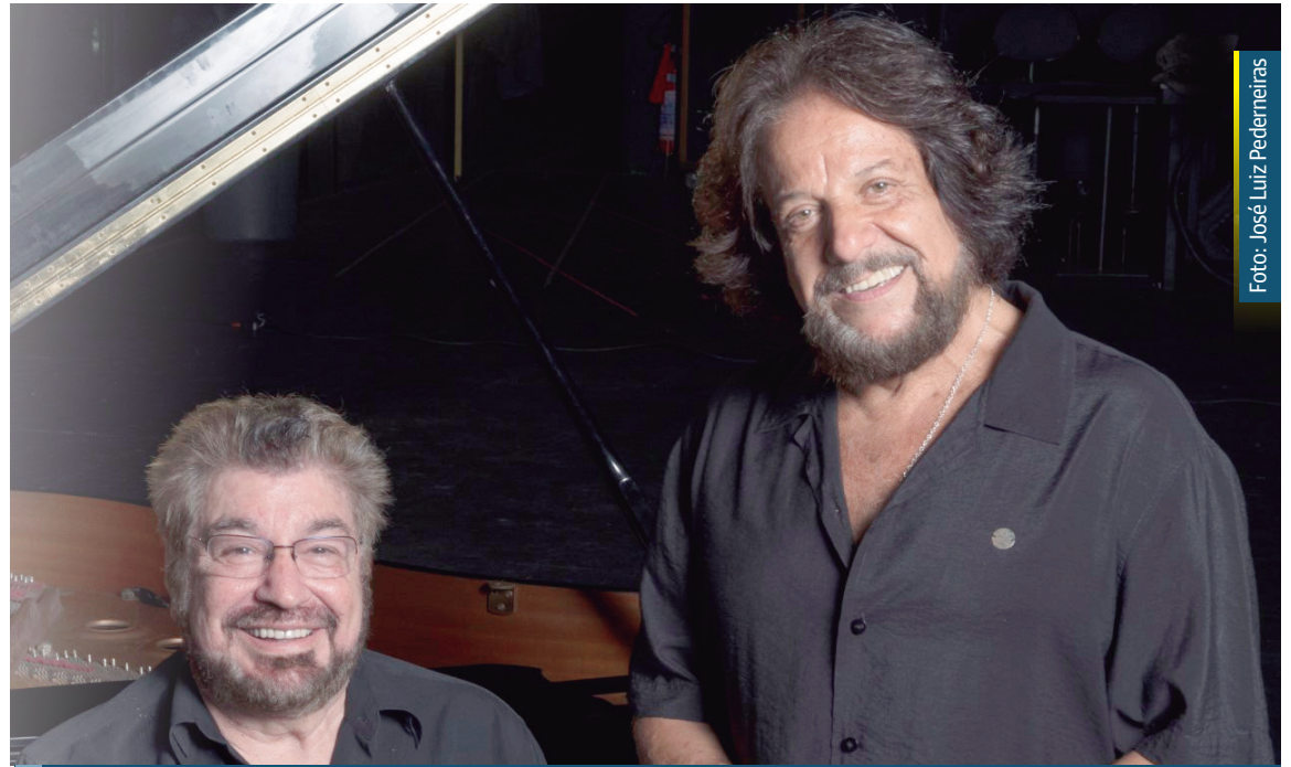
Saudade da Elis (As Aparências Enganam) abre a série de shows

O projeto surgiu em 2012, após Tiso participar do disco "Eternamente", em que Tunai regravou seus sucessos. Juntos, decidiram realizar essa homenagem a Elis, tendo como base apenas piano,