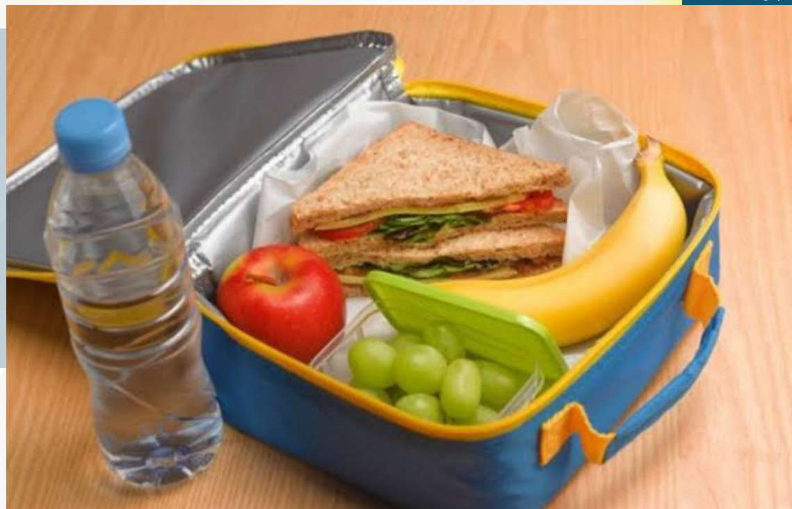
Nutricionista da Bio Mundo dá dicas de como tornar o lanche escolar mais nutritivo e saudável sem fugir da praticidade

A nutricionista informa que o importante é montar uma lancheira equilibrada. "Dê preferência para os car-