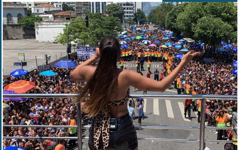
Anitta no Bloco das Poderosas, no Centro do Rio

A Riotur informou que haverá uma redução no número total de desfiles de blocos autorizados para o carnaval de rua em 2020.