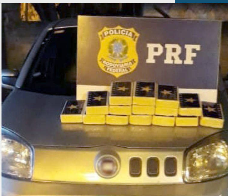
Policiais rodoviários federais faziam uma blitz na altura do quilômetro 132

fessando que receberia R$ 1 mil pelo transporte. Ele disse ter pego o carro em São Paulo e entregaria em Além Paraíba (MG).