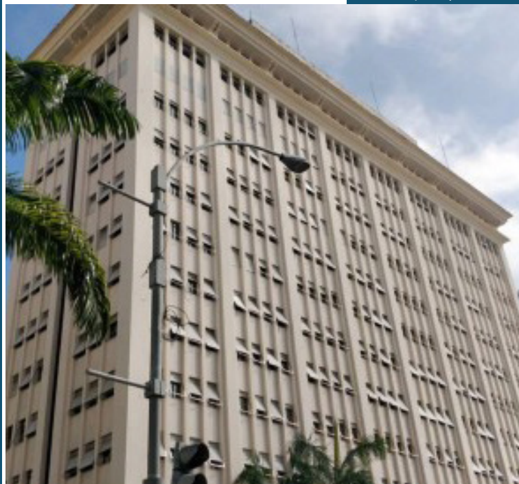
A Rede de Ouvidorias recebe da população queixas e manifestações sobre os serviços

Cerca de 100 servidores que fazem parte da Rede de Ouvidorias e Transparência do Estado vão ser capacitados durante a I Semana de Transparência, que vai ocorrer de segunda a sexta-feira (5 a 9 de agosto). O evento é realizado pela Controladoria