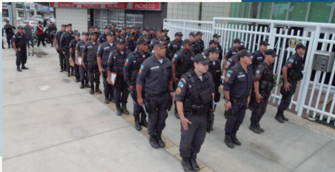
Segundo a Secretaria de Polícia Civil, 800 agentes terão direito à gratificação