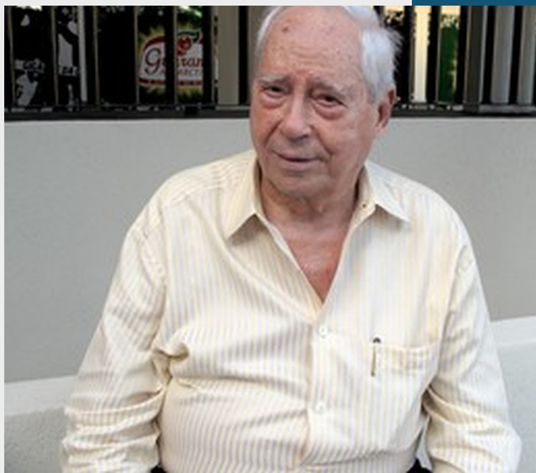
O ex-presidente foi o mais vitorioso nos 121 anos de história do clube