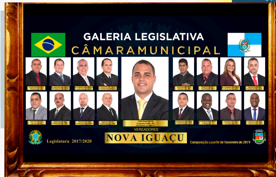
Após esta audiência, uma comissão formada pelos vereadores tem participado de diversos encontros