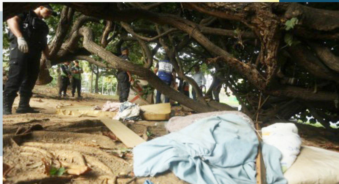
A operação começou por volta das 5h30. Cerca de vinte pessoas estavam dormindo no Jardim de Alah, em Ipanema, no momento da chegada das equipes

No Jardim de Alá, foram acolhidas três pessoas, que foram levadas para um abrigo no Centro. Uma quarta pessoa que tinha vínculo familiar, residência fixa e trabalha-