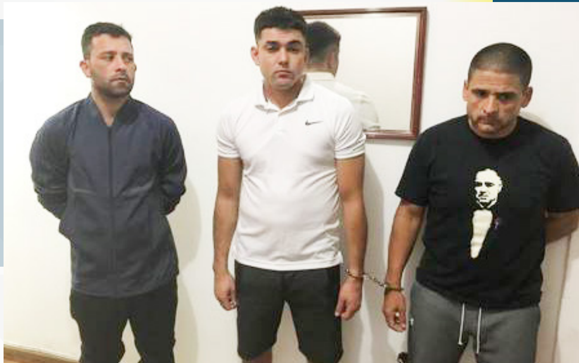
De acordo com a Polícia Civil, os criminosos, por volta das 14h deste sábado, arrombaram o portão de um prédio

Ainda segundo o delegado, as investigações começaram a partir de furto em um restaurante no Shopping Leblon, no dia 12 de agosto. O setor de inteligência das delegacias passou a monitorar a quadrilha e, quando eles voltaram ao shopping, foram interceptados nas redondezas.