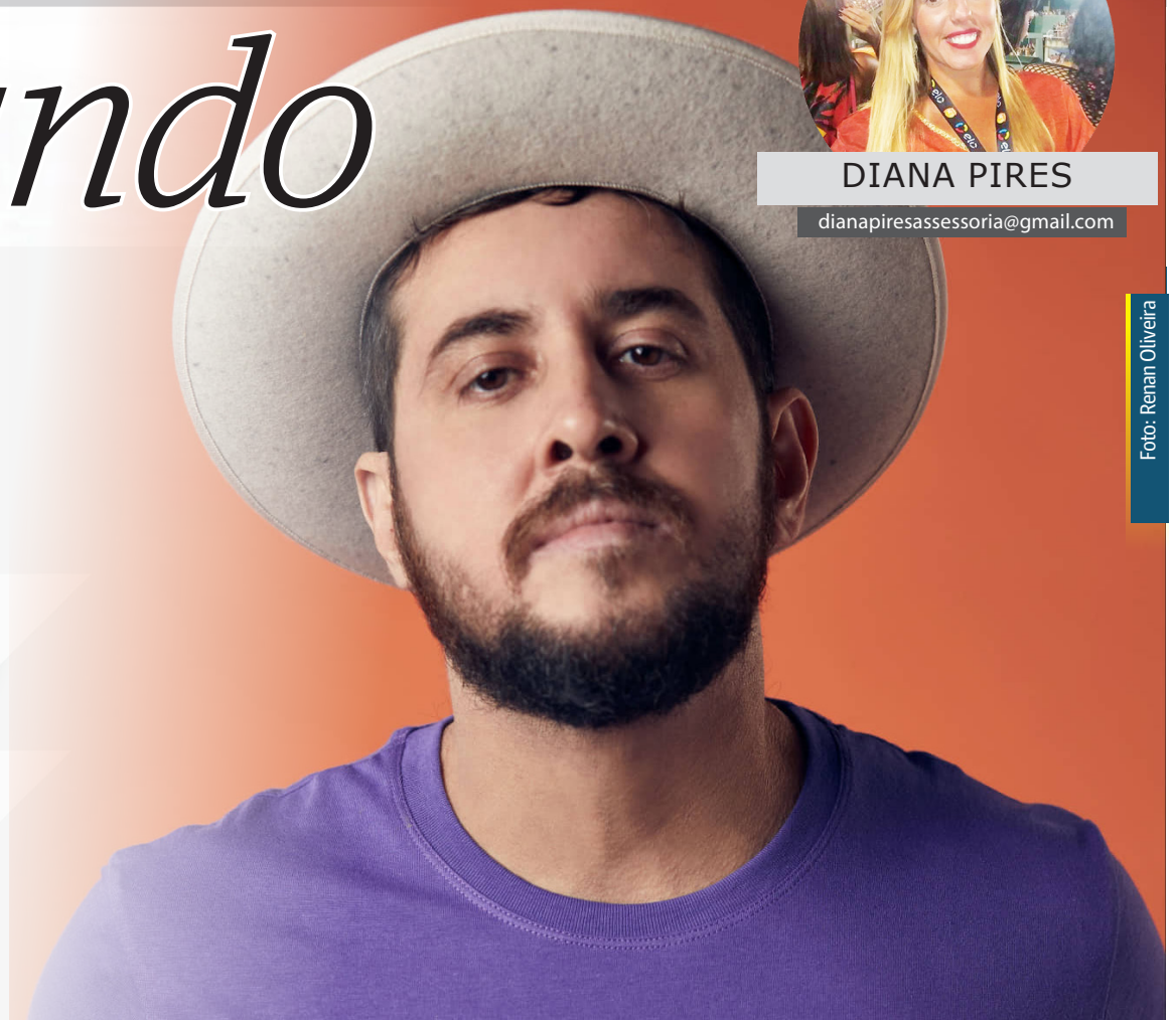
A simplicidade e talento de Suricato emocionam a plateia durante o show

No repertório as principais canções de sua discografia e releituras inspiradas.