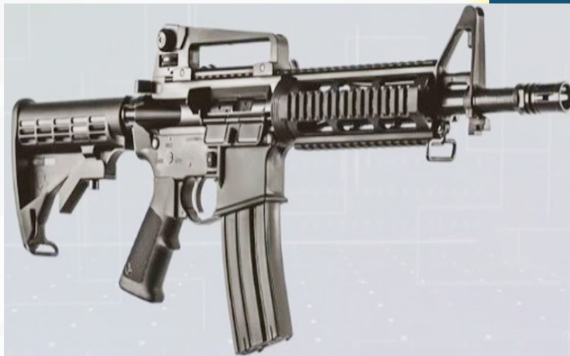
Armas classificadas como portáteis podem ser adquiridas, mas não transportadas fora de casa

Dentre as armas agora permitidas ao cidadão comum estão calibres de pistolas que antes eram de uso restrito das forças de segurança, como a 9mm e a .45. Os fuzis de diversos calibres, como 5.56mm e 7.62mm, foram classificados como restritos - ou seja, não podem ser adquiridos pelo cidadão comum.