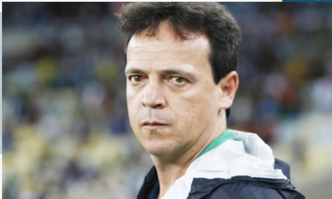
A queda aconteceu horas depois da derrota para o CSA, por 1 a 0, no Maracanã, o nono revés em 15 jogos no Campeonato Brasileiro