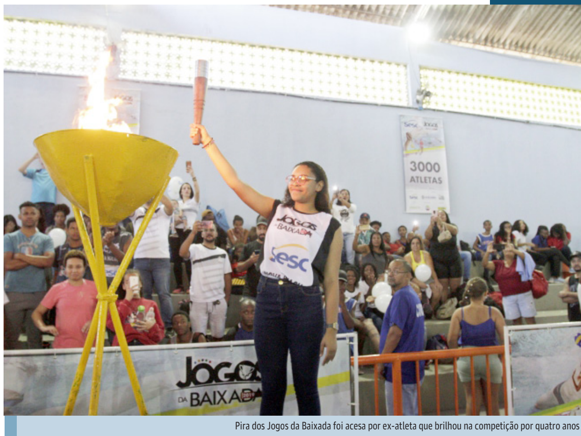
Pira dos Jogos da Baixada foi acesa por ex-atleta que brilhou na competição por quatro anos