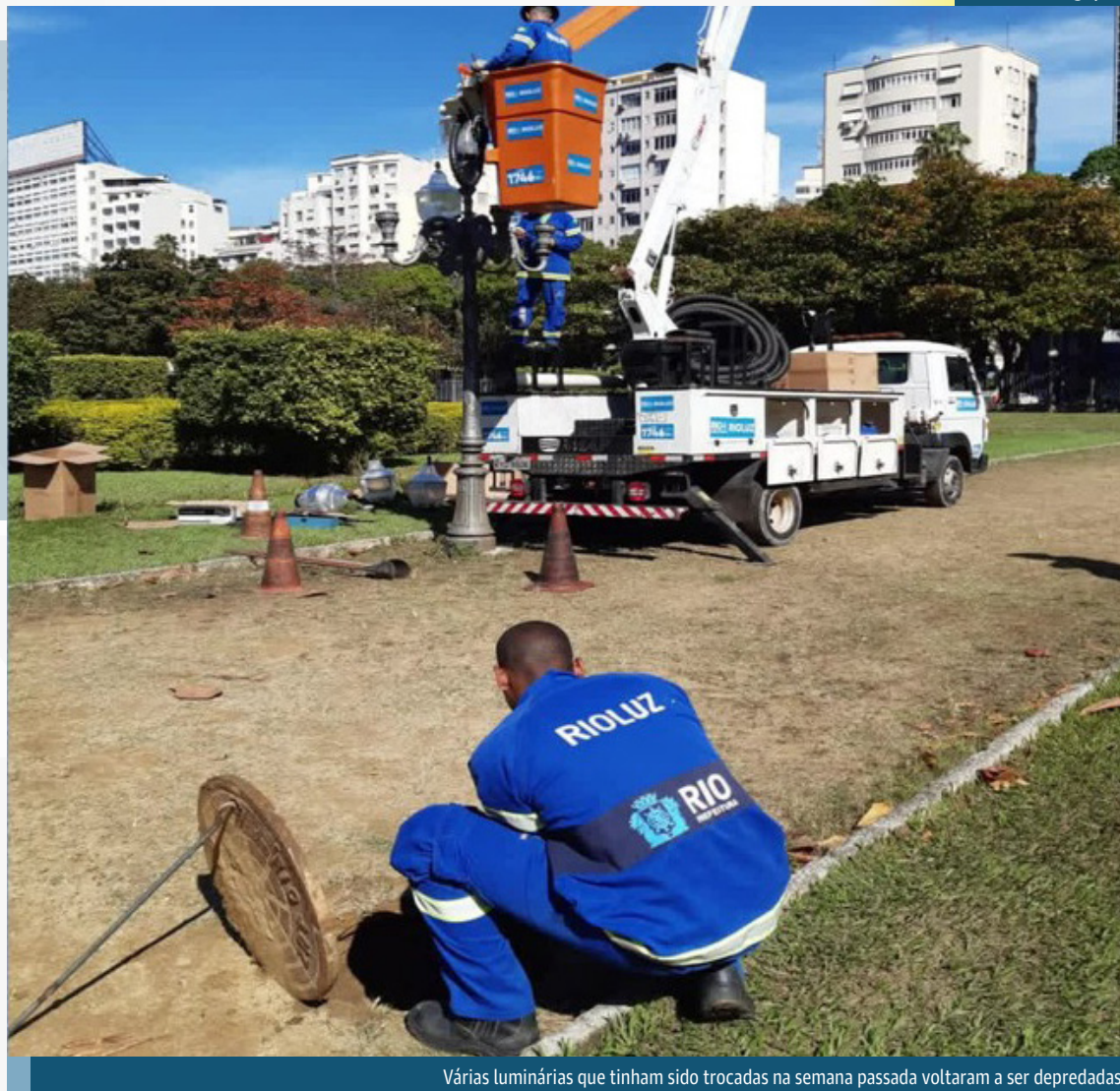
Várias luminárias que tinham sido trocadas na semana passada voltaram a ser depredadas

De acordo com a secretaria de Envelhecimento Saudável, Qualidade de Vida, o primeiro caso já foi registrado na polícia, mas o deste domingo ainda não. Segundo a prefeitura, as ocorrências resultaram num total de 106 luminárias destruídas e fios e cabos roubados, causando um prejuízo de aproximadamente R$ 300 mil.