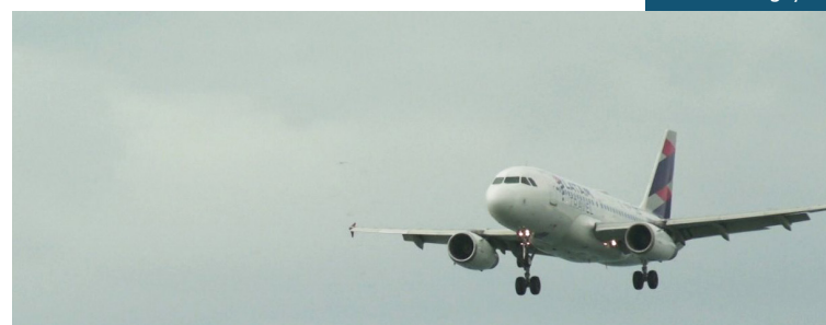
A pista principal do Aeroporto Santos Dumont, no Rio será fechada no próximo sábado