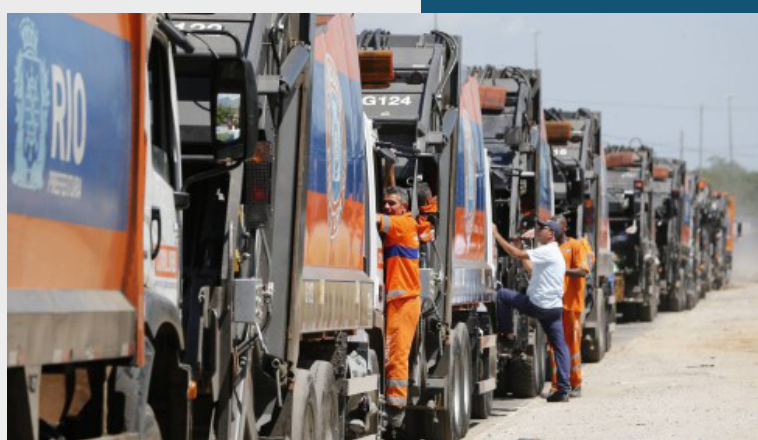
Uma das pastas atingidas foi a Comlurb