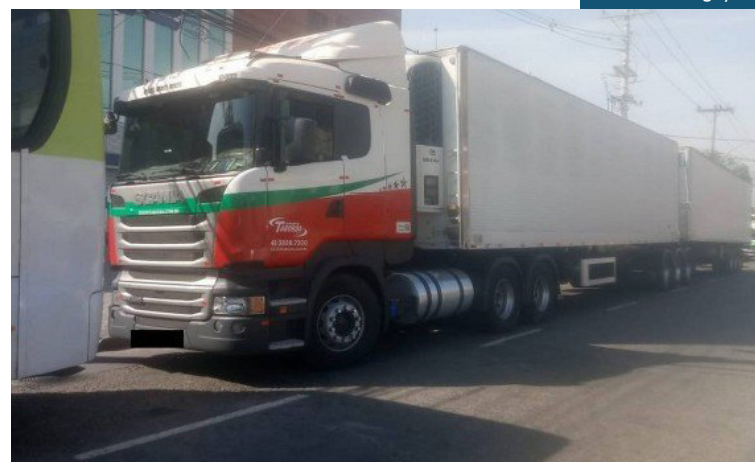
De acordo com a PM, os agentes foram local para recuperar um caminhão que havia sido roubado

Um homem morreu após trocar tiros com policiais do 41º BPM (Irajá), durante operação na Comunidade da Quitanda, Complexo da Pedreira, em Costa Barros. De acordo com a PM, os agentes foram local para recuperar um caminhão que havia sido roubado. Ao verem a carga de frango sendo descarregada, eles entraram em confronto com os