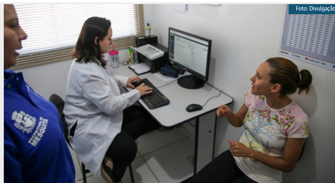
Objetivo é ampliar o atendimento a pessoas surdas em Mesquita

Esta não é a primeira iniciativa de inclusão iniciada pela prefeitura. Na educação, a secre-