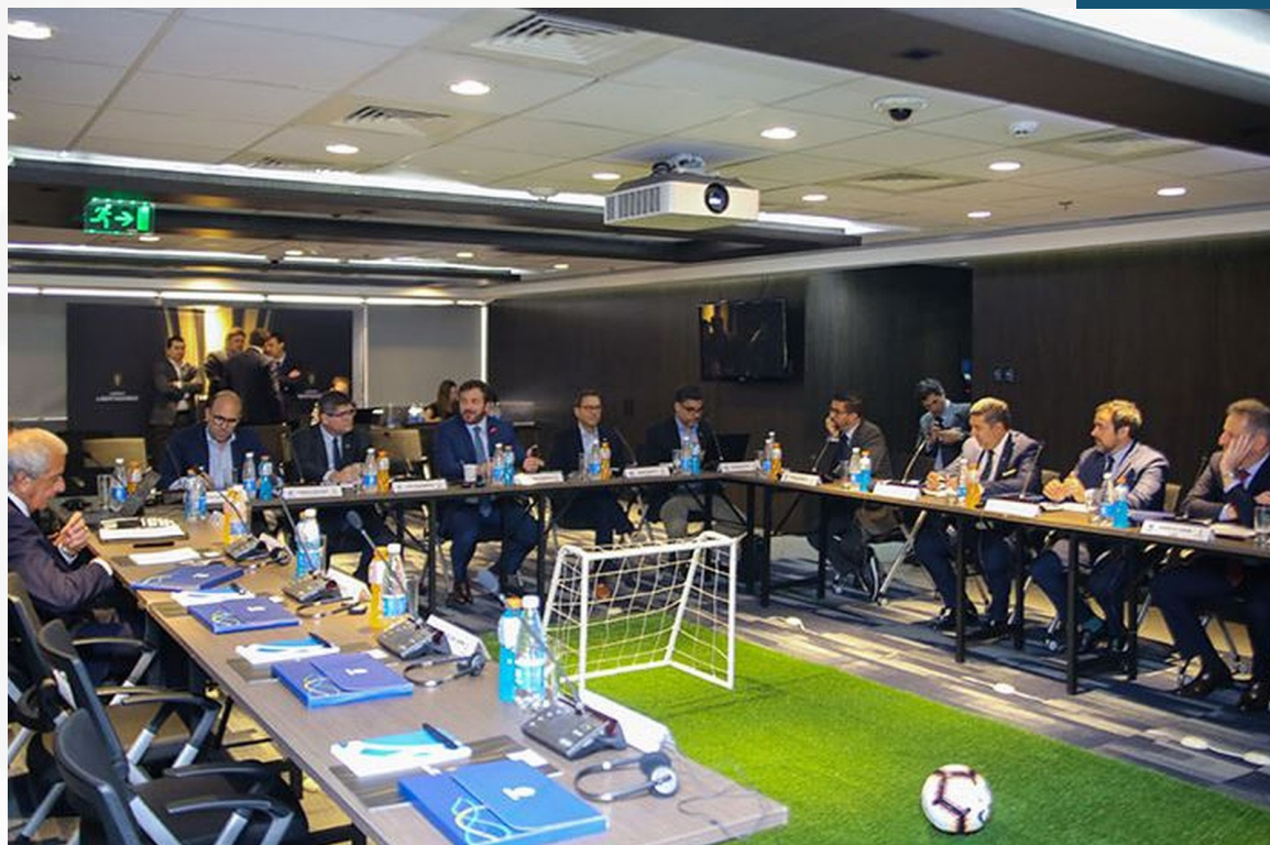
Presidente da Conmebol celebra "audiência potencial de 1,5 bilhão de espectadores" em encontro com Rubro-Negro, Boca e River no Paraguai

nal única e adiantou alguns números: disse que o jogo em Santiago, dia 23 de novembro, terá "audiência potencial de 1,5