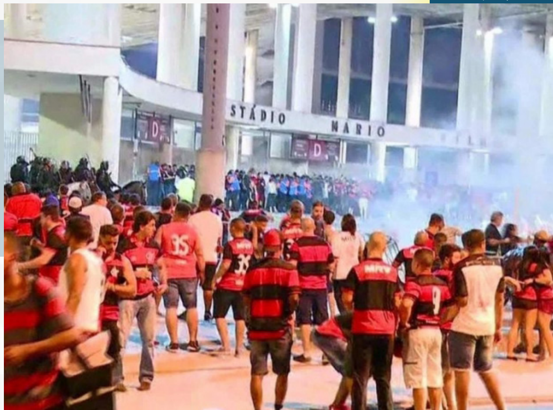
Atualmente, o sistema de reconhecimento facial no Maracanã ainda está em fase de testes

"Estamos avançando no uso de tecnologia para combater o crime. O sistema de reconhecimento facial utilizado pelas nossas forças de segurança está em operação desde março, em Copacabana. Em julho, expandimos o projeto aos acessos do Maracanã em dias de jogos. O entorno do Aeroporto Santos Dumont também receberá essas câmeras, até o fim do ano. As imagens, transmitidas em tempo real ao Centro Integrado de Comando e Controle (CICC), já ajudaram nossos policiais na captura de 49 criminosos", publicou Witzel no Facebook.