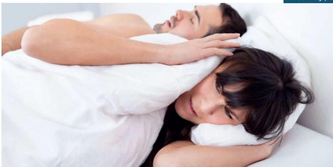
A apneia do sono atualmente atinge cerca de 30% da população adulta e pode levar até mesmo à morte

Tratamento: Inicialmente deve ser realizado o exame de Polissonografia para monitorar