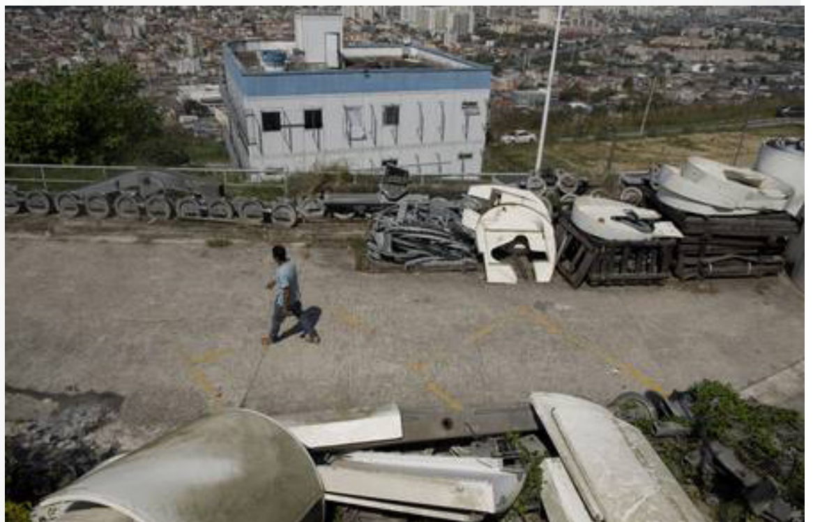
Equipamentos e peças do teleférico deterioraram na parte externa da estação do Morro do Adeus

– Se os governantes sentissem o que a população sente, tendo que subir ladeiras por uma hora, levando e buscando crianças na escola sob sol de meio-dia, talvez pudessem entender o quanto o teleférico faz falta.