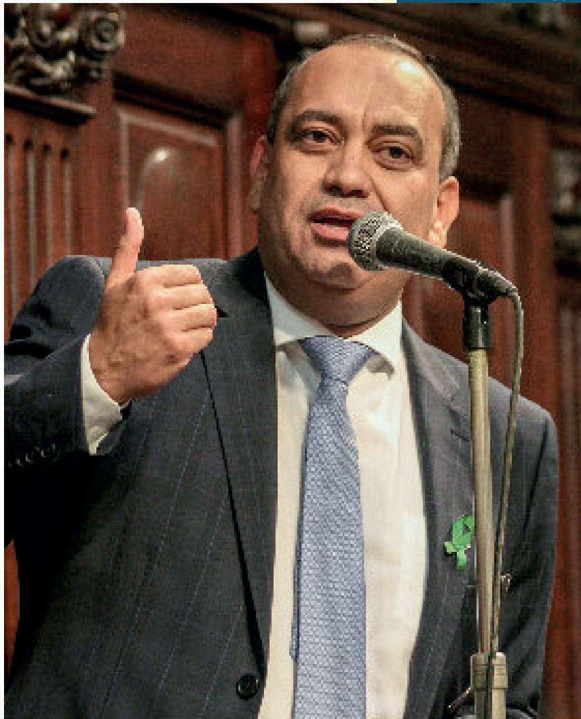
O secretário do Tesouro Nacional, Mansueto Almeida, em imagem de junho

'menina dos olhos' da classe empresarial, atualmente, era a cidade de Queimados. Disse que nos dois governos de Max Lemos quase 50 empresas se instalaram por lá, as vendas comerciais bombaram e centenas de novos empregos surgiram na cidade. Houve contestação e o papo ficou ainda mais quente, quando um intruso motorista deixou o carro abastecendo e se meteu no bate-boca. "Eu estava falindo com minha loja aqui. Fechei, fui pra Queimados e minhas vendas subiram 200%", testemunhou o rapaz. Esse motorista incendiou a conversa falando que Max levou todas as agências bancárias, lojas de departamentos, mercados e um monte de coisas para Queimados e ainda asfaltou mais de 500 ruas, melhorando a mobilidade urbana, facilitando e dando mais velocidade ao entra-e-sai de consumidores da periferia para o centro comercial. E lembrou que ele foi reeleito com mais de 90% dos votos dos eleitores. A essa altura da confusão alguns já falavam dos fracassos de Rogério Lisboa e outros governos, enquanto o motorista desembestava sua falação sobre Max e os avanços em Queimados, quando ele foi prefeito. Um de cabelos grisalhos disse que o deputado Max Lemos não é de Nova Iguaçu. O empresário do início do papo