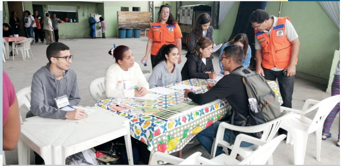
A palestra reuniu mais de 50 profissionais das secretarias de Educação, Saúde, Assistência Social e Esporte e Lazer

Durante a ação, todos os moradores participantes se deslocaram ao Ponto de Apoio, localizado na 1ª Igreja Batista da Posse, na Travessa Antônio, na localidade de