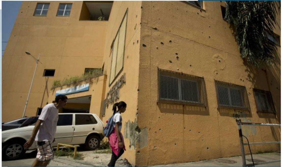
A estação Itararé, na favela Nova Brasília, tem 215 marcas de bala

Na estação do Morro do Adeus, por exemplo, roldanas de metal jazem a céu aberto, abandonadas à sorte da corrosão, assim como carretéis gigantes de cabos de metal. O local frequentemente é ocupado por uma equipe da UPP, que tenta, muitas vezes em vão, evitar depredações. “Policiais militares fazem, na medida do possível, a proteção das estações do teleférico