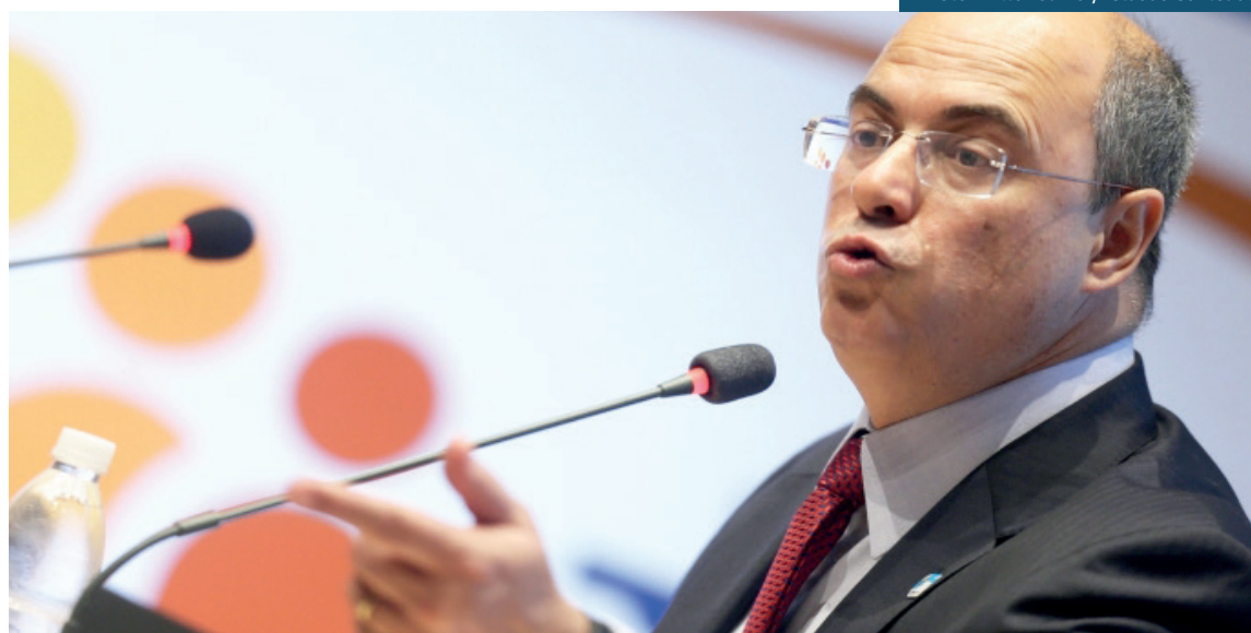
Governador disse ter convidado o ministro Sergio Moro a recorrer com ele à ONU contra os três países

"Se só rivalizam com a milícia, tenho sérias dúvidas do envolvimento de representan-