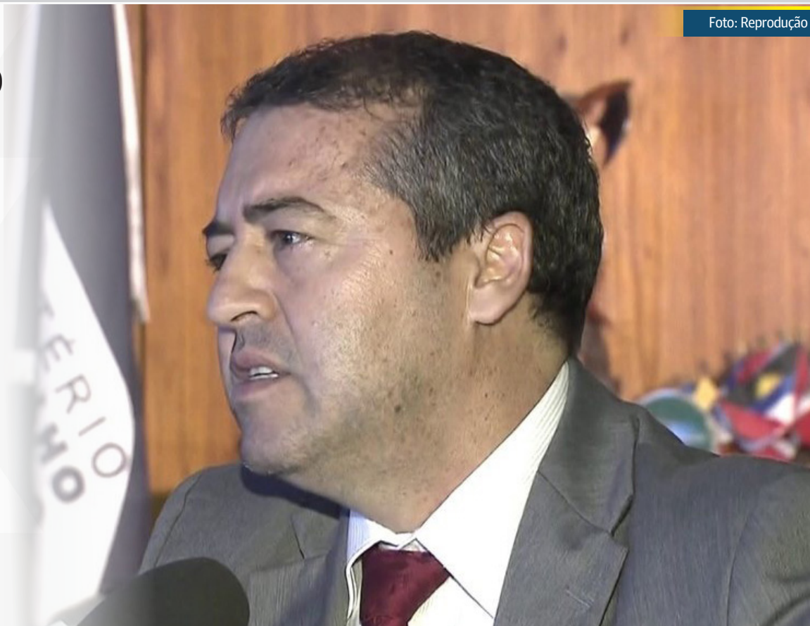
Ex-ministro do Trabalho Ronaldo Nogueira é alvo de operação da PF

Vinculada ao Ministério da Saúde, a Funasa tem entre suas competências a missão