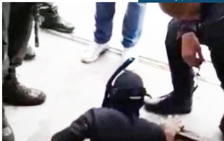
Mergulhador entra em cisterna para procurar arma utilizada no assassinato de Marielle e Anderson