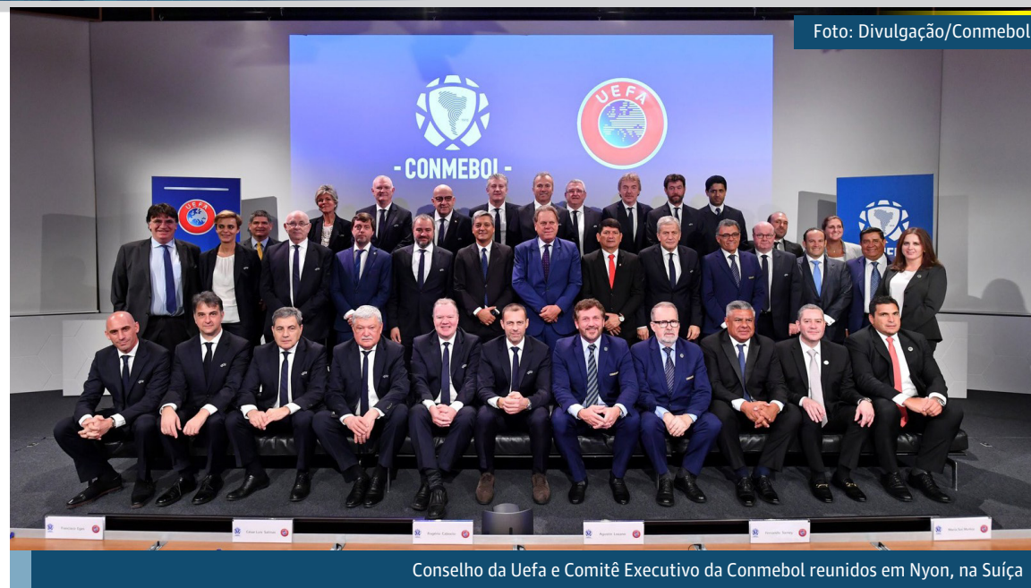
Conselho da Uefa e Comitê Executivo da Conmebol reunidos em Nyon, na Suíça

- Se discutiu a possibilidade de organizar jogos intercontinentais entre Europa e América do Sul, para uma variedade de grupos de idade, e tanto para mulheres como para