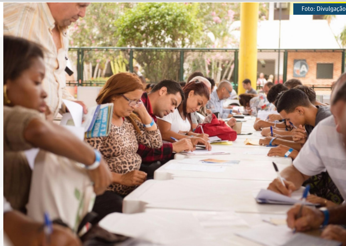
Entre as vagas também há concurso público e feira de emprego

Já a rede de lanchonete Burger King continua com processo seletivo para preenchimento de 300 vagas de emprego no Estado do Rio. Os cargos são para trabalhar como atendente, coordenador e gerente de negócios.