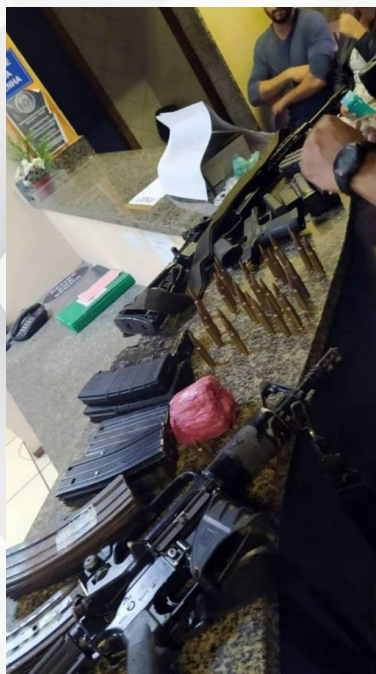
Material apreendido na ação

O material e os presos foram levados para a 21ª DP (Bonsucesso), onde o caso foi registrado.