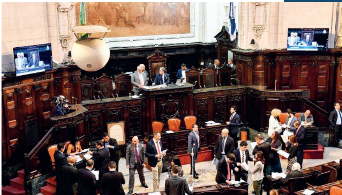
Alerj: o projeto foi apresentado no dia 18

Um projeto de lei enviado nesta quarta-feira (dia 18) à Assembleia Legislativa do Rio de Janeiro (Alerj) prevê o abono de faltas de servidores, funcionários de empresas públicas e terceirizados da administração estadual em decorrência do coronavírus. O texto autoriza ainda o