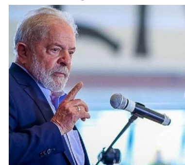
Lula durante pronunciamento na sede do Sindicato dos Metalúrgicos em São Bernardo do Campo, no ABC Paulista

tomar a vacina e já tirar a camisa, ir pro boteco, pedir uma cerveja gelada e ficar conversando, não! Você precisa continuar fazendo o isolamento, e você precisa continuar usando máscara e utilizando álcool em gel."