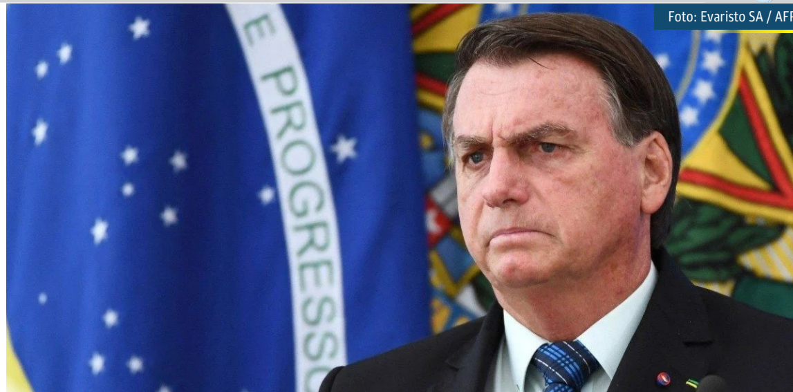
O presidente Jair Bolsonaro sempre envolvido em polêmicas referentes à vacina

Durante a cerimônia, o diretor-presidente da Anvisa, Antonio Barra Torres, agradeceu ao presidente Bolsonaro pela