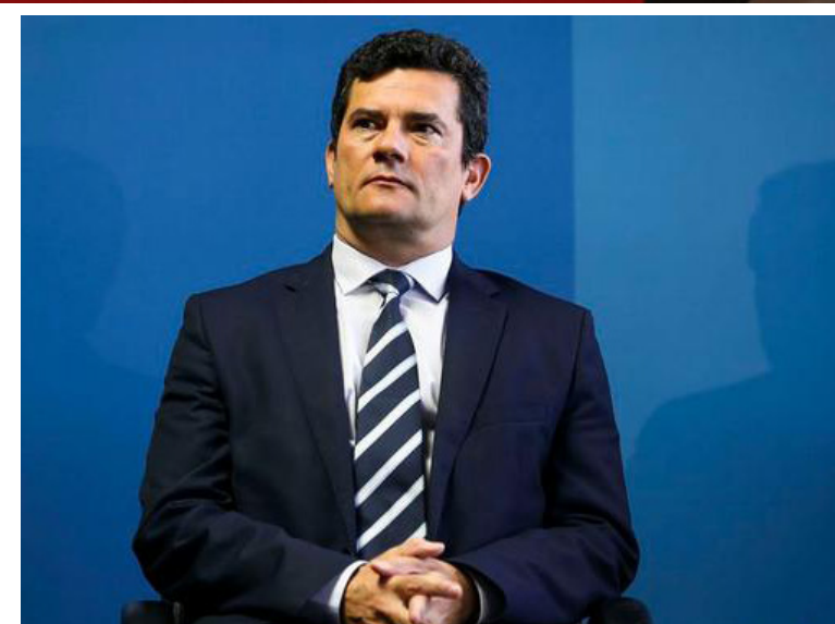
Sergio Moro e o Ministério Público Federal no Paraná afirmaram que não vão comentar o discurso de Lula

Lula chamou o presidente Jair Bolsonaro (sem partido) de "fanfarrão" e criticou a forma como ele está conduzindo o país. afirmou que o Brasil "não tem governo", que a população precisa de emprego e não de armas, e de-