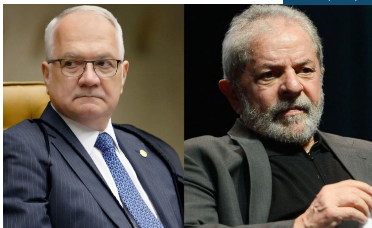
PGR recorre da decisão que anulou condenações do ex-presidente Lula na Lava Jato

O ministro Fachin baseou a decisão no entendimento que o STF teve em outros casos, relativos a