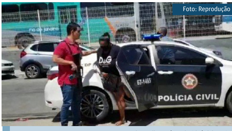
Uma das mulheres é conduzida à delegacia

No ano passado, a 52ª DP iniciou um trabalho de enviar mensagens para pessoas que estivessem utilizando celulares roubados e furtados, informando que o aparelho era produto de crime. O texto informava aos usuários a necessidade de procurar a delegacia em 24 horas com nota fiscal comprovando a aquisição lícita dos celulares. Desde o final de 2020, a 52ª DP já recuperou mais de 40 aparelhos fur-