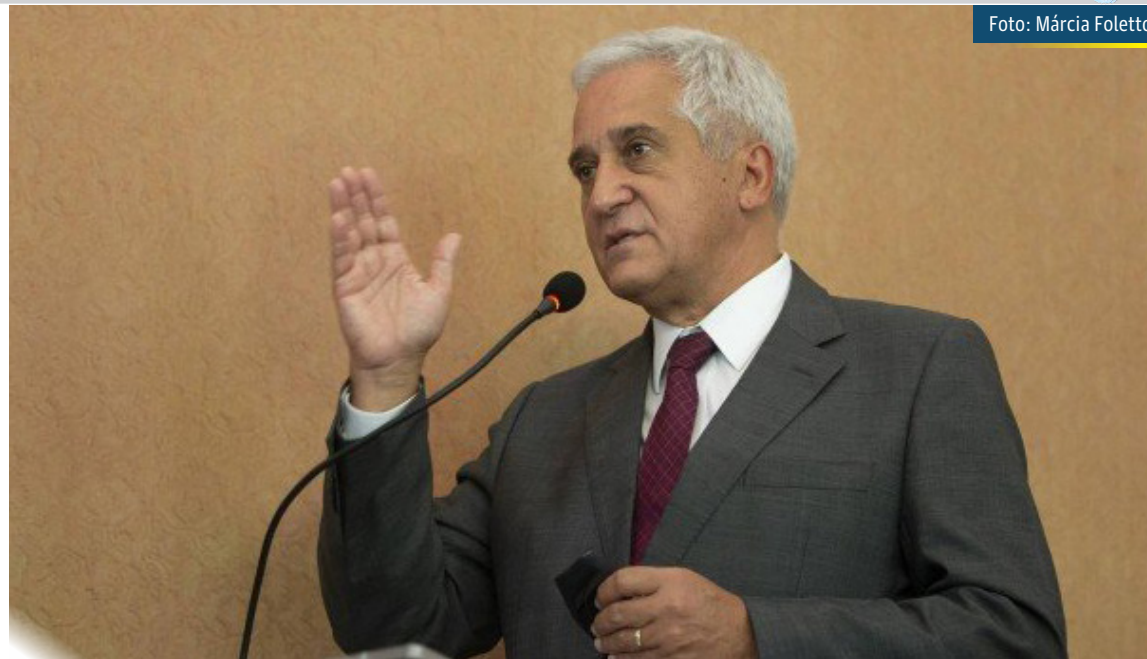
Secretário estadual de Educação, Comte Bittencourt

A suspensão das aulas presenciais chegou a ser anunciada pelo secretário estadual de Educação, Comte Bittencourt. Segundo ele, a Região Metropolitana I, que corresponde à capital do estado, foi classificada nesta sexta-feira com a cor vermelha no sistema de bandeiras de risco para o Covid-19. Pelas regras da resolução conjunta