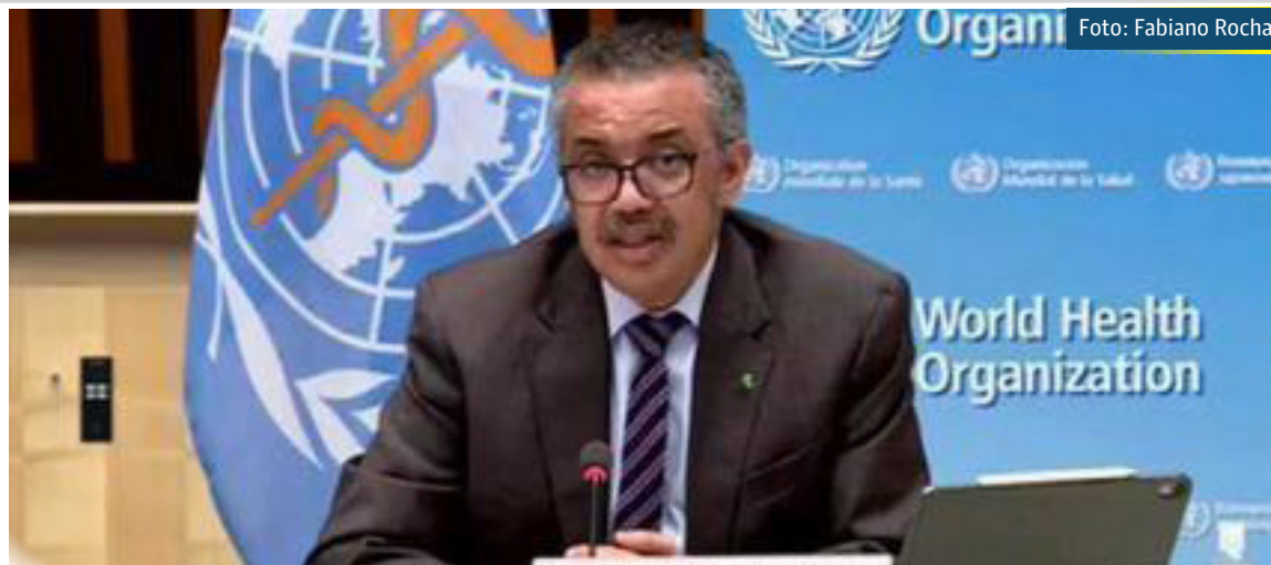
OMS alerta: Brasil precisa levar o aumento de casos de Covid muito a sério

Michael Ryan, destacou que, desde o último alerta da OMS ao Brasil, feito no dia 5, os casos e as mortes por Covid-19 subiram ainda mais.