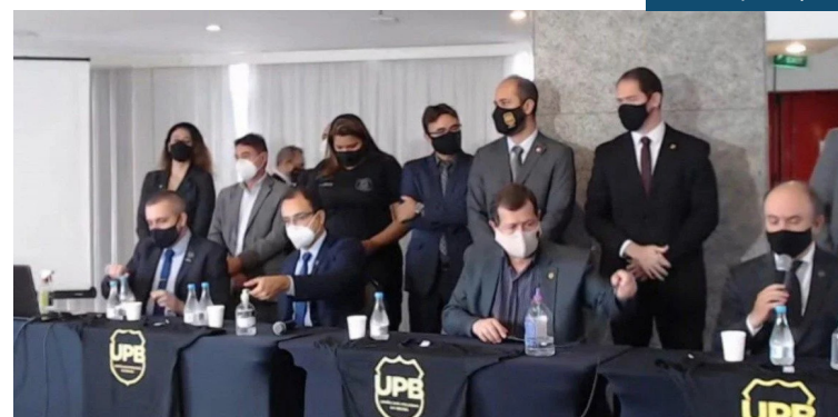
União dos Policiais do Brasil fez pronunciamento contra PEC Emergencial