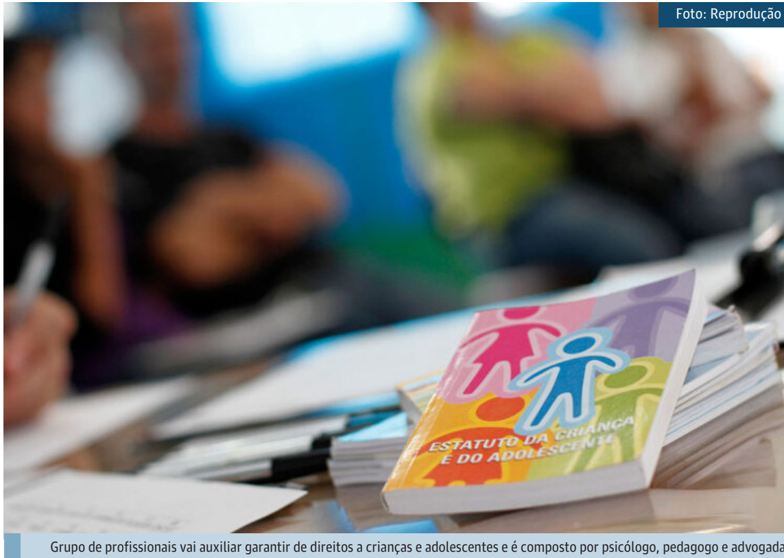
Grupo de profissionais vai auxiliar garantir de direitos a crianças e adolescentes e é composto por psicólogo, pedagogo e advogada

O Conselho Tutelar de Japeri vai ganhar um reforço de peso na proteção dos direitos de crianças e adolescentes. Em reunião realizada nesta quinta-feira (11), a Prefeitura, por meio da Secretaria Municipal de Assistência Social, Trabalho e Direitos Humanos, disponibilizou uma equipe técnica de apoio ao