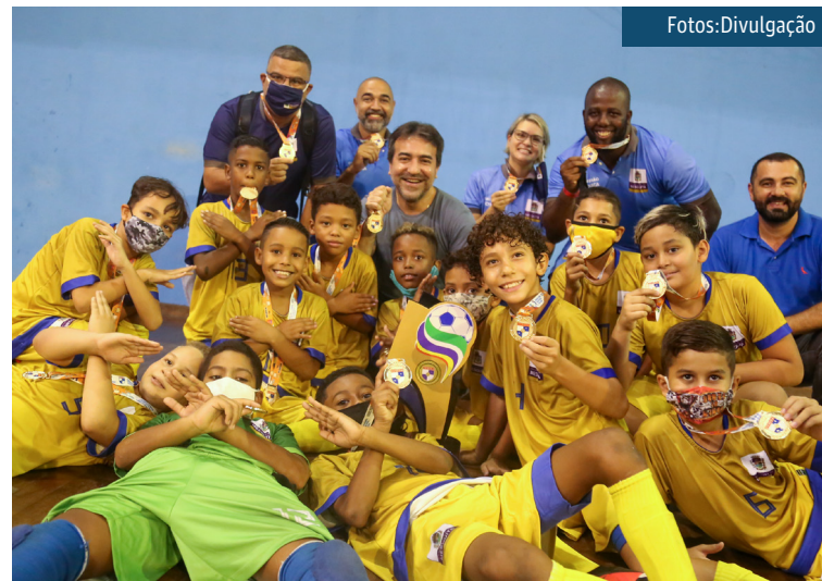
Com o placar de 5 X 2, a equipe sub-09 de futsal venceu o Olaria Atlético Clube

Mesquita leva o esporte a sério. Veja isso em momentos como o deste sábado, 13 de março, em que o time sub-09 de Futsal levou a taça do Campeonato Carioca de Futebol de Salão 2020. A competição aconteceu no Centro Esportivo Miécimo da Silva, em Campo Grande, sem torcida. Uma iniciativa criada para evitar aglomerações durante o evento, o time deu orgulho ao povo mesquitense.