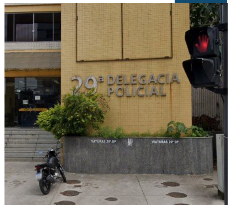
Guarda municipal foi agredido durante fiscalização em Campinho