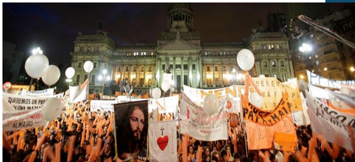
Imagem de 2016 mostra grupos católicos contra o casamento gay em frente ao prédio do Congresso, em Buenos Aires

O Vaticano afirmou, nesta segunda-feira (15) que padres e outras autoridades da Igreja Católica não podem abençoar uniões entre pessoas do mesmo sexo e que, se isso acontecer, elas não seriam oficiais.