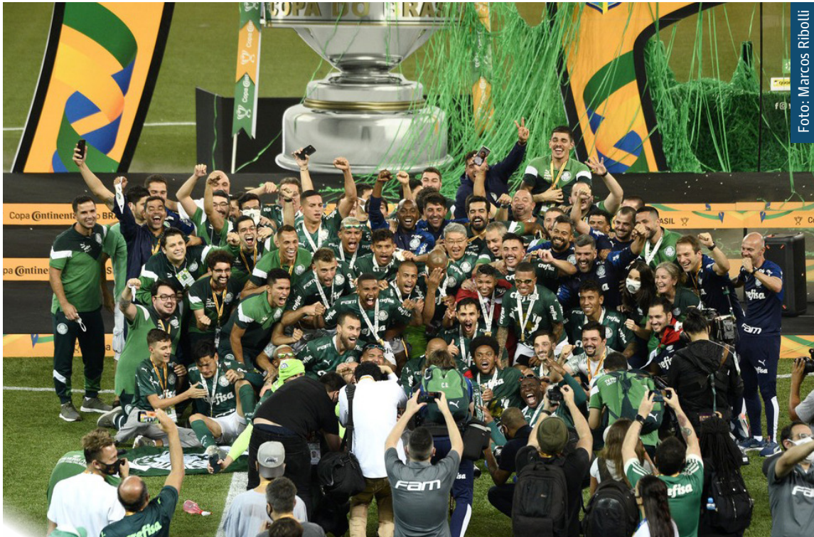
Palmeiras campeão da Copa do Brasil 2020, Paulistão e Libertadores

N ão foi a sorte que levou o Palmeiras a fazer uma temporada histórica em 2020. O título da Copa do Brasil, confirmado no último domingo, fez o Verdão encerrar o seu ano esportivo com três conquistas expressivas, algo que não ocorria no clube desde 1993, e também deixou o seu torcedor em estado de alegria. É verdade que o projeto palmeirense começou de um jeito e precisou buscar uma nova rota no meio do caminho. Mas a ideia de dar espaço aos garotos formados pela base se manteve presente do início ao fim e fez a diferença. O início com Vanderlei Luxemburgo foi importante por dar respaldo aos garotos e iniciar um trabalho sem as mesmas contratações dos anos anteriores. Deu resultado com o Paulistão. A evolução técnica da equipe, porém, veio somente após a chegada de Abel Ferreira,