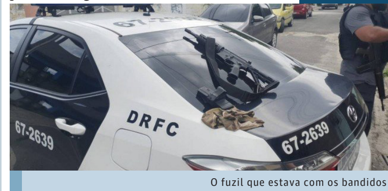
O fuzil que estava com os bandidos