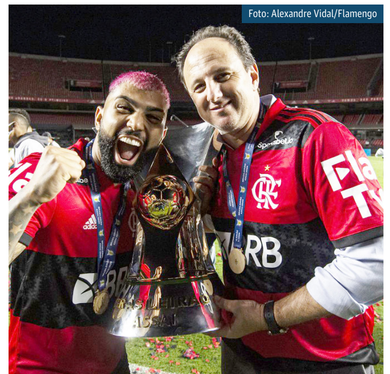
Gabigol comemora título do Brasileirão com Rogério Ceni

O elenco principal rubro-negro está de folga e se reapresenta no dia 15 de março para iniciar a preparação para a temporada.