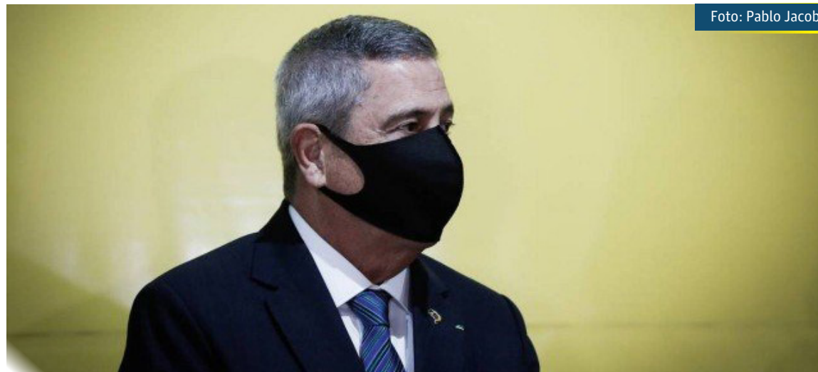
O ministro da Defesa, Walter Braga Netto, em visita a posto de vacinação em Brasília