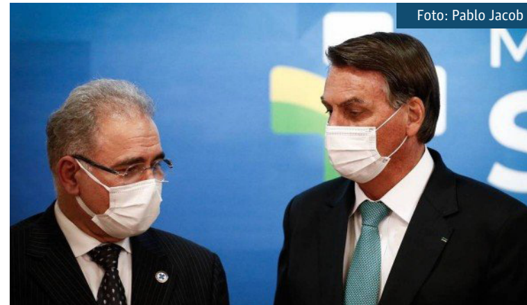
O ministro da Saúde, Marcelo Queiroga, e o presidente Jair Bolsonaro