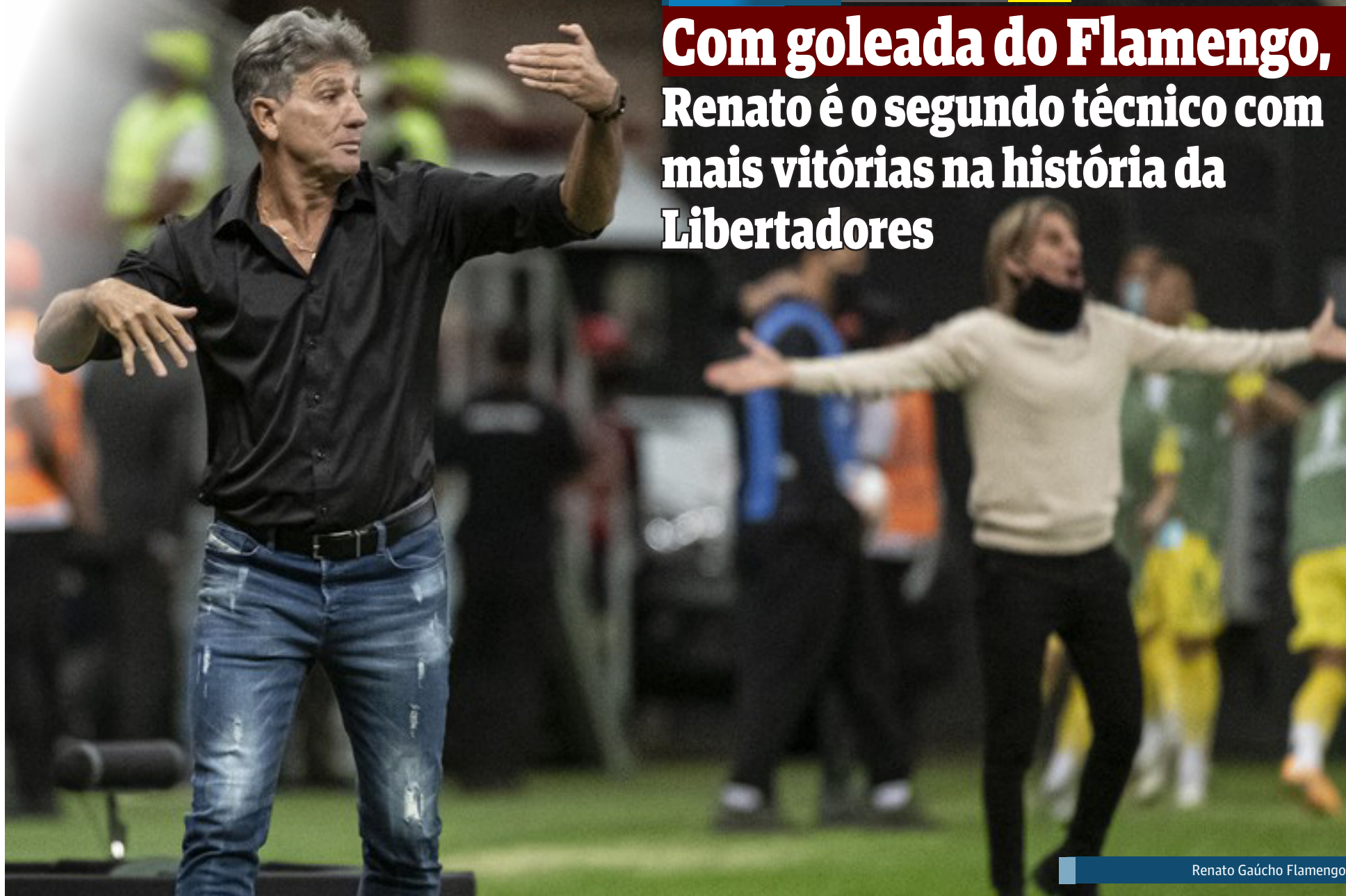
Renato Gaúcho Flamengo