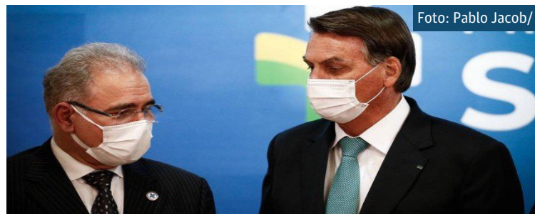
O ministro da Saúde, Marcelo Queiroga, e o presidente Jair Bolsonaro

— Muitas acusações feitas contra governo não têm embasamento legal ou qualquer fundamento. Erros formais estão sendo taxados como suspeita de prática crimino-