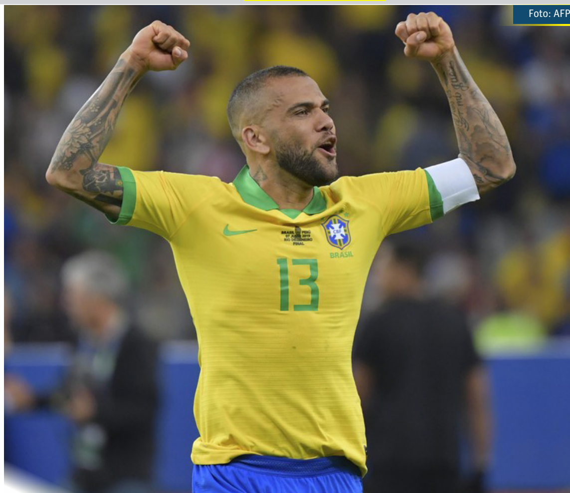
Daniel Alves quer disputar mais uma Copa do Mundo

- Estou muito orgulhoso de mim mesmo. Eu penso sobre