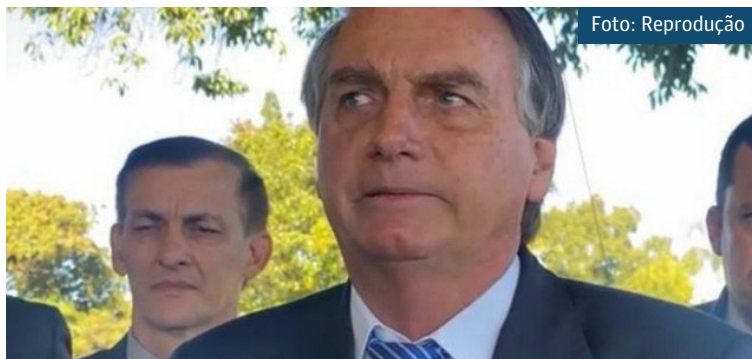
O presidente Jair Bolsonaro fala sobre fraude nas urnas em conversa com apoiadores

A portaria cita várias declarações proferidas por Bolsonaro em evento oficial, em entrevista à imprensa e em lives ao longo do