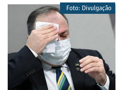
O ex-ministro da Saúde Eduardo Pazuello

Esta é a segunda ação por improbidade administrativa enfrentada por Pazuello. Ele também é processo pelo MPF no Amazonas por conta de sua atuação na crise do sistema de saúde do estado no início do ano.