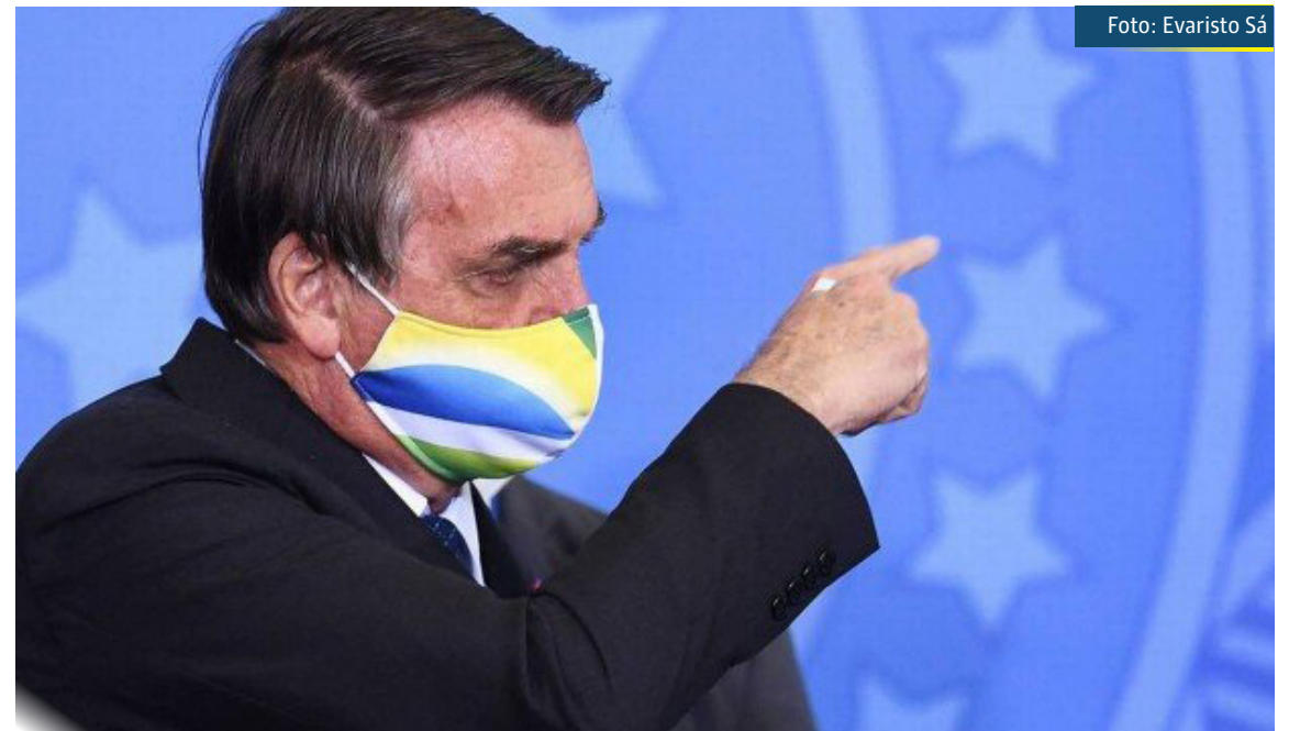
O presidente Jair Bolsonaro

A ministra considerou que não há justificativa jurídica para o pedido do Ministério Público de aguardar a finalização da CPI, que pode ter os trabalhos