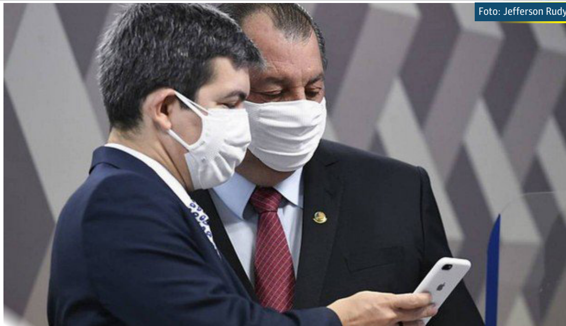
O vice-presidente da CPI da Covid, Randolfe Rodrigues, conversa com o presidente da comissão, Omar Oziz

À senadora Eliziane Gama (Cidadania-MA), ele afirmou não saber se a peça publicitária havia sido elaborada pela Secom, porque estava internado com Covid-19. Ainda, em live com o deputado Eduardo Bolsonaro (PSL-SP) em 12