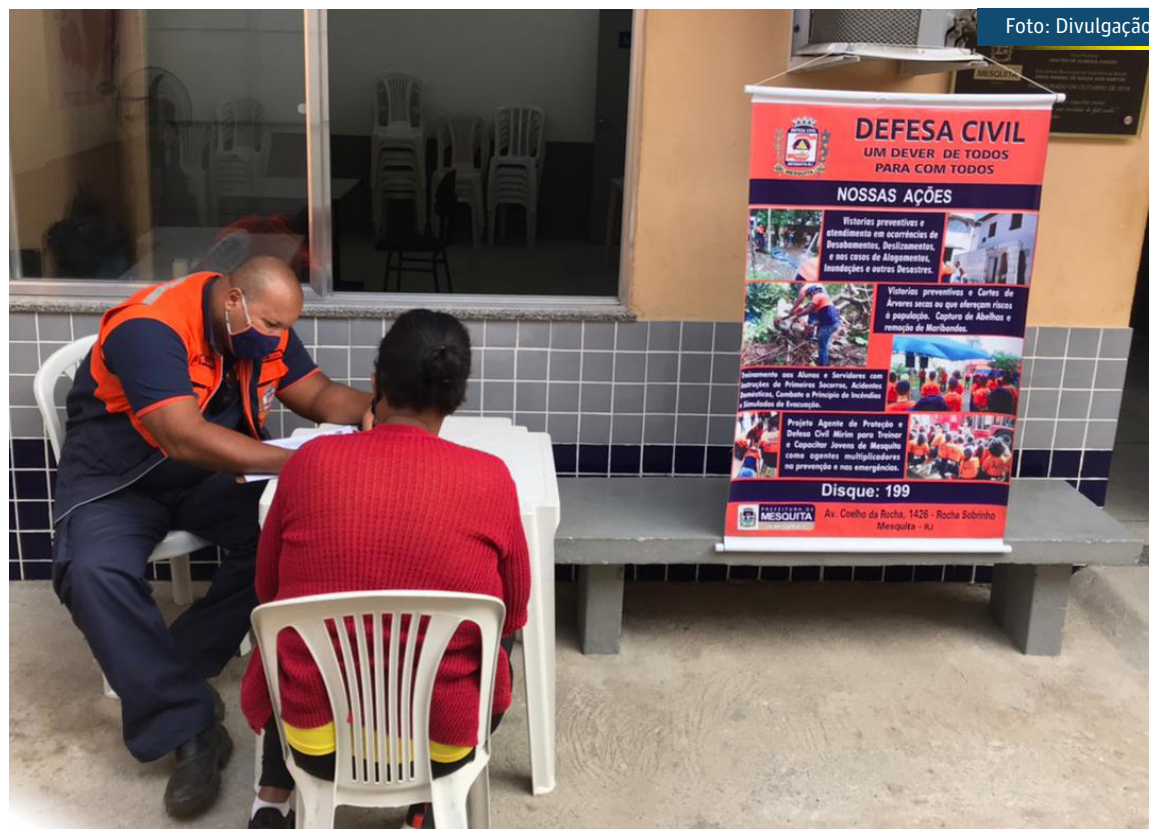
As primeiras ações resultantes da parceria já aconteceram, na última segunda-feira e quarta-feira, dias 5 e 7, nos CRAS Banco de Areia e Chatuba

CRAS Banco de Areia - Rua Bicuiba 48. Dias 19/07, 02/08, 16/08 e 30/08. Das 9h às 11h30. CRAS Chatuba - Rua