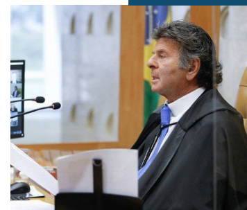
Luiz Fux preside sessão no STF