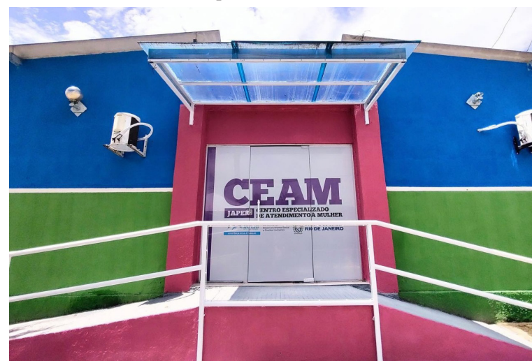
Prefeita de Japeri Fernanda Ontiveros

assumir o mandato priorizou a implantação na cidade de um Centro Especializado de Atendimento a Mulher e o acerto de sua decisão pode ser constatada nas estatísticas mensais de atendimento de mulheres vítimas de violência Justamente em razão disso que assumir o mandato priorizou a abertura na cidade de um Centro Especializado de Atendimento a Mulher - CEAM