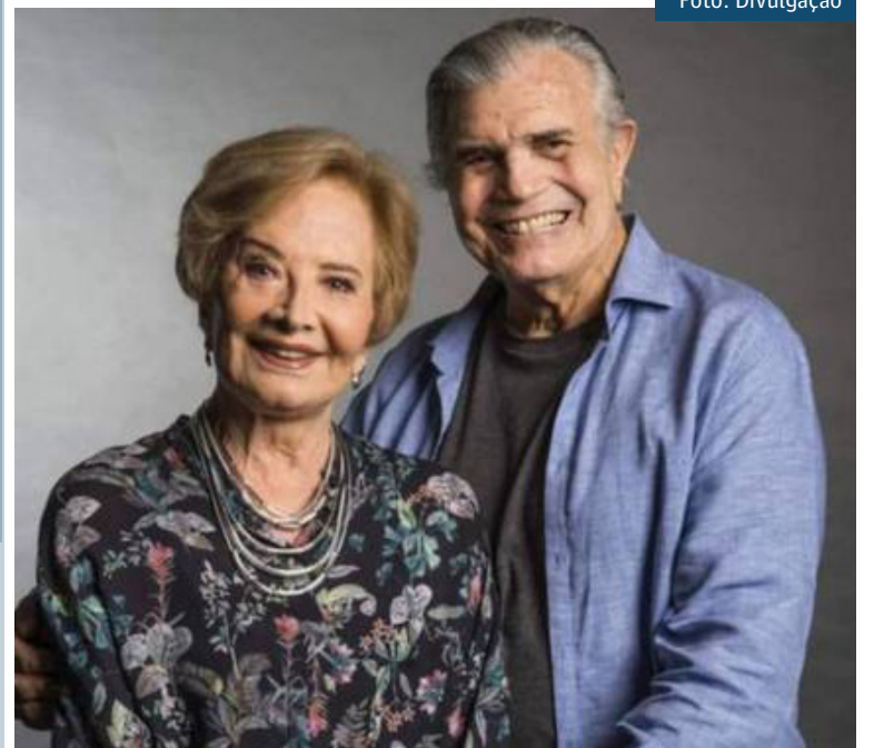
Tarcísio Meira e Glória Menezes estão internados com Covid-19 em São Paulo