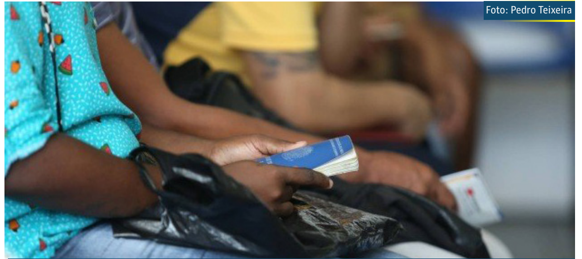
Jovens de baixa renda que fizerem o curso terão certificado de conclusão e serão encaminhados ao mercado de trabalho

Ao final, os alunos que concluírem estarão aptos para participarem de processos seletivos com mais segurança para vagas de posições de início de