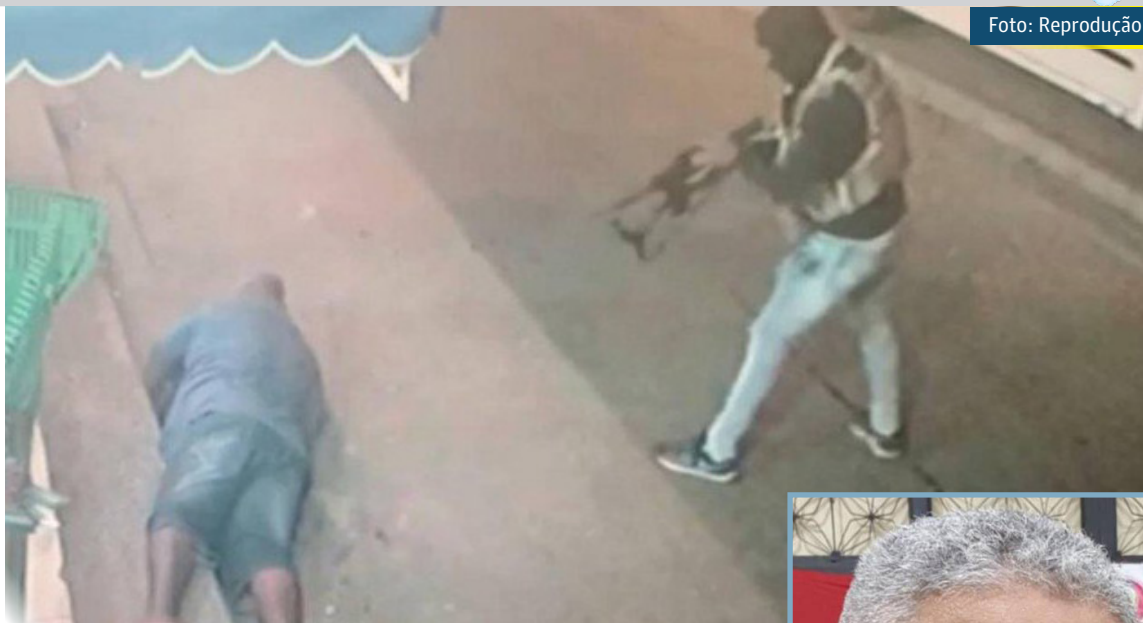
Acusado de ligação com a milícia é executado

Aos policiais, a vítima informou que é funcionária de um estabelecimento comercial na Rua Brandão Monteiro. Ele relatou que foi atingido enquanto estava trabalhando, no momento em que um automóvel passou pela via com homens armados que atiraram contra um homem que se encontrava em frente ao seu local de trabalho. A ocorrência foi registrada na Delegacia de Homicídios.