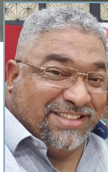
Acusado tinha sido condenado após prisão em 2008

A milícia Liga da Justiça atuava nos bairros de Campo Grande, Gua-