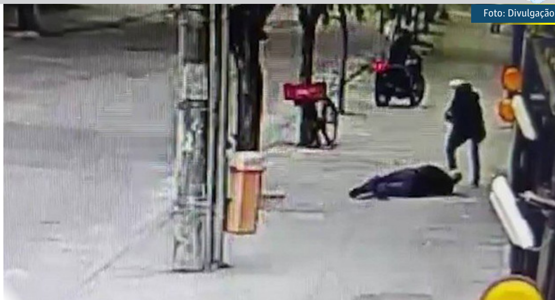
Homem morre após ser baleado quando passeava com cão em Jacarepaguá

"A Delegacia de Homicídios da Capital (DHC) foi acionada e realizou perícia no local. Imagens de câmeras de segurança que registraram a ação foram coletadas e testemunhas foram ouvidas. Agentes realizam diligências para identificar a autoria do crime."