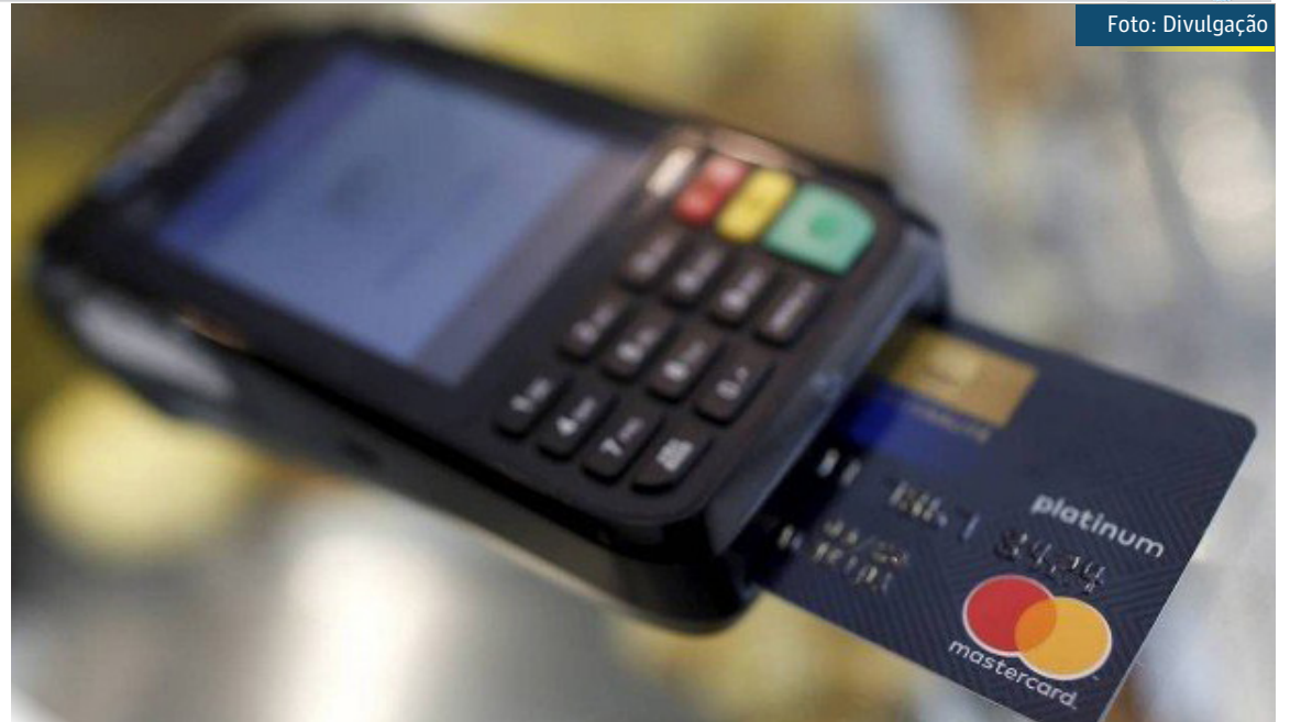
O consumidor entrou na Justiça alegando ter caído no golpe ao fazer uma compra com um vendedor ambulante

A decisão de primeiro grau julgou a ação improcedente, mas o Tribunal de Justiça de São Paulo acolheu o recurso do cliente. O relator, desembargador Thiago de Siqueira, considerou que havia verossimilhança nas alegações do autor do processo, que conseguiu comprovar, com histórico de faturas, que as transações no valor total de R$ R$ 9,4 mil fugiam do padrão. Além disso, o magistrado entendeu que o fato de os golpistas terem tido sucesso no uso do cartão significa que o sistema de proteção do banco