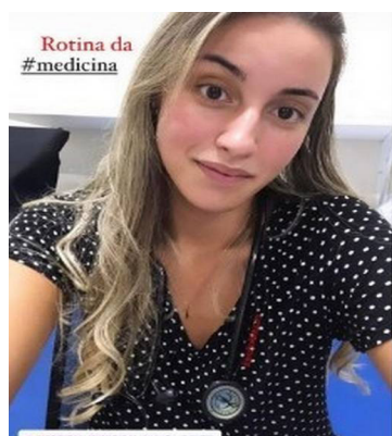
Rotina da #medicina