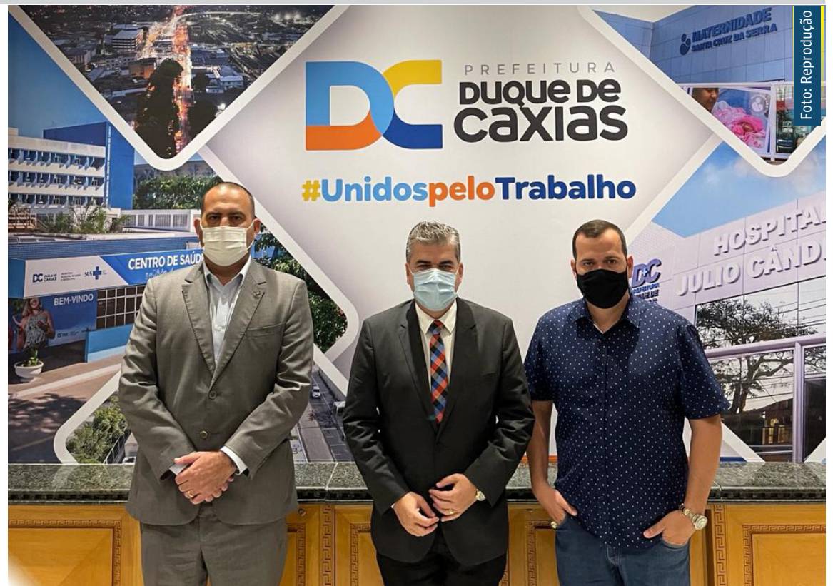
Para o prefeito Washington Reis, que preside o CISPBAF, os investimentos vão possibilitar o desenvolvimento de novas tecnologias e serviços de inteligência

“O consórcio já está formado e eu tenho a honra de presidi-lo e poder contar com as parcerias do Governo do Estado e do Governo Federal neste projeto pioneiro. O Centro Integrado de Comando e Controle será o cérebro de fornecimento de ima-