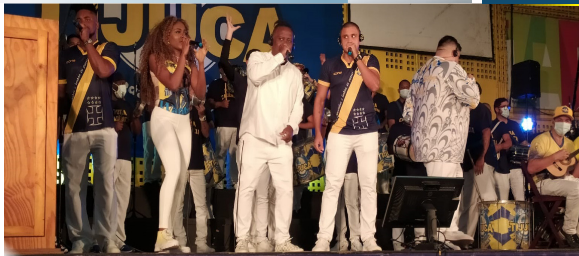
Apresentado por Marquinhos de Oswaldo Cruz e realizado pela FUNARJ

Vem reunindo, desde sua criação, milhares de pessoas, com o objetivo de prestar homenagem às influências africanas na região, tanto na música quanto na gastronomia, e às Tias de Madureira, verdadeiras Yabás, que acolhem e alimentam a população local. Ao mesmo tempo em que