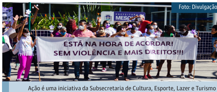
Ação é uma iniciativa da Subsecretaria de Cultura, Esporte, Lazer e Turismo

A ação organizada pelo CRAS Santa Terezinha e Espaço Convive começou às 9h30 e teve a participação do CEAM e do Espaço da Mulher Mesquitense. “Sem vocês, usuários do espaço, não teríamos como promover ações como esta. Por isso, é muito importante a participação de vocês para que cada vez mais possa-