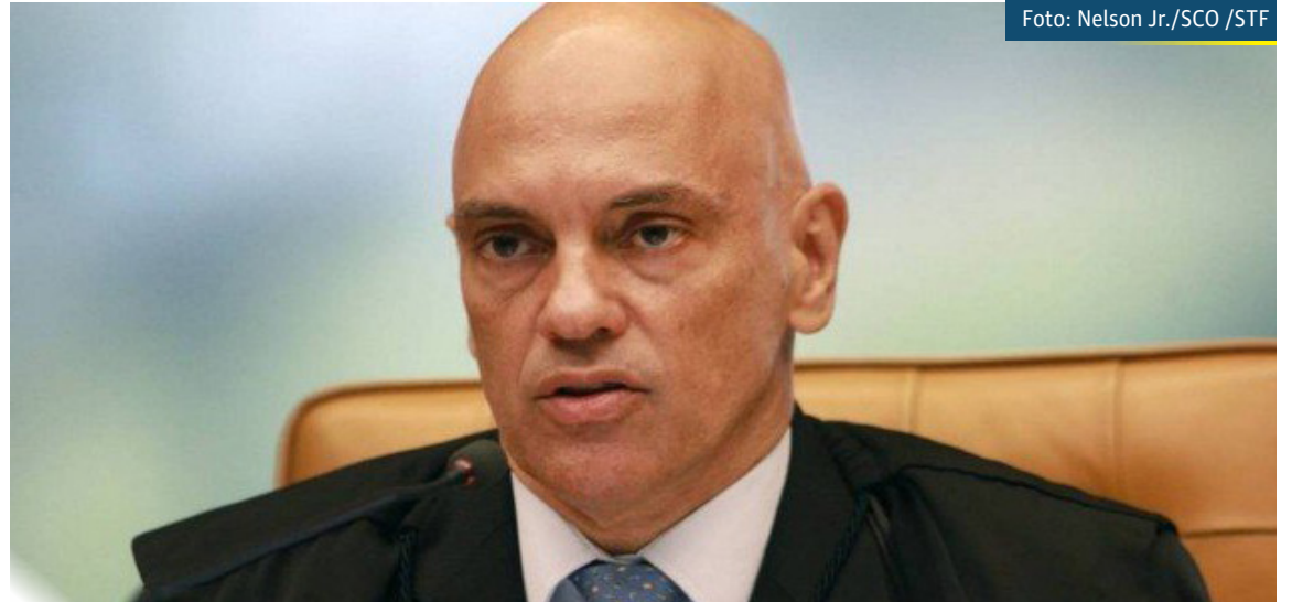
Ministro Alexandre de Moraes

Segundo o ministro, as manifestações "criminosas e antidemocráticas" estão sendo programadas para a proximidade do feriado de 7 de Setembro, e os investigados estariam se valendo de publicações em redes sociais "para instigar os seus seguidores, e tentar coagir a população brasileira em geral, a atentar contra o Estado Democrático de Direito brasileiro e suas Instituições republicanas, inclusi-