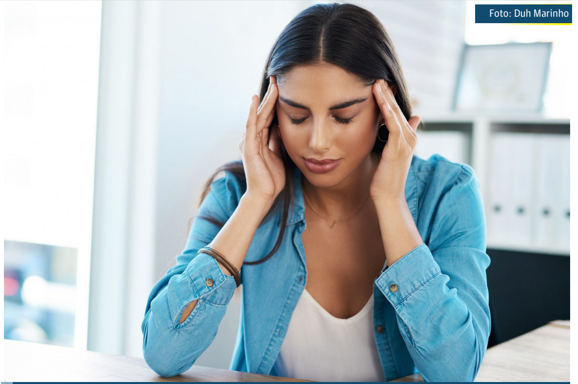
A cefaleia tensional que é o tipo mais frequente de dor de cabeça, normalmente afeta a cabeça inteira, com uma sensação de pressão ou aperto

Ainda de acordo com o Neurocirurgião, a melhor maneira de controlar a dor é o tratamento