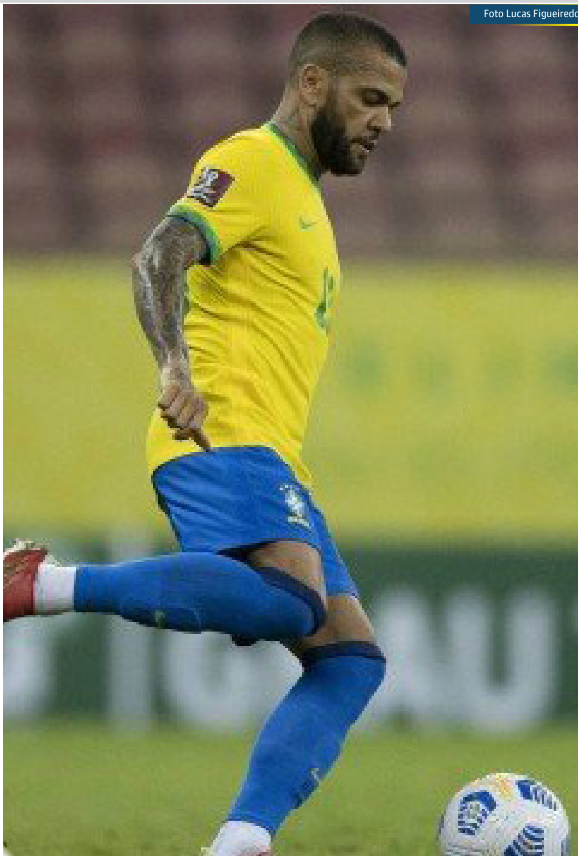
Daniel Alve em jogo do Brasil contra o Peru