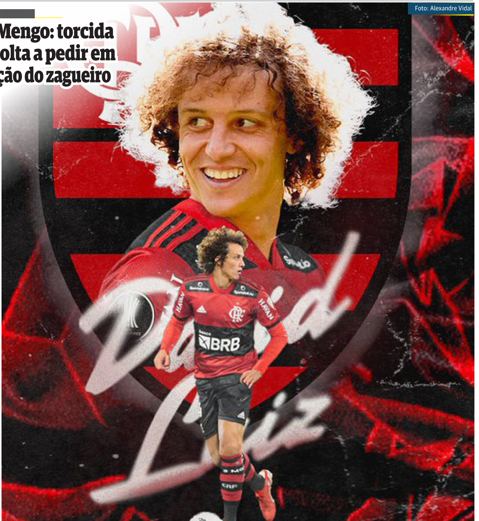
Enquanto isso, David Luiz mantém a forma em Juiz de Fora, Minas Gerais, onde mora sua família. Ele sabe do desejo rubro-negro de contar com seu futebol.