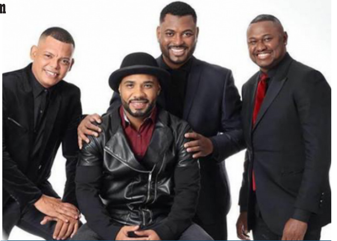
João Loroza acaba de disponibilizar em seu canal oficial no YouTube, o videoclipe, "31 de Agosto".