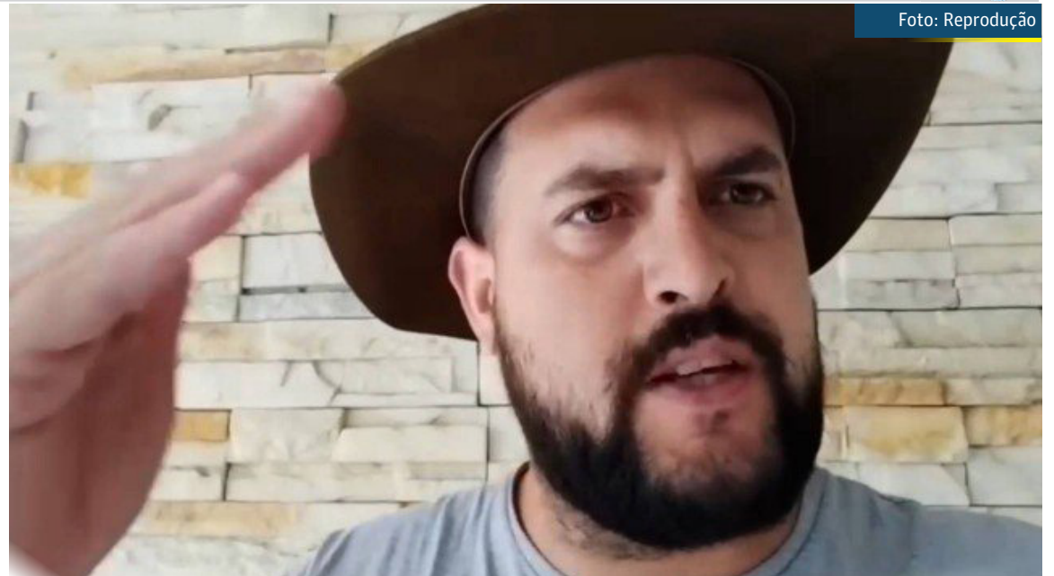
Zé Trovão diz estar foragido no México: 'Vou ser preso a qualquer momento'

Mesmo foragido, Zé Trovão continuou gravando vídeos e incitando os atos do dia 7 de setembro. Nos últimos dias, ele pediu aos caminhoneiros que fechassem as rodovias, o que tem ocorrido desde ontem.