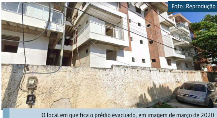
O local em que fica o prédio evacuado, em imagem de março de 2020

A Defesa Civil municipal visitou o imóvel e informou que, conforme o constatado pelos técnicos, "houve o rompimento de um dos 24 pilares da construção". O órgão afirmou ainda que se trata de um edifício erguido há aproximadamente seis anos, com quatro pavimentos construídos sobre pilotis.