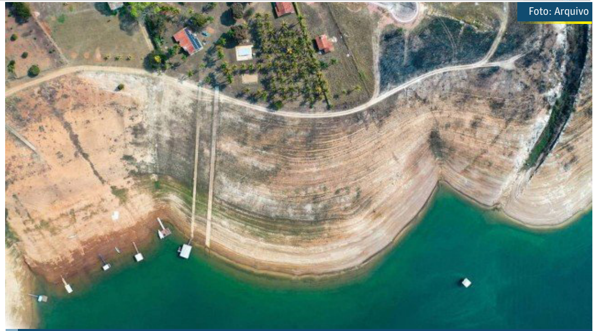
O lago da Hidrelétrica de Furnas, em Minas Gerais, que tem menos de 18% de sua capacidade

tro da Economia, Paulo Guedes, mencionou a necessidade de encher os reservatórios das hidrelétricas.