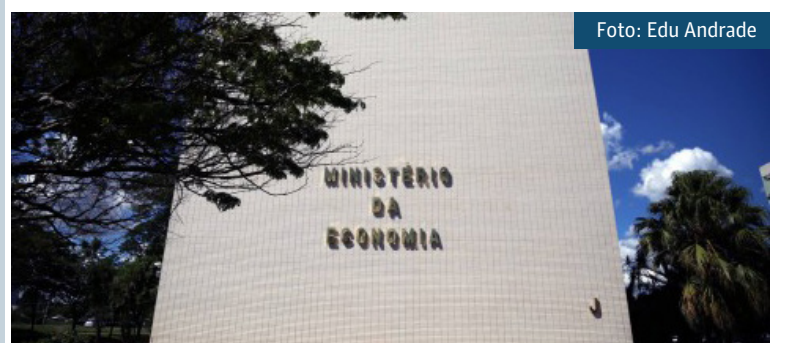
O Ministério da Economia tem seis meses para divulgar o edital do processo

Além disso, os profissionais vão trabalhar nos processos de compensação entre os regimes de Previdência e nas atividades de natureza administrativa do Departamento de Centralização de Inativos, Pensionistas e Órgãos Extintos (Decipex), do Ministério da Economia.