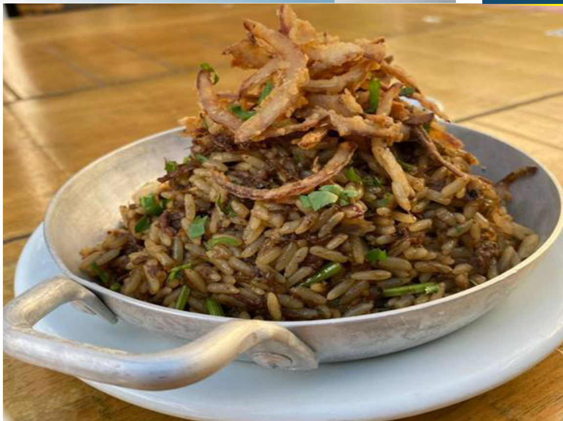
O público poderá degustar sugestões variadas de pratos deliciosos

Acompanhamentos: Arroz branco, torresmo sequinho, couve