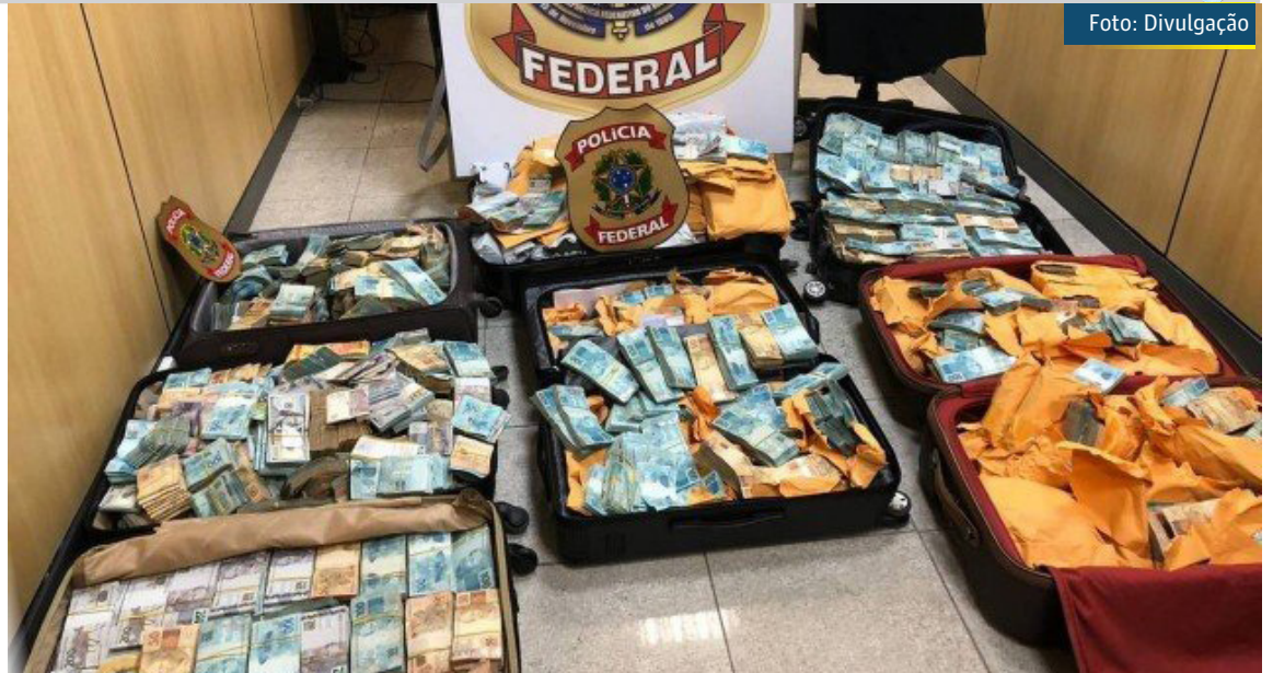
Dinheiro encontrado na casa de Gldison Acácio dos Santos, dono da GAS Consultoria Bitcoin

Os policiais também apreenderam carteiras físicas para criptomoedas. Elas são como pendrives nos quais ficam salvos os criptoativos. Nesse formato, a PF encontrou 591 bitcoins. De acordo com o CoinMarketCap, um bitcoin ontem valia cerca de R$ 255 mil.