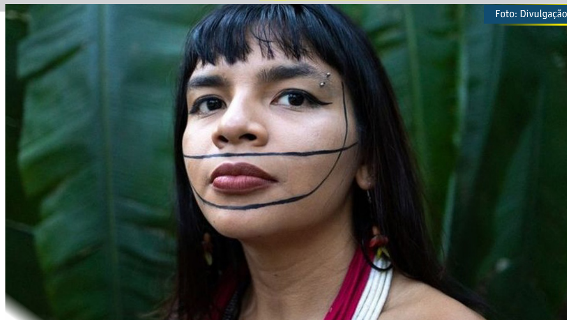
Txai Suruí fez um discurso na abertura da COP26 na semana passada, em Glasgow, na Escócia

"Estão reclamando que eu não fui para Glasgow. Levaram uma índia para lá, para substituir o [cacique] Raoni, para atacar o Brasil. Alguém viu algum alemão atacando