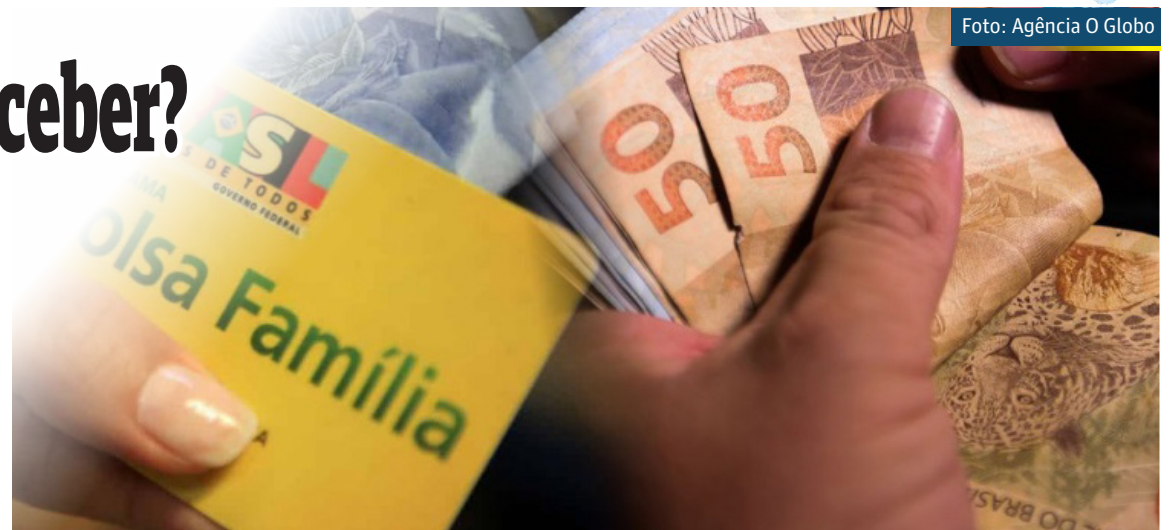
O presidente Jair Bolsonaro editou nesta segunda-feira (8) decreto que regulamenta o Auxílio Brasil

Segundo o Ministério da Cidadania, as famílias em situação de pobreza apenas poderão receber