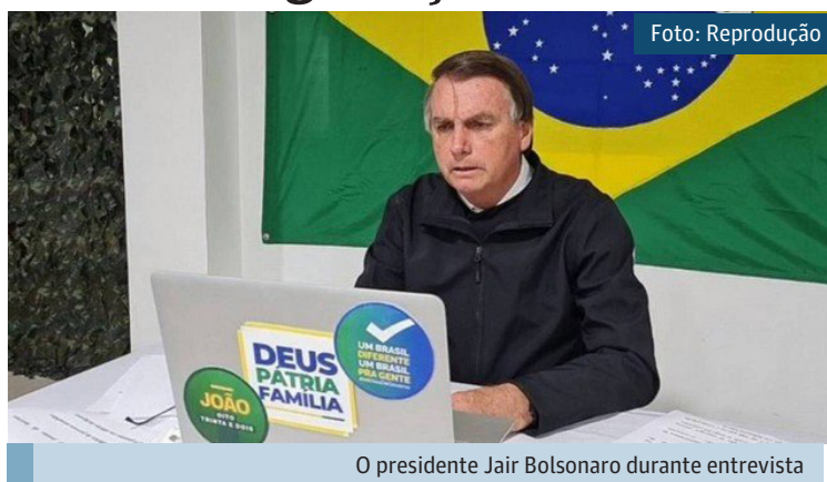
O presidente Jair Bolsonaro durante entrevista

No Twitter, Bolsonaro vem apresentando queda constante de interações em suas publicações desde agosto. Em dois meses suas interações na plataforma caíram aproxima-