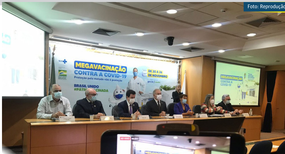
Ministério da Saúde anuncia redução do intervalo da dose de reforço

Para a dose de reforço, o Ministério da Saúde orienta que a pessoa tome um imunizante diferente do usado no esquema vacinal. "É preferencial que a dose adicional seja com uma vacina diferente. No Brasil usamos a Pfizer, mas em um eventual desabastecimento pode ser usada outra plataforma", explicou Queiroga.