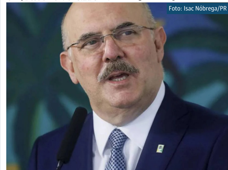
Ministro da Educação, Milton Ribeiro

O vice-presidente, Hamilton Mourão, afirmou também nesta terça-feira (16), que não existiu interferência na prova. Ele disse que as questões são feitas de acordo com a metodologia do Inep.