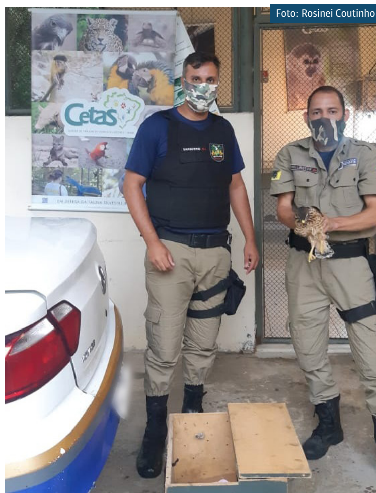
Depois de ser acolhida, ave foi levada ao Centro de Tratamento de Animais Silvestres, em Seropédica

Como todos os animais feridos resgatados, o filhote de gavião foi encaminhado ao Centro de Tratamento de Animais Silvestres, o CETAS, que fica em Seropédica. No local, ele receberá os tratamentos pertinentes para, então, ser devolvido ao seu habitat comum.