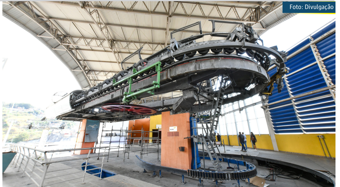
Responsável pela implantação do sistema mecânico do equipamento, a empresa Poma apresentará cronograma de obras em dezembro

Já as obras civis para recuperação das seis estações do sistema, que incluem instalações hidráulicas e sanitárias, ar-con-