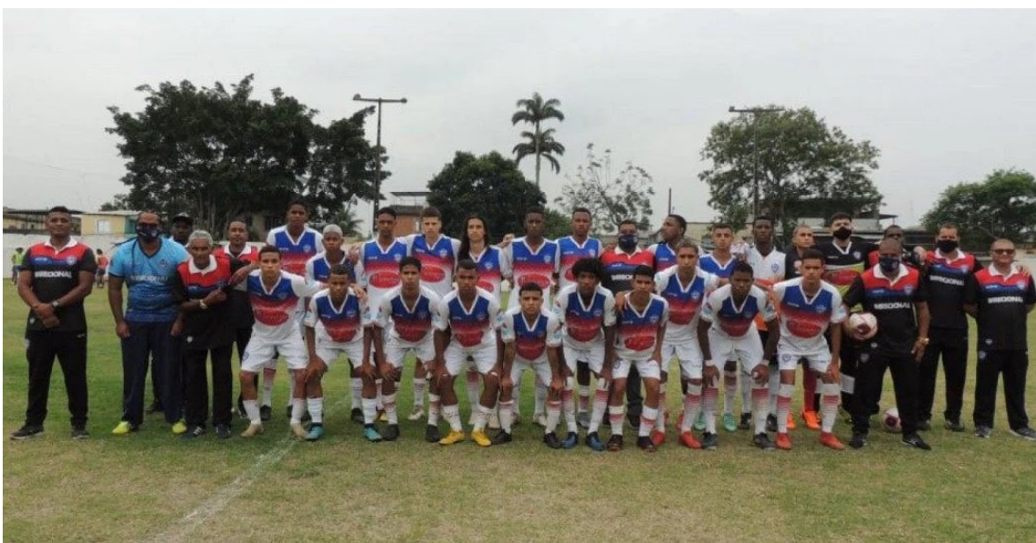
Os jovens do SE Belford Roxo estão na terceira colocação do Estadual

O jogador poderia ser opção nos jogos que perderia se estivesse com o Uruguai. Se fosse convocado, o uruguaio não atuaria contra Bahia, dia 11, e São Paulo, no dia 14. Estaria livre