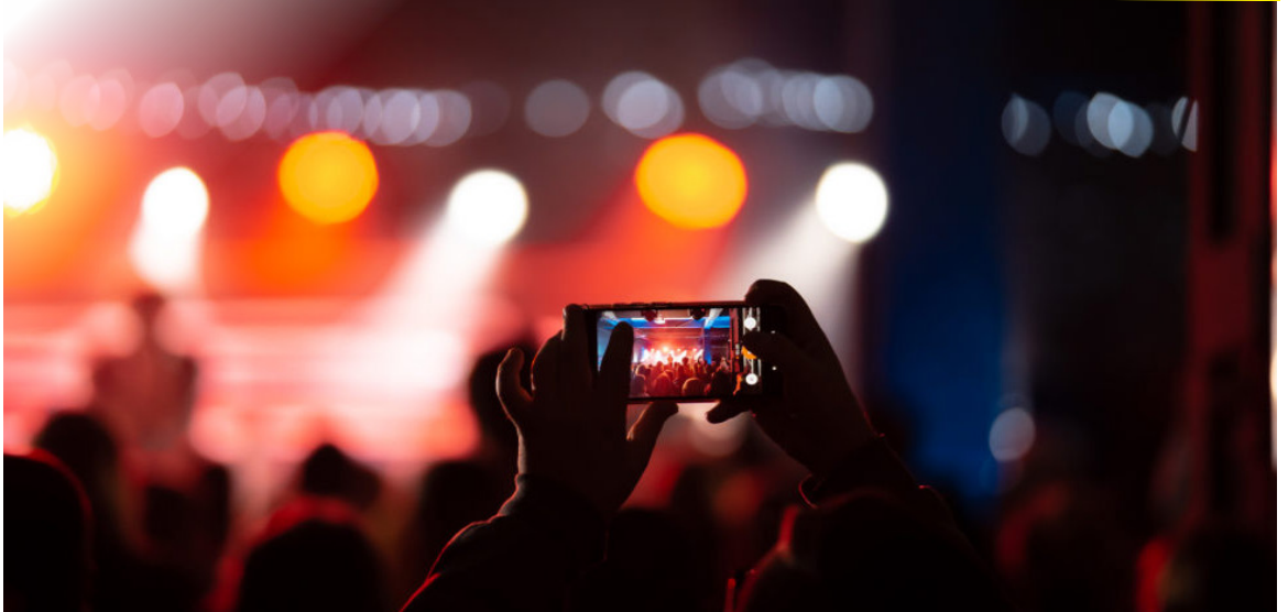
Retomada Cultural RJ 2 vai premiar 800 projetos em todas as regiões do estado do Rio

Já a Categoria B será voltada para projetos relacionados ao Bicentenário da Independência do Brasil. Os projetos aceitos serão