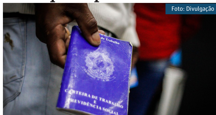
Pessoa segura carteira de trabalho em mutirão de emprego em São Paulo

Em nota, o ministério informou que a diferença no saldo de empregos criados em 2020