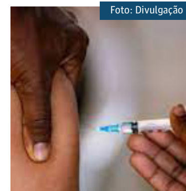
A taxa de letalidade da covid-19 no Rio está em 5,17%

Apesar da queda no número de mortes, a taxa de letalidade da covid-19 no Rio está em 5,17%, a maior do país. Ainda de acordo com o painel de dados desenvolvido pela pasta, a taxa de ocupação de Unidades de Terapia Intensiva (UTI) para a covid-19 no estado é de 31,5%. Já a taxa de ocupação nos leitos de enfermagem é de 17,5%.