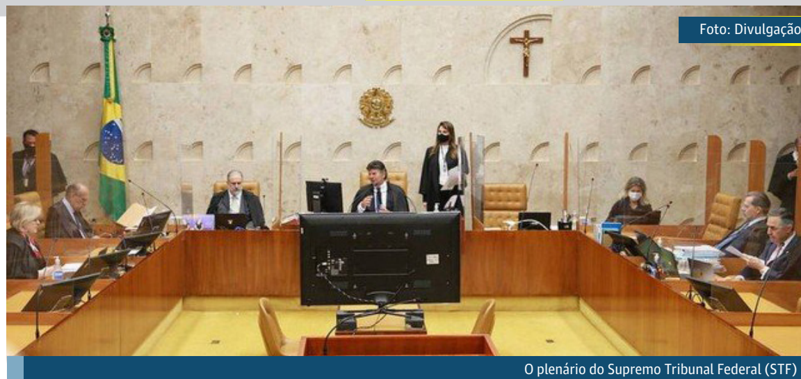
O plenário do Supremo Tribunal Federal (STF)

– Temos de acompanhar a ciência, então estabelecemos estas condicionantes para voltar. Nada