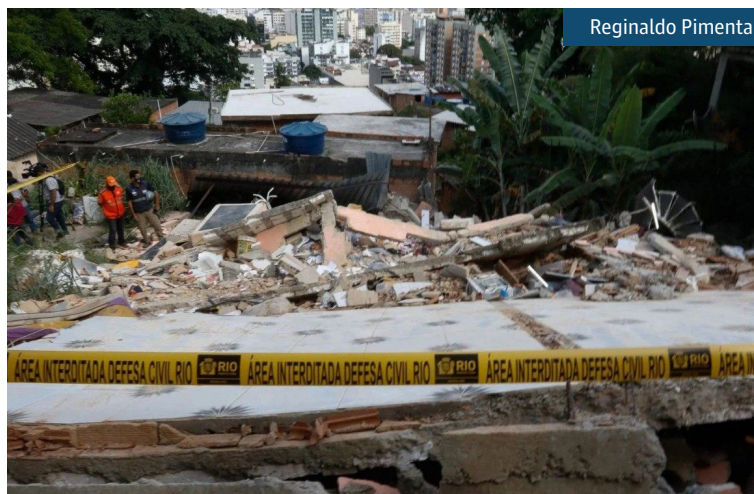
Técnicos da Secretaria Conservação e funcionários da Comlurb fazem a limpeza

Durante a manhã, peritos do Instituto de Criminalística Carlos Éboli