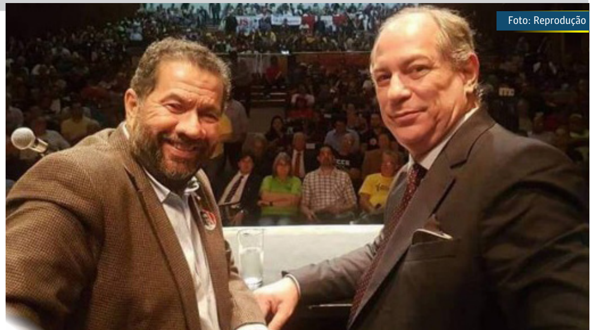
O presidente do PDT, Carlos Lupi, e o ex-governador do Ceará Ciro Gomes

Lupi disse que conversa com os deputados federais do partido para que a maioria da bancada mude sua posição no segundo turno da votação na Câmara. O presidente do PDT explicou ainda que sabia que havia uma negociação do líder do parti-