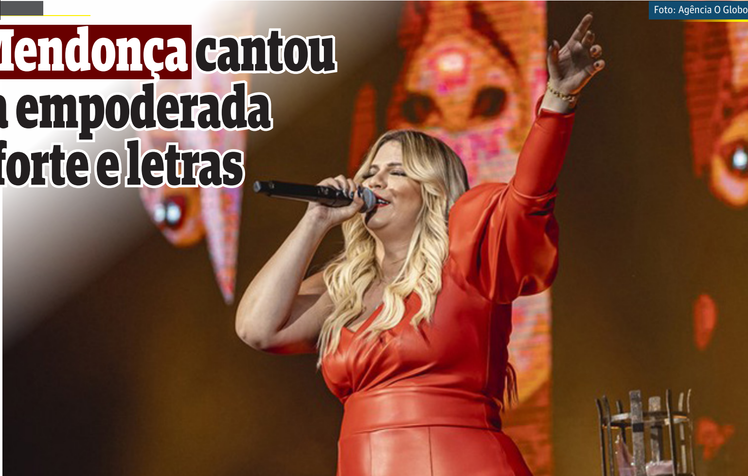
A chegada da cantora ao mercado aconteceu no mesmo momento do sucesso de outras duplas femininas, como Maiara & Maraisa e Simone & Simaria.

gado. Às vezes, pode ser até os mesmos assuntos, mas com uma abordagem diferente, mais feminina". Leia entrevista na íntegra.