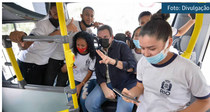
O prefeito Eduardo Paes participou da primeira viagem do programa Verão Verde

elétrico, ecologicamente correto, tem duração de uma hora e começa o trajeto no Parque Madureira, na Arena Carioca Fernando Torres. Em seguida, passa pelo Palácio 450, Portelinha, Feira das Yabás, Portela, Cufa, Viaduto Prefeito Negrão de Lima, Mercado de Madureira, Estádio Aniceto Moscoso (Madureira Esporte Clube) e termina na Império Serrano.