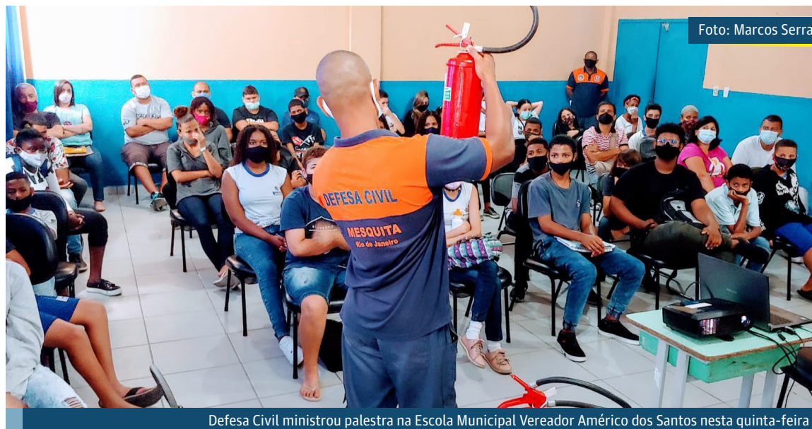
Defesa Civil ministrou palestra na Escola Municipal Vereador Américo dos Santos nesta quinta-feira