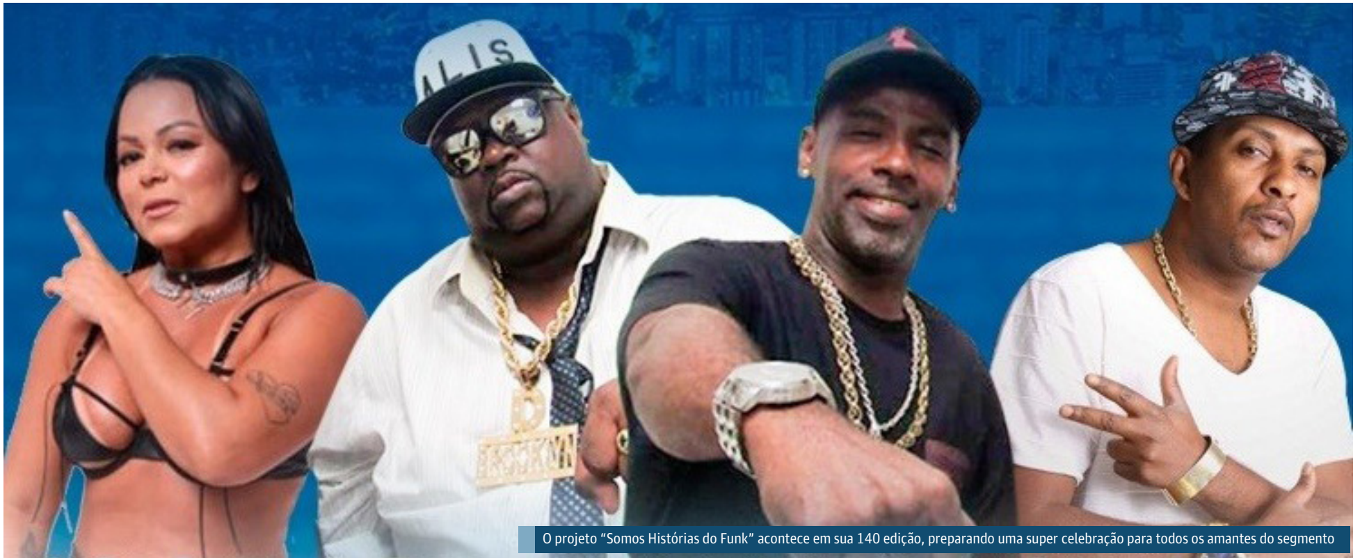
O projeto "Somos Histórias do Funk" acontece em sua 140 edição, preparando uma super celebração para todos os amantes do segmento