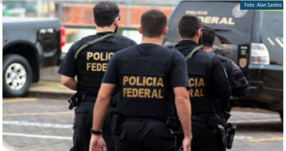
A PF quer apurar se houve irregularidades no uso de dinheiro oriundo de emendas para compra de tratores.

Na semana passada, os senadores Randolfe Rodrigues (Rede-AP)