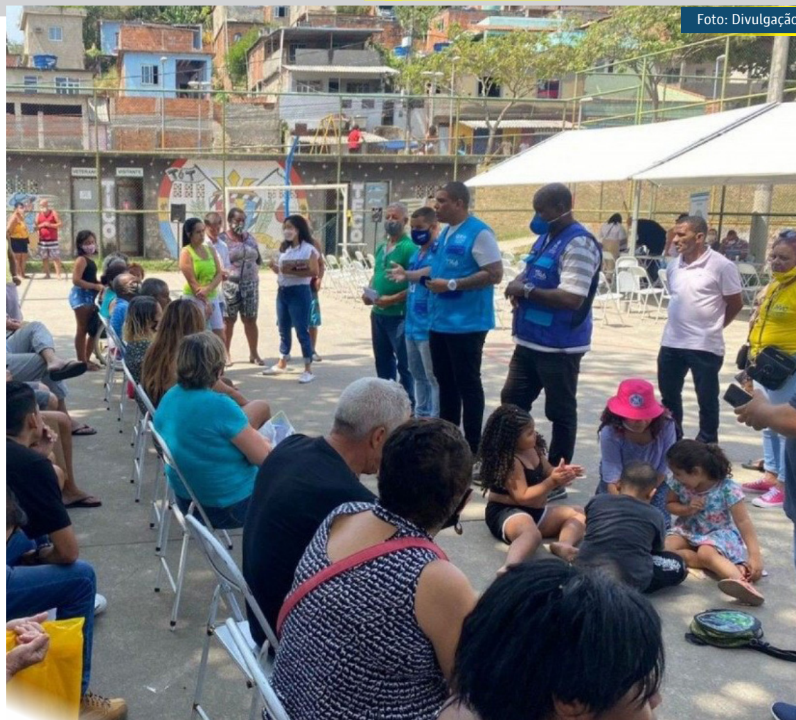
Atendimento acontecerá mediante distribuição de senhas

Os consumidores interessados em registrar reclamações a respeito de qualquer empresa ou esclarecer dúvidas sobre seus direitos devem levar cópia dos documentos pessoais, além dos comprovantes de compra do produto ou do serviço contratado, como boletos e notas fiscais. As queixas serão encaminhadas diretamente às empresas, que terão um prazo de dez dias para solucionar as questões.