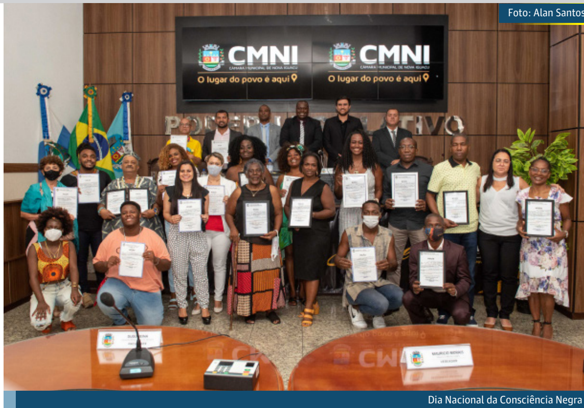
Dia Nacional da Consciência Negra