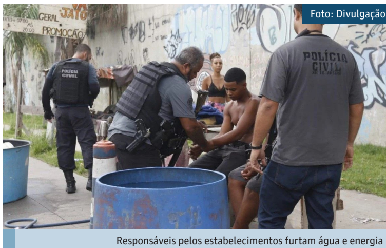
Responsáveis pelos estabelecimentos furtam água e energia