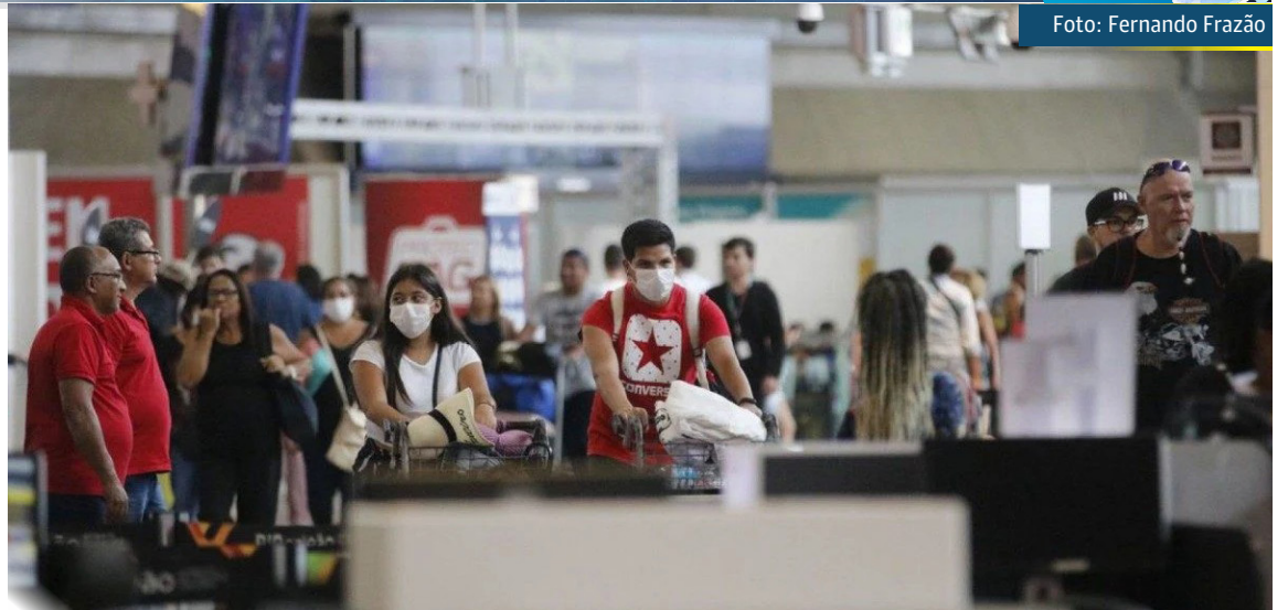
Passageiros e funcionários circulam vestindo máscaras contra o novo coronavírus (Covid-19) no Aeroporto Internacional Tom Jobim - Rio Galeão

A Secretaria Estadual de Saúde do Rio emitiu alerta para os municípios aumentarem a atenção a casos de viajantes, e sempre solicitarem a coleta de amostras para exame PCR dos turistas que estiveram em outro país nos últimos 14 dias, e apresentem quadro de síndrome gripal. O secretário Alexandre Chieppe adota cautela.