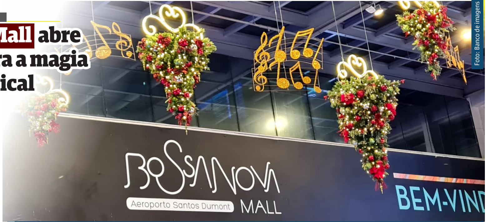
A porta de entrada mais charmosa do Rio ganha decoração especial, playlist natalina no mall e shows no Bossa Lounge

O Bossa Nova Mall é administrado pela Saphyr Shopping Centers, uma das mais importantes empresas do setor, e segue as normas orientadas pelo Grupo, sempre focadas na saúde e bem-estar de clientes, lojistas e colaboradores. Saúde é prioridade e o Grupo Saphyr e todos os seus empreendimentos estão comprometidos com a sociedade para vencer a covid-19.