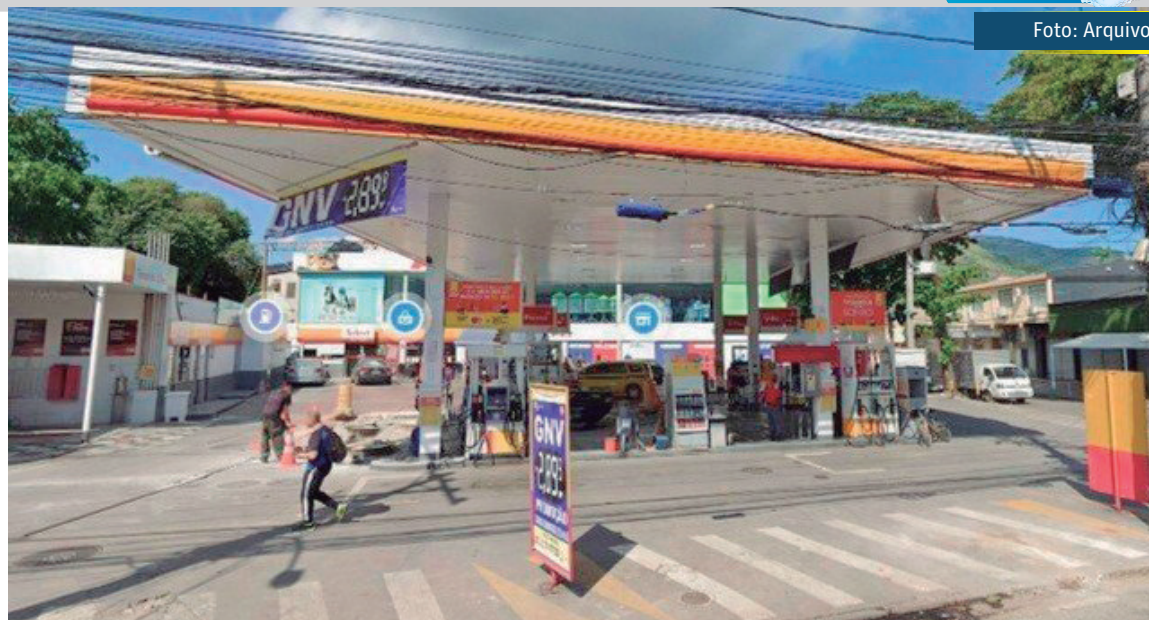
Posto de combustível GNV na Estrada de Jacarepaguá

– Uma redução no IPVA superior a 60% é considerável,