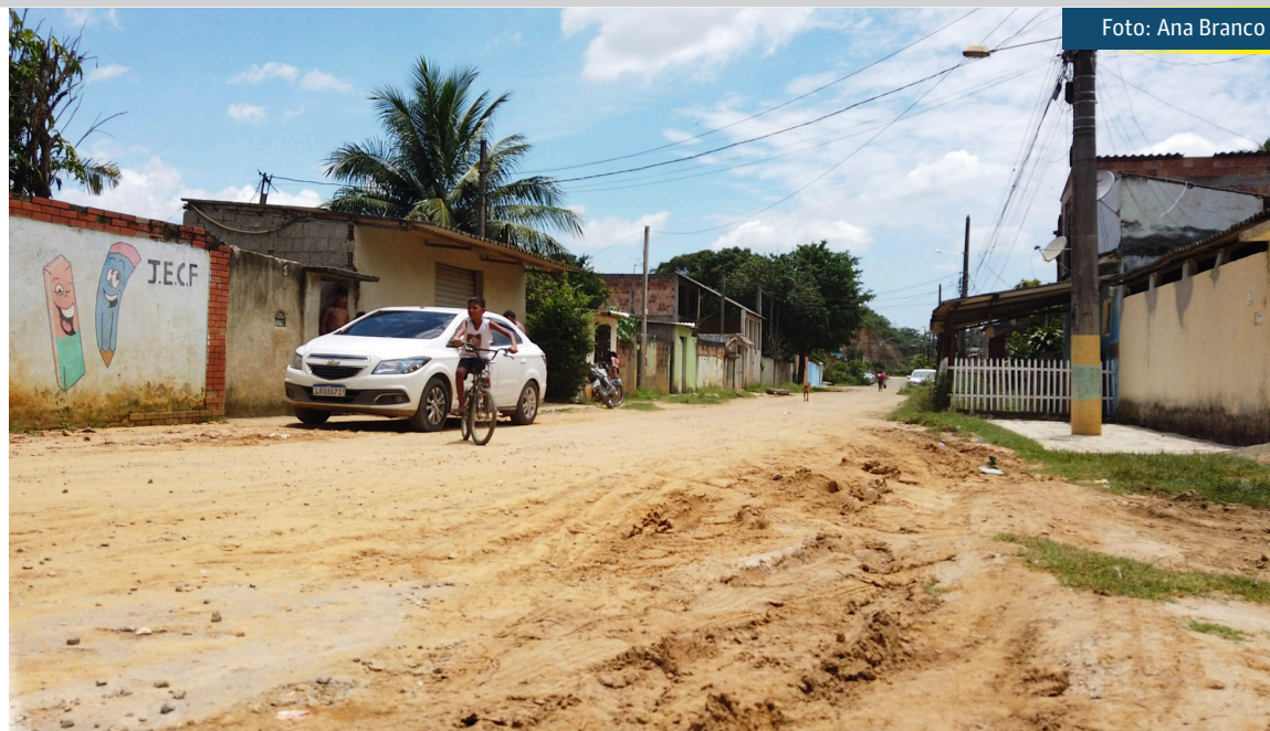
Ao todo, 10 ruas serão contempladas com drenagem, asfaltamento, confecção de calçadas e assentamento de meio fio

“Ficamos imensamente felizes em dar essa notícia aos moradores do bairro São Sebastião. A drenagem e pavimentação da região foi uma promessa de campanha que hoje vamos conseguir cumprir. Não foi fácil, mas graças a muito empenho e planejamento da gestão municipal será possível dar esse