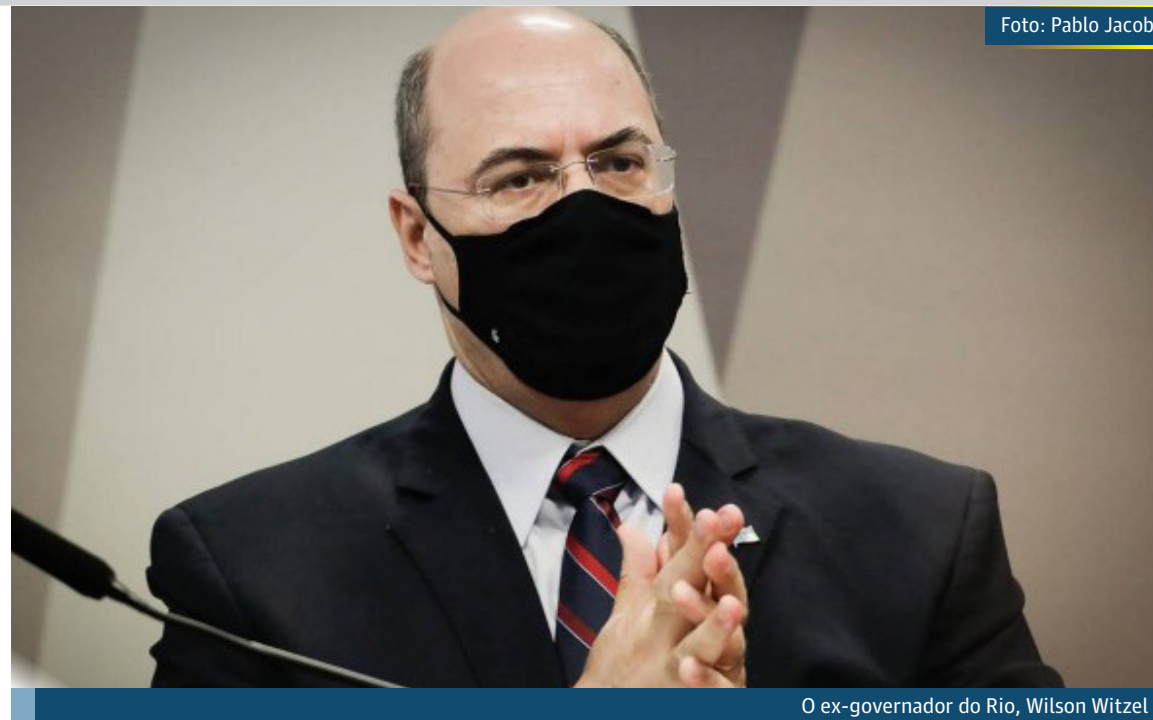
O ex-governador do Rio, Wilson Witzel

No recurso feito ao Supremo, Witzel alega que foram cometidos abusos no processo contra