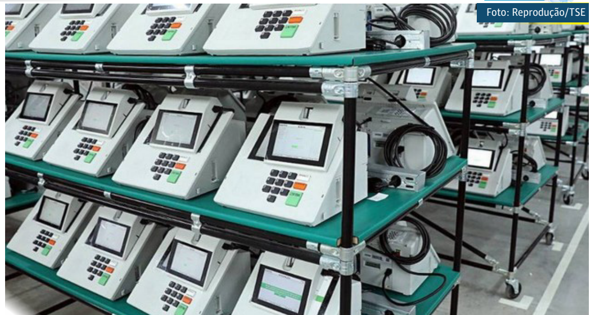
Novas urnas eletrônicas serão usadas a partir das eleições de 2022

O TSE fez um investimento de 985,50 dólares por unidade da nova urna eletrônica. Durante o processo de licitação, a taxa de câmbio utilizada como referência para o preço final foi a do dia 17 de janeiro de 2020, quando um dólar estava cotado a R$ 4,1837. O orçamento foi feito em dólar porque, apesar de fabricada no Brasil, a maioria dos componentes eletrônicos do equipamento é importado.