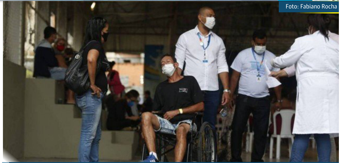
Paciente com influenza é transferido do polo de atendimento no Alemão

Os números oficiais para o período ainda podem aumentar, já que o critério de contagem de casos usado nos dados, o da semana epidemiológica em que os primeiros sintomas surgiram, tem