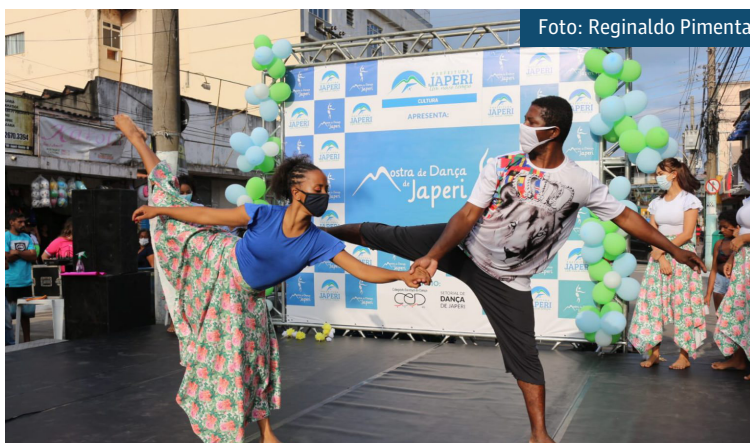
No total, 30 apresentações animaram os espectadores na Praça Leni Ferreira no Centro da cidade