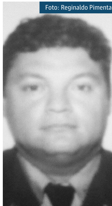
PM Rogério Brandão

Em junho, dois PMs foram assassinados em Nova Iguaçu, na Baixada Fluminense. O cabo