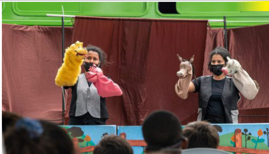
Espectáculo aborda questões de crimes ambientais, mesclado às tradições típicas do Brasil