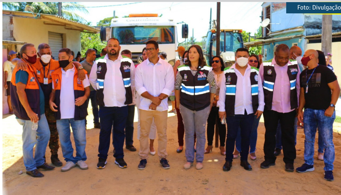
A previsão, de acordo com o contrato, é que as obras sejam entregues em até 10 meses