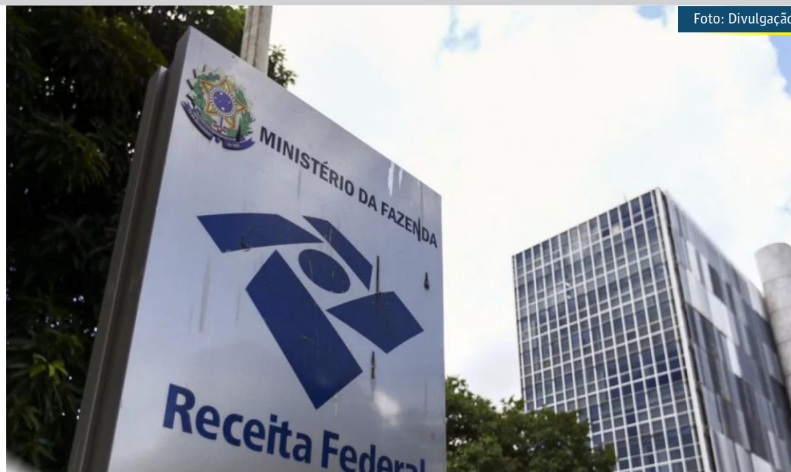
De acordo com o Sindifisco já houve baixa de todos os delegados em 10 regiões fiscais do país

A categoria fará uma assembleia nesta quinta-feira (23) e o indicativo do Sindifisco é para a entrega de todos os cargos de chefia e a paralisação total das atividades do órgão. "Vamos formalizar a entrega de cargos em todos os graus de hierarquia. Não é intenção, é entrega formal. Vamos deixar o órgão à deriva, e só cumprir questões administrativas", avisa o