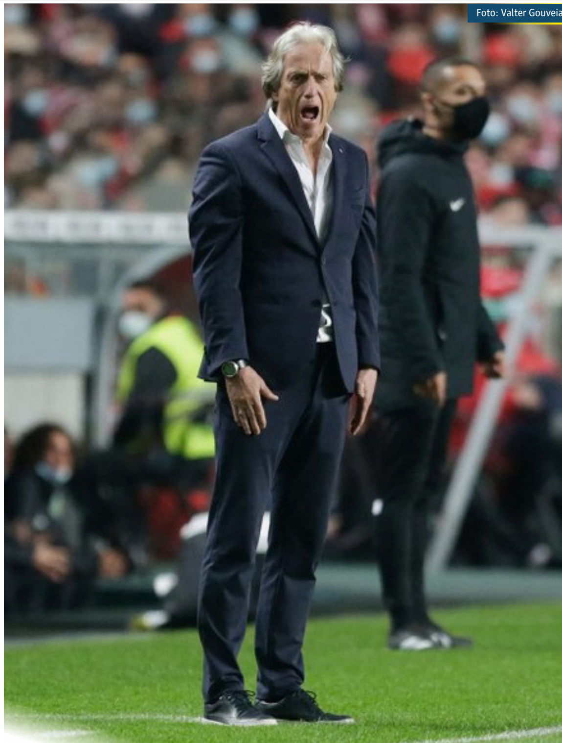
Jorge Jesus comanda o Benfica na derrota para o Sporting no Estádio da Luz

Gabriel Teixeira subiu ao profissional do Fluminense no início da temporada 2021 e foi um dos destaques do time no 1º semestre. Na segunda metade da temporada, o jovem meia sofreu com uma sequência de lesões musculares e perdeu sequência. No fim, terminou o ano com 44 jogos disputados, 5 gols e uma assistência.