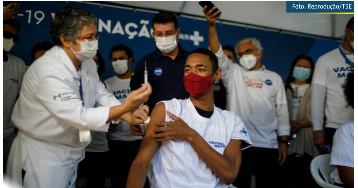
Rio de Janeiro chega a 80% da população completamente vacinada contra Covid

Para o comitê, se as condições atuais se mantiverem até