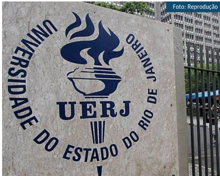
Universidade do Estado do Rio de Janeiro (Uerj)

Terão direito de pleitear o acesso às vagas os servidores públicos das Prefeituras conveniadas que atendam aos seguintes pré-requisitos estabelecidos pela Lei nº 478, de 30 de