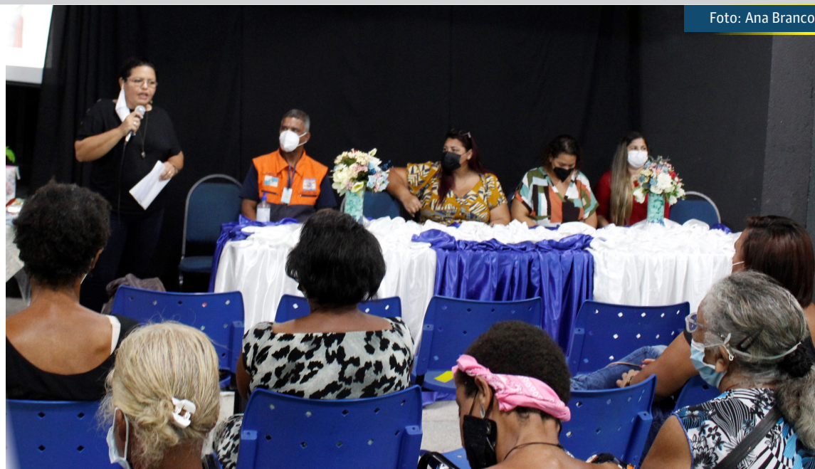
Iniciativa tratou sobre a Caderneta do Idoso, longevidade, fatores de risco e demais assuntos

A turma da melhor idade também foi informada sobre os horários de atendimento do Conselho do Idoso, que