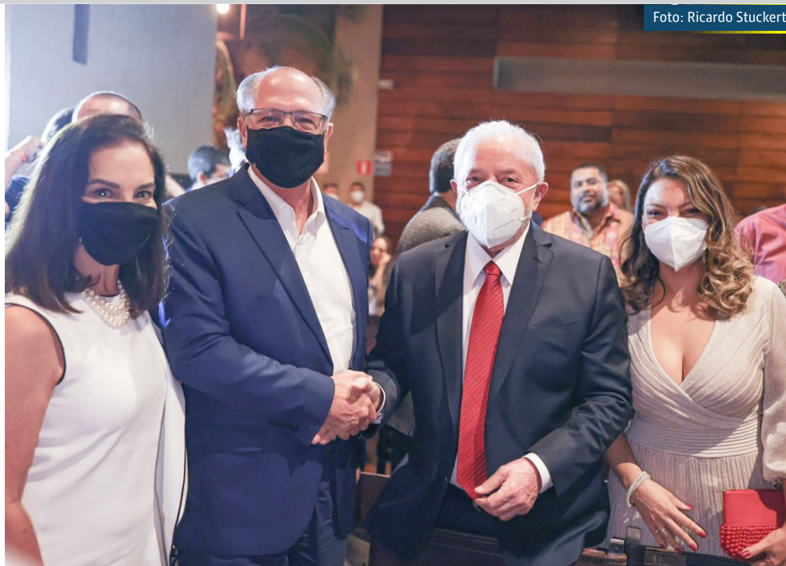
Lula e Alckmin se encontram em jantar em São Paulo no domingo (19)

Apesar da estratégia, aliados políticos de Bolsonaro admitem que dificilmente o núcleo digital, liderado por Carlos Bolsonaro, terá êxito se Bolsonaro não "mudar" em temas reais para a população.