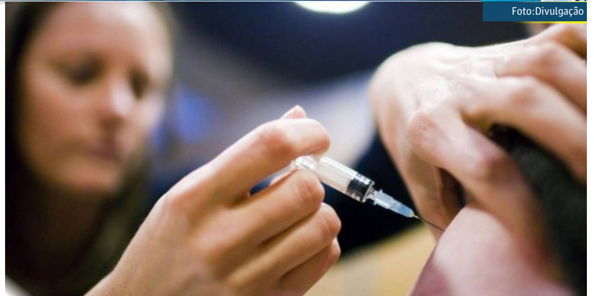
A paciente está com sintomas leves, sob o monitoramento da Vigilância Municipal do Rio de Janeiro

O Rio já teve três casos suspeitos da nova cepa que acabaram