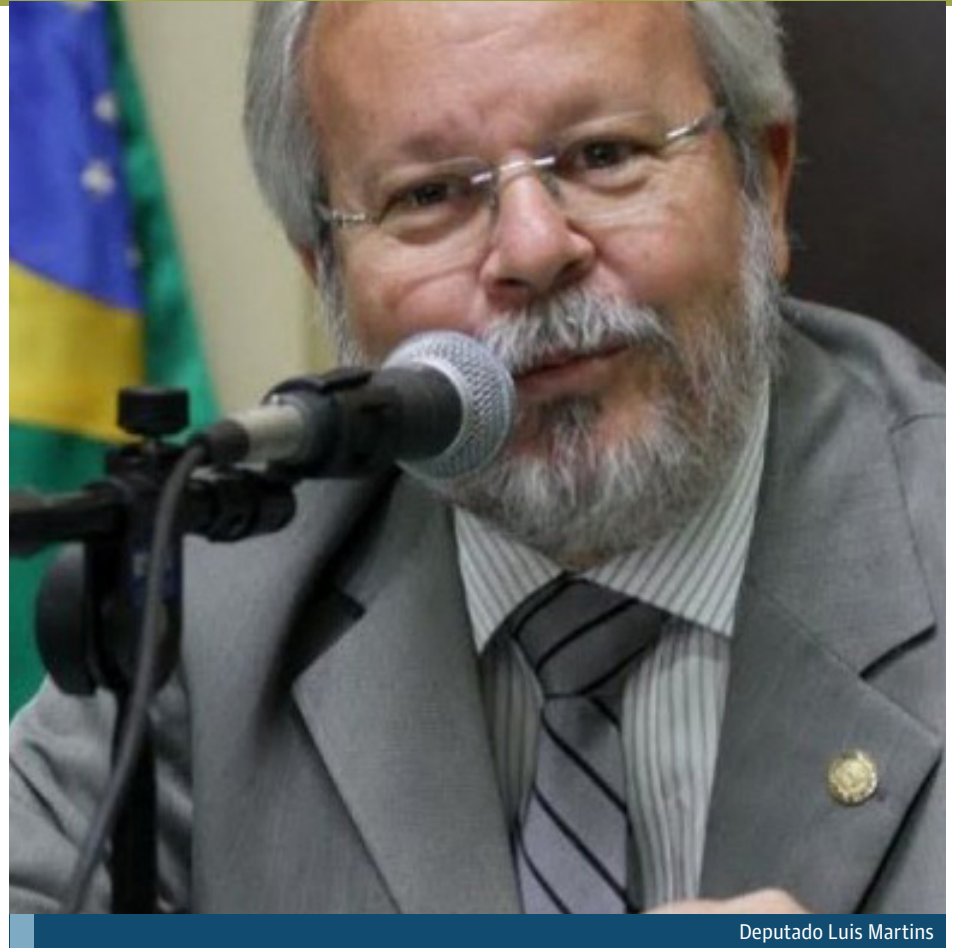
Deputado Luis Martins

O Bolsa-Atleta e a Bolsa-Técnico serão concedidos, a cada beneficiário, pelo prazo de um ano, configurando 12 recebimentos mensais, podendo ser renovada. Os valores devem ser regulamentados pelo Poder Executivo. Os recursos devem ser investidos equitativamente entre homens e mulheres. O texto também prevê a criação de uma comissão avaliadora para analisar, fiscalizar e deliberar a concessão, suspensão e cassação dos benefícios.