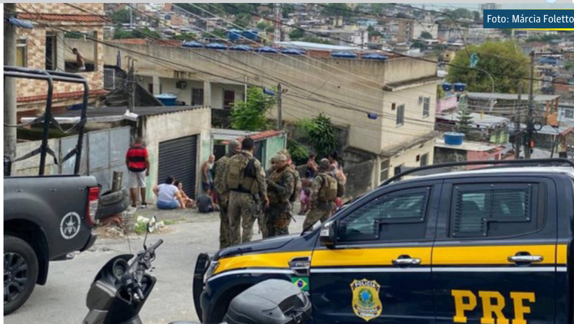
Polícias Militar e Rodoviária Federal em operação na Vila Cruzeiro

Pelas redes sociais, moradores relatam uma manhã de pânico.