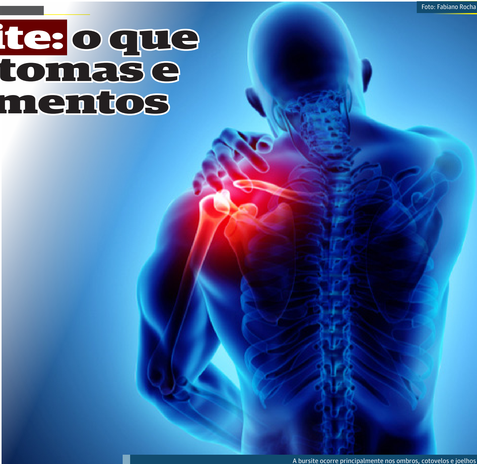
A bursite ocorre principalmente nos ombros, cotovelos e joelhos

* Realizar aquecimento e alongamento antes de atividades para proteger as articulações de lesões.