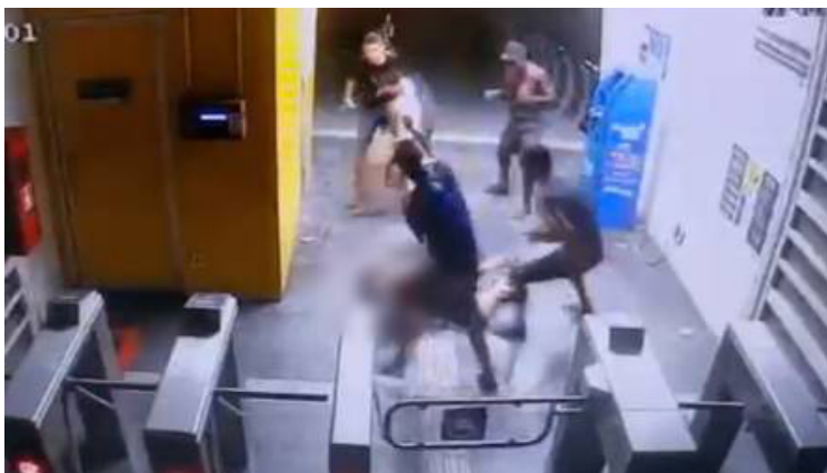
Imagens de câmeras de segurança mostram a ação dos criminosos