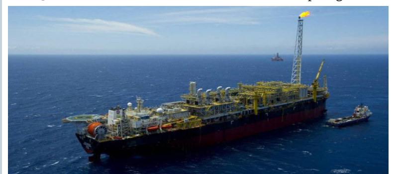
Plataforma da Petrobras em campo do pré-sal, na Bacia de Santos

Todo esse dinheiro extra alimenta propostas de utilização dos recursos para subsidiar os preços de combustíveis e de gás de cozinha, uma das propostas em discussão no Congresso. Mas analistas se dividem sobre essa ideia e comentam os resultados de outros países que tentaram fórmula similar, como mostra reportagem.