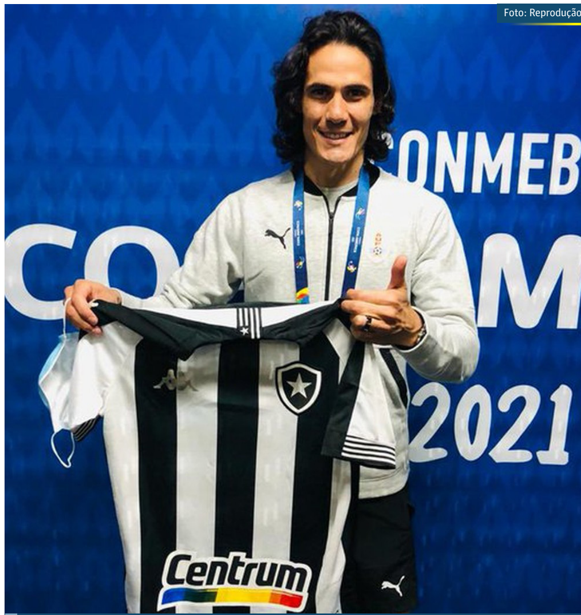
Cavani posou com a camisa do Botafogo na Copa América em 2021