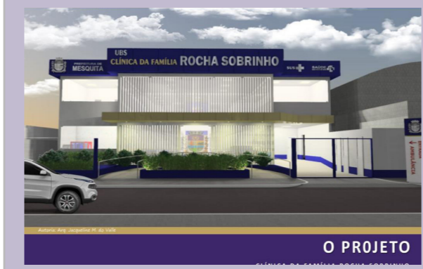
O PROJETO CLÍNICA DA FAMÍLIA ROCHA SOBRINHO