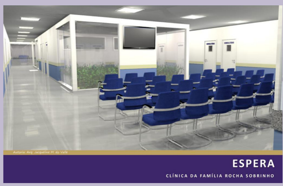
ESPERA CLÍNICA DA FAMÍLIA ROCHA SOBRINHO