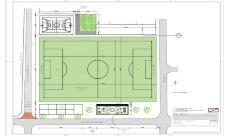
Campo do Estrela – Planta baixa