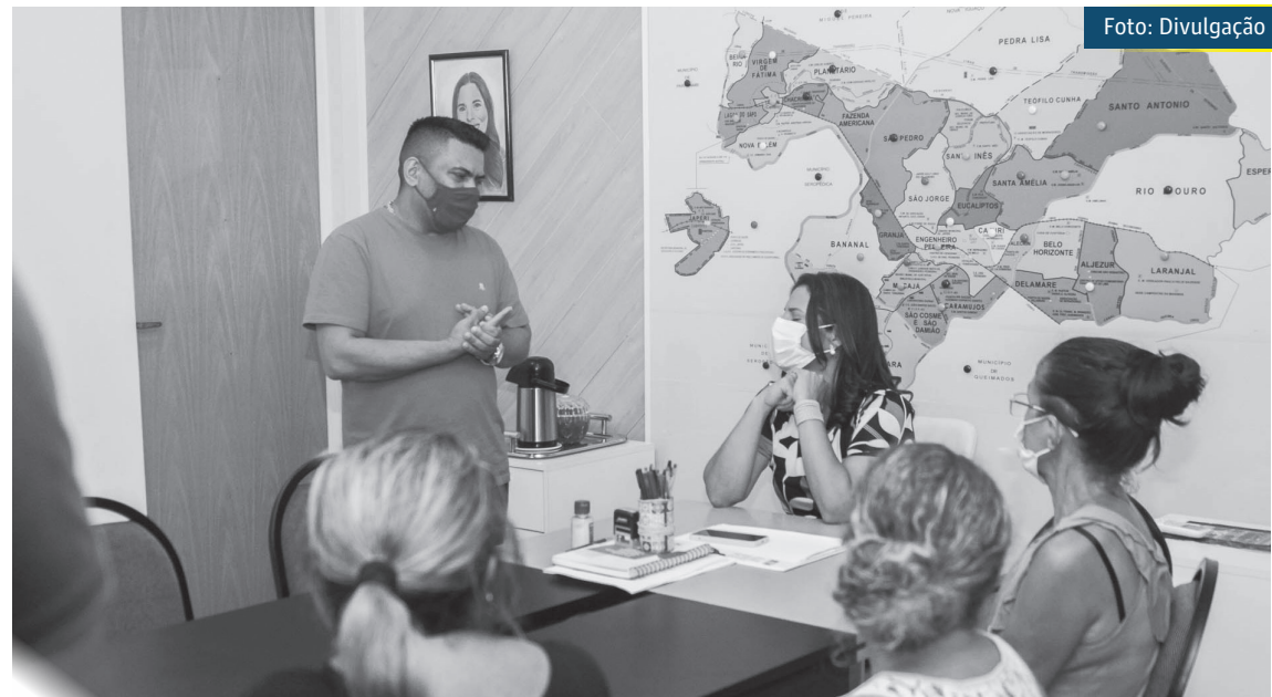
Os serviços serão executados pela Secretaria Municipal de Obras

“A melhor forma de governar para a população é ouvindo cada um. Por isso, me reuni com os moradores e prestei muita atenção às demandas do bairro Guandu. Já assegurei que ainda nesta semana eles serão atendidos. Vou conversar com os se-