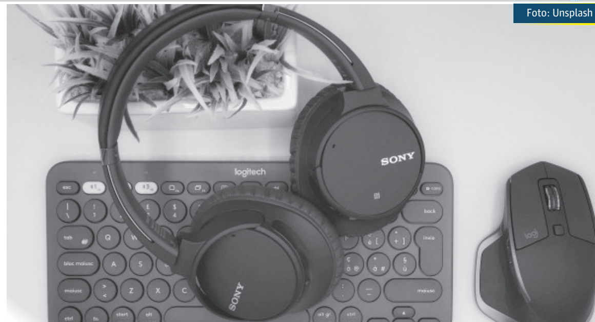
O estágio pode ser realizado integralmente à distância, viabilizando a inscrição de candidatos de todo o país

Na área Comercial espera-se que o aluno goste de se relacionar