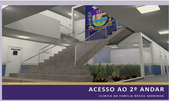
ACESSO AO 2º ANDAR CLÍNICA DA FAMÍLIA ROCHA SOBRINHO