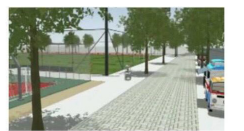
Projeto Vila Olímpica – Campo do Estrela