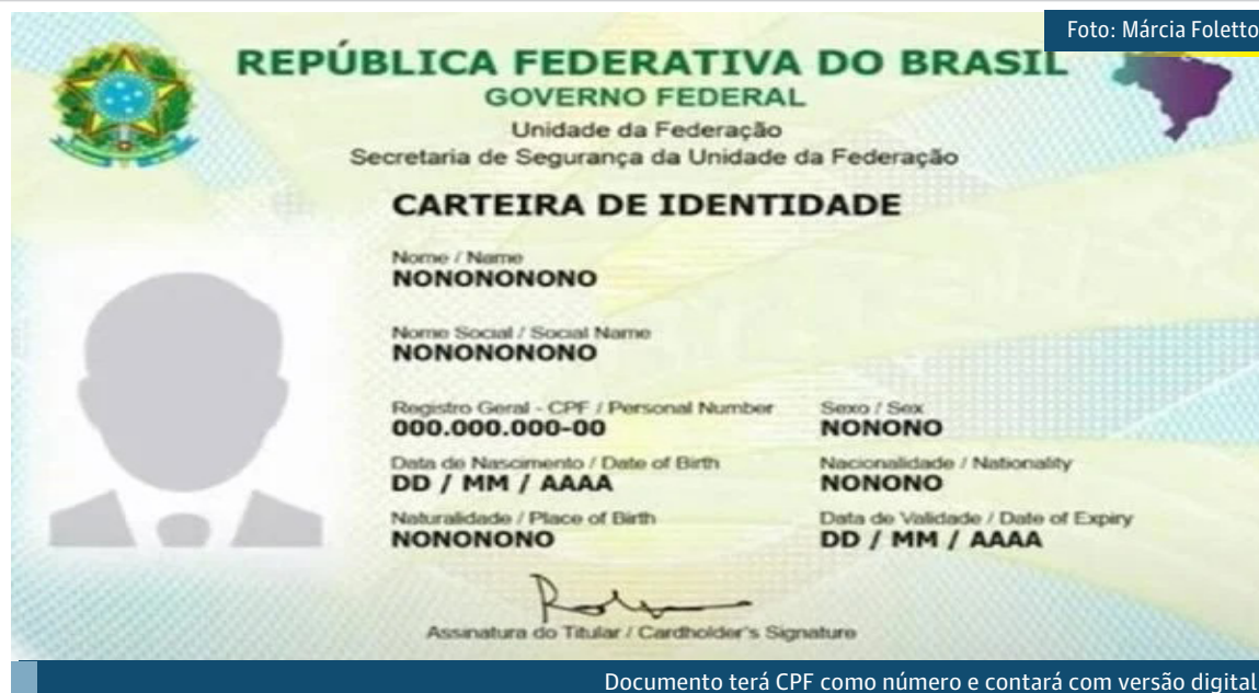
Documento terá CPF como número e contará com versão digital

O novo documento é considerado mais seguro porque permitirá a validação eletrônica de sua autenticidade por QR Code, inclusive offline.