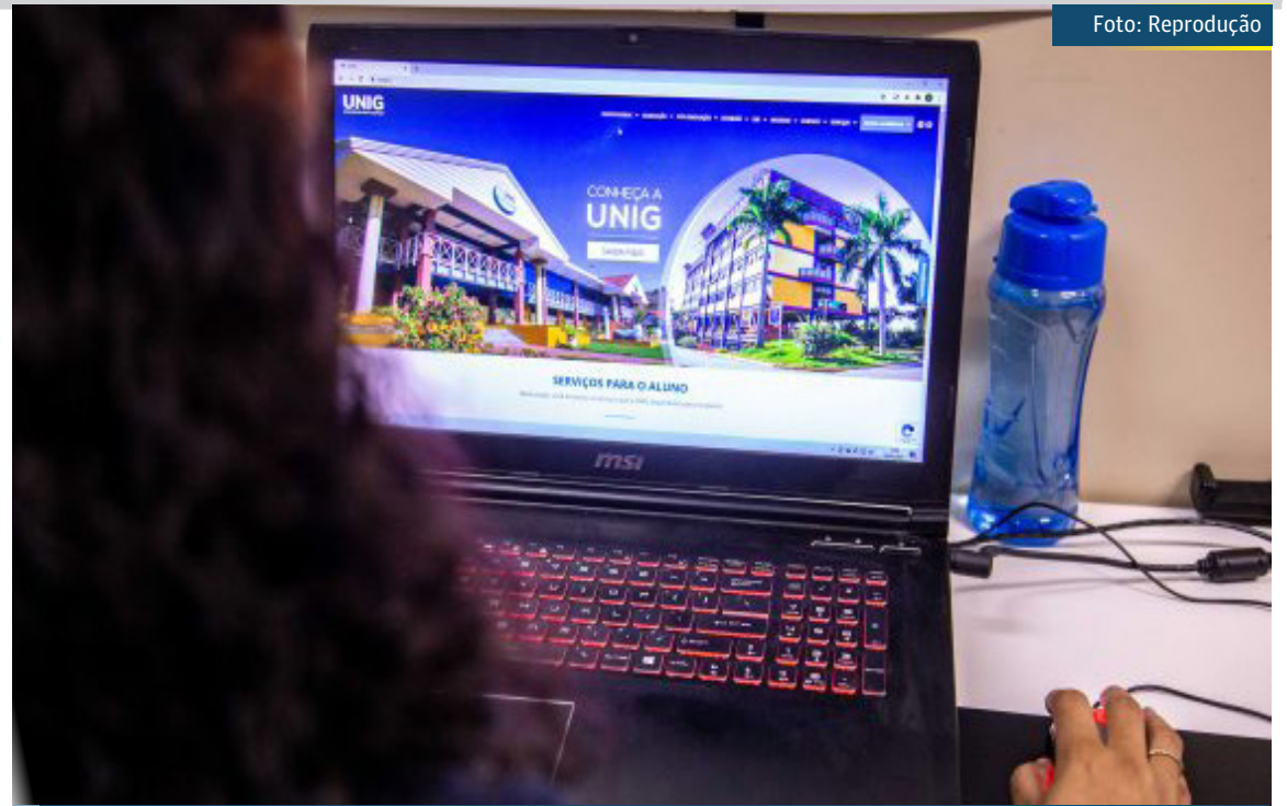
Benefício vale tanto para os funcionários efetivos e comissionados quanto para terceirizados

Para conseguir a matrícula com o benefício, o dependente do funcionário da Prefeitura de Mesquita precisa levar documentos com-