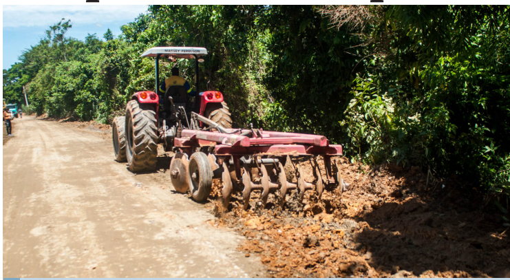
Nesta semana, iniciativa vai trocar manilhas quebradas e criar sistema de escoamento de água

Parte da Estrada Pedra Lisa já recebeu brita e está avançando rumo a Estrada