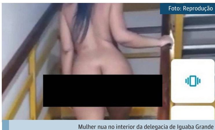
Mulher nua no interior da delegacia de Iguaba Grande

De acordo com as investigações, o casal teria esperado por um horário de menor movimento durante o turno em que o policial estava de plantão na distrital para tirar as fotos. As informações foram antecipadas pelo portal Metrôpoles e confirmadas pelo Extra. Uma das imagens