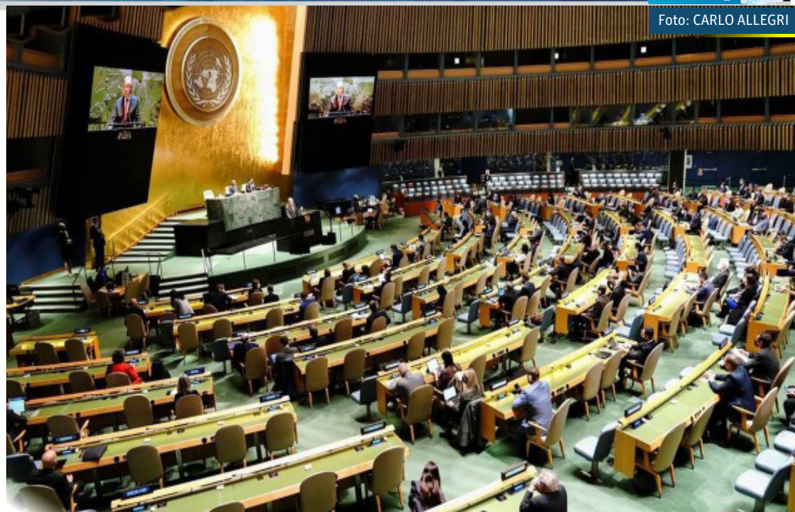
Visão geral da reunião da Assembleia Geral da ONU sobre a situação entre a Rússia e a Ucrânia

— A Guerra Fria acabou há muito tempo. A mentalidade da Guerra Fria, baseada no confronto de blocos, deve ser abandonada. Não há nada a ganhar com o início de uma Nova Guerra Fria — frisou.