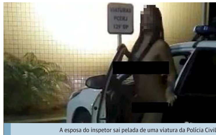
A esposa do inspetor sai pelada de uma viatura da Polícia Civil

Ainda segundo o procedimento, as fotos vazaram porque os dois as encaminharam para um grupo de WhatsApp de swing (troca de casais) do qual fazem parte e alguém as compartilhou em outras conversas pelo aplicativo. Em algumas horas, as imagens viralizaram nas redes sociais, o que serviu de base para instauração da sindicância.