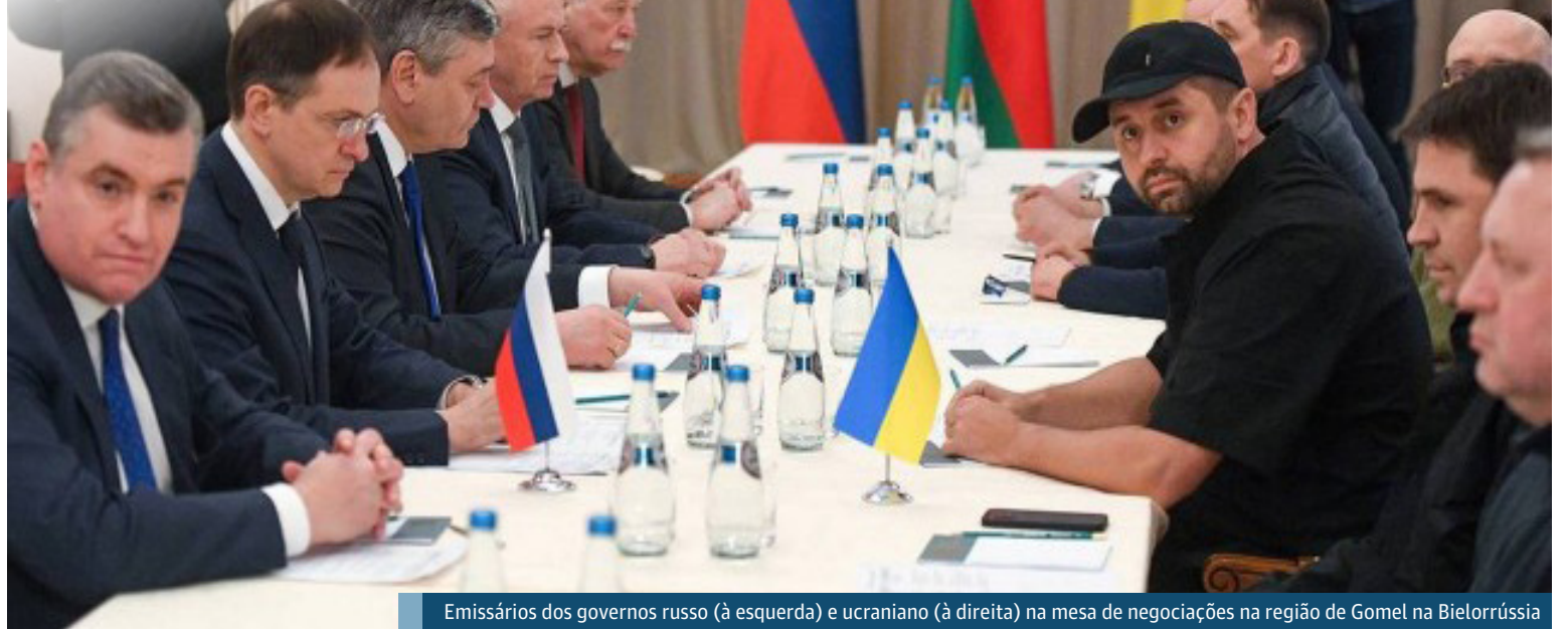
Emissários dos governos russo (à esquerda) e ucraniano (à direita) na mesa de negociações na região de Gomel na Bielorrússia

Quando sinalizou aceitar negociações, a Rússia mostrou pouco interesse em diminuir seus ataques. O Kremlin inicialmente impôs a desmilitarização e a "desnazificação" da Ucrânia