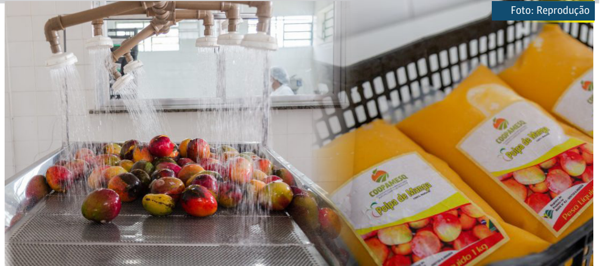
Agricultores da Cooperativa de Produtores Agropecuários de Mesquita atuam em Santa Terezinha