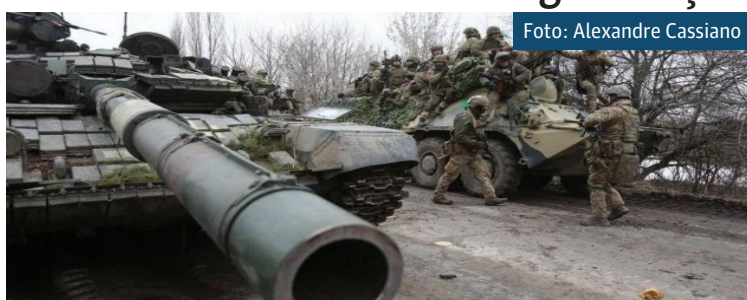
Novas sanções ocidentais impostas após o ataque à Ucrânia afetam a economia da Rússia

Em Kharkiv, cidade de 1,4 milhão de habitantes que tem uma considerável presença de ucranianos de origem russa, os ataques ocorreram também contra áreas civis, usando mísseis balísticos e teleguiados, e, segundo Monastyrsky, deixaram "dezenas de mortos". Vídeos publi-