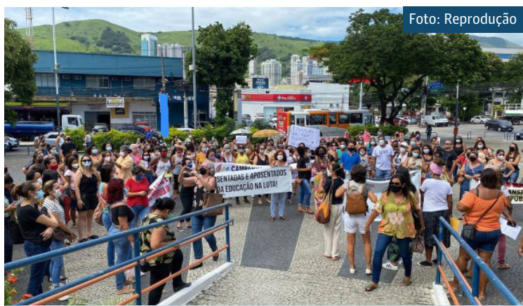
Profissionais da educação protestaram na sede da prefeitura nesta segunda-feira

A categoria inclui professores, agentes de desenvolvimento infantil e funcionários administra-