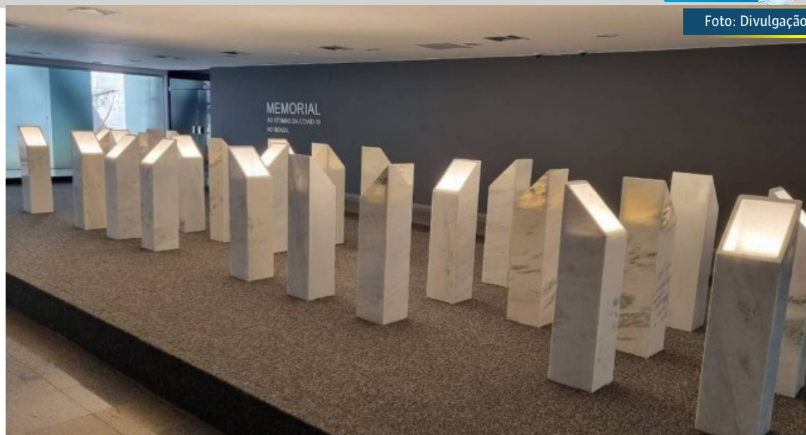
Monumento em memória às vítimas da Covid-19 no Brasil

“Nesta terça-feira vamos inaugurar o Memorial às vítimas da Covid. Além de homenagem, é reparação para a posteridade. Solidariedade às famílias da lembrança que dói para