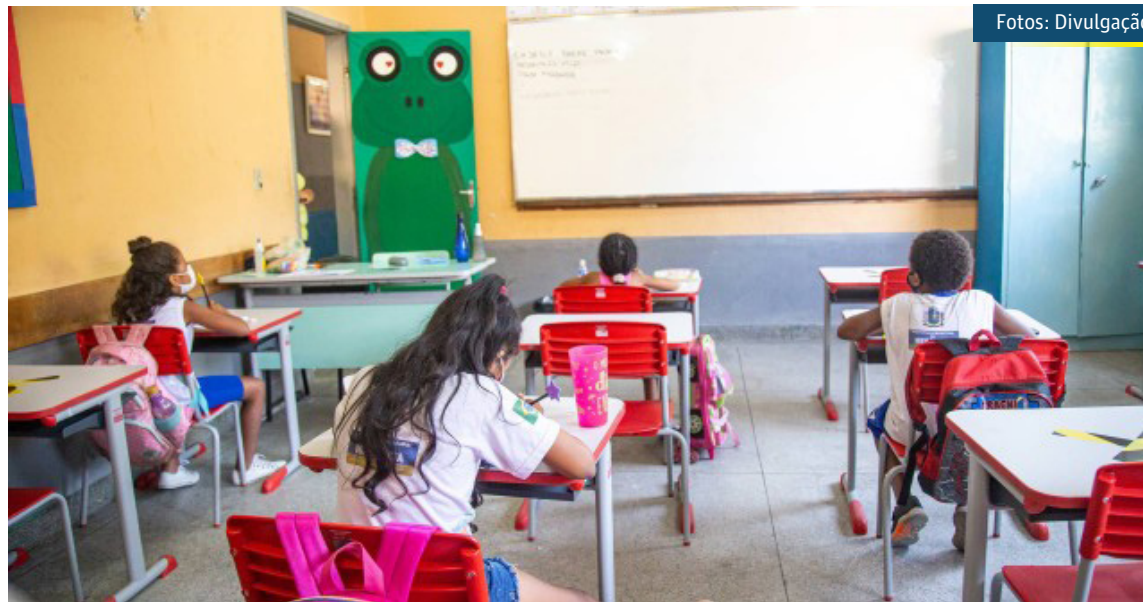
Alunos na sala de aula em Mesquita, onde as aulas também retornam apenas em março

De acordo com a prefeitura de Japeri, os alunos da rede municipal devem retirar as atividades