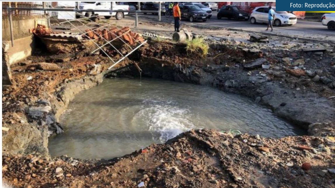
Moradores dizem que não é a primeira vez que tubulações se rompem na região

Muitos moradores postaram vídeos nas redes sociais mostrando o alagamento e as casas afetadas, reclamando de perdas materiais. Muitos