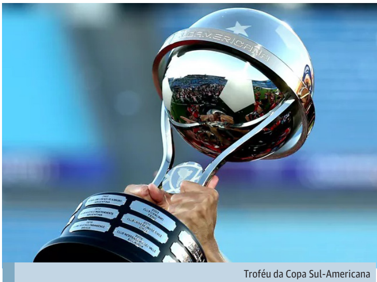
Troféu da Copa Sul-Americana

Ceará, Santos e Atlético-GO serão os primeiros brasileiros a atuarem pela competição, no dia 5. O Vozão encara o Independiente (ARG), na Arena Castelão, enquanto o Peixe duela com o Banfield (ARG), no Estádio Florencio Solá, e o Rubro-Negro diante da LDU (EQU), no Estádio Antônio Accioly.