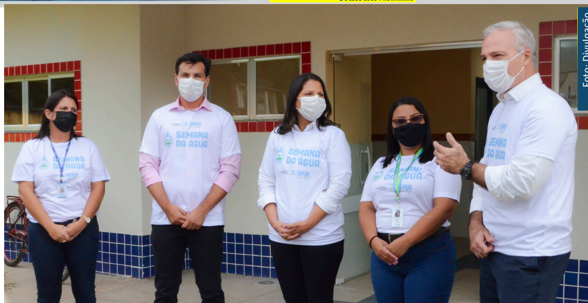
Ao todo serão realizados 330 metros de ampliação de abastecimento no bairro Nova Belém

A prefeita, Dra. Fernanda Ontiveros, comemorou a iniciativa da empresa. "Em Japeri, uma das reclamações mais recorrentes é da falta d'água. Com essa ampliação aqui no bairro Nova Belém, daremos um passo muito importante para sanar essa problemática para os moradores aqui da localidade. Esse é mais um passo para melhorias em nossa cidade", disse a médica.