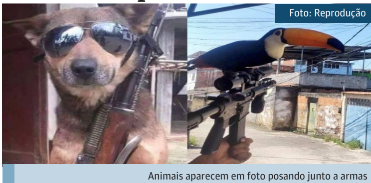
Animais aparecem em foto posando junto a armas

— Esses bandidos veem nos macacos, bichos preguiça, jacarés