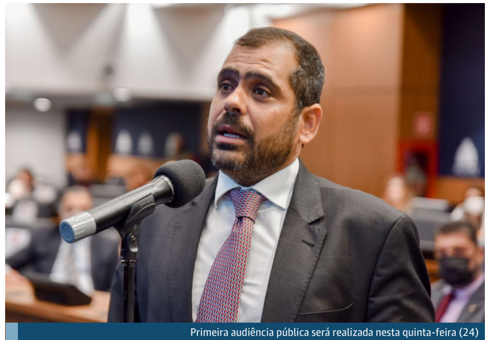
Primeira audiência pública será realizada nesta quinta-feira (24)

Prorrogado até dezembro de 2022, o Supera RJ tem sido alvo de constantes reclamações. Muitas famílias alegam que não conseguiram ter acesso ao benefício ou denunciaram que o dinheiro foi sacado de forma fraudulenta. Hoje, o programa prevê um auxílio no valor de R$ 280 com adicional de R$ 50 por