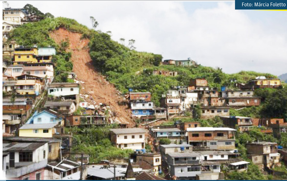
Morro do Estado, em Petrópolis