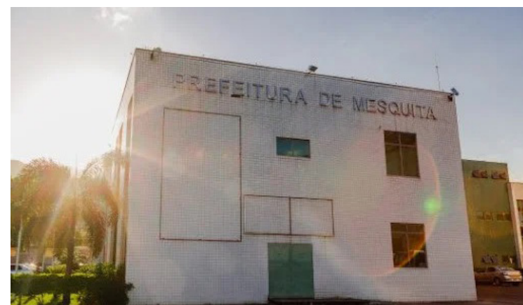
Veja a análise completa dos editais já encerrados, bem como a previsão de oportunidades para 2022

É de 2019 o último concurso para a Câmara de Vereadores de Mesquita. O edital contou com a gestão da banca IASP e ofereceu 20 vagas para os níveis fundamental, médio e superior de escolaridade. As remunerações chegavam a R$ 4.500,00 para jornadas de até 40 horas semanais. Veja