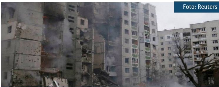
Destrução em Chernihiv, na Ucrânia, provocada por ataques russos

Bachelet ainda relatou que seu escritório também verificou 77 incidentes nos quais instalações médicas, incluindo 50 hospitais, foram danificadas. E pediu à Rússia para ouvir os pedidos internacionais e "atuar de imediato para a retirada de suas tropas do território ucraniano". Moscou nega alvejar civis no que chama de "ope-