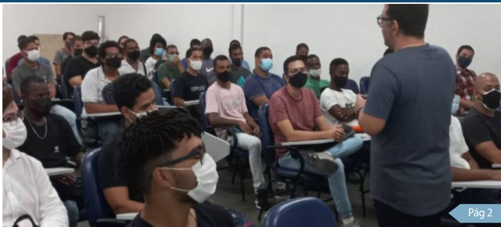
Candidatos participam do recrutamento presencial somente após o preenchimento de cadastro no portal da Comunidade Católica Gerando Vidas