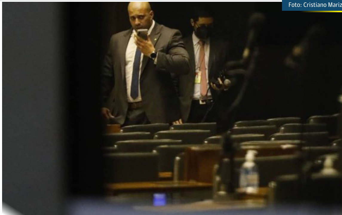
Deputado Daniel Silveira circula livremente ao lado da deputada Aline Sleutjes no Plenário da Câmara dos Deputados

Nesta terça-feira, Moraes determinou a instalação imediata da tornozeleira eletrônica no deputado por constatar que a decisão dada por ele na última