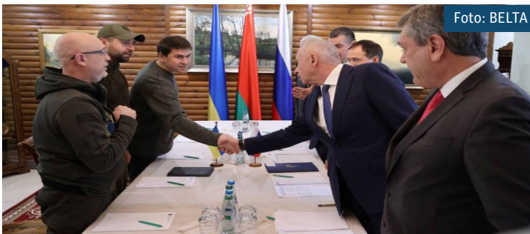
Representantes da Ucrânia (E) e da Rússia (D) apertam as mãos

– As negociações acabaram. Concordamos em continuar as negocia-