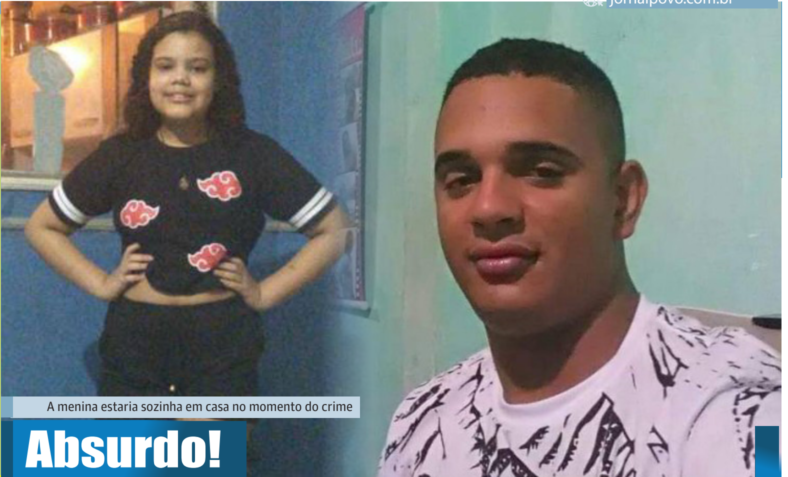
A menina estaria sozinha em casa no momento do crime