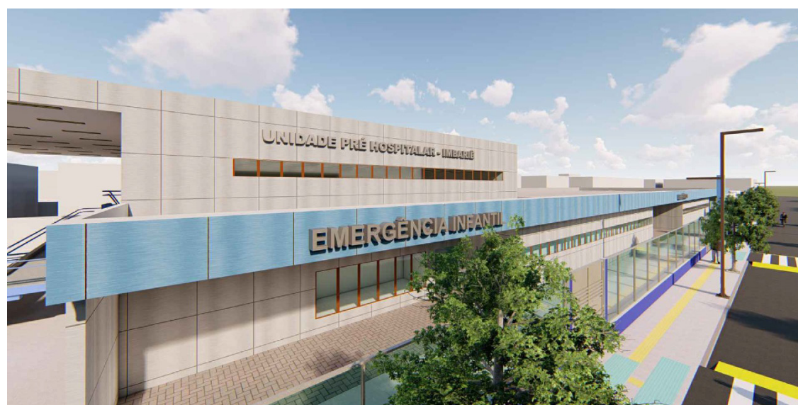
A UPH de Imbariê, a exemplo da que está sendo construída no bairro Pilar, vai funcionar durante 24 horas por dia