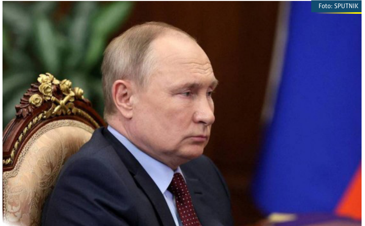
O presidente russo Vladimir Putin

Em comentários televisivados, Putin disse que russos e ucranianos são um povo só. Sem fornecer evidências, no entanto, o presidente russo fez uma série de acusações contra as forças ucranianas, dizendo que elas estão mantendo centenas de civis estrangeiros como reféns – incluindo estudantes – e que elas estão usando civis como escudo humano. Ele ainda alegou que nacionalistas ucranianos estão bloqueando corredores que os soldados russos, segundo ele, abriram para a população fugir.