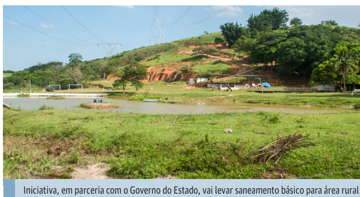
Iniciativa, em parceria com o Governo do Estado, vai levar saneamento básico para área rural

Em Japeri, as obras para tratamento de esgoto vão acontecer nos bairros São Pedro, Esperança, Teófilo Cunha (somente os sítios) e Santo Antônio, além dos assentamentos Boa Esperança, Paes Leme e Fazenda Normandia. No total, mais de