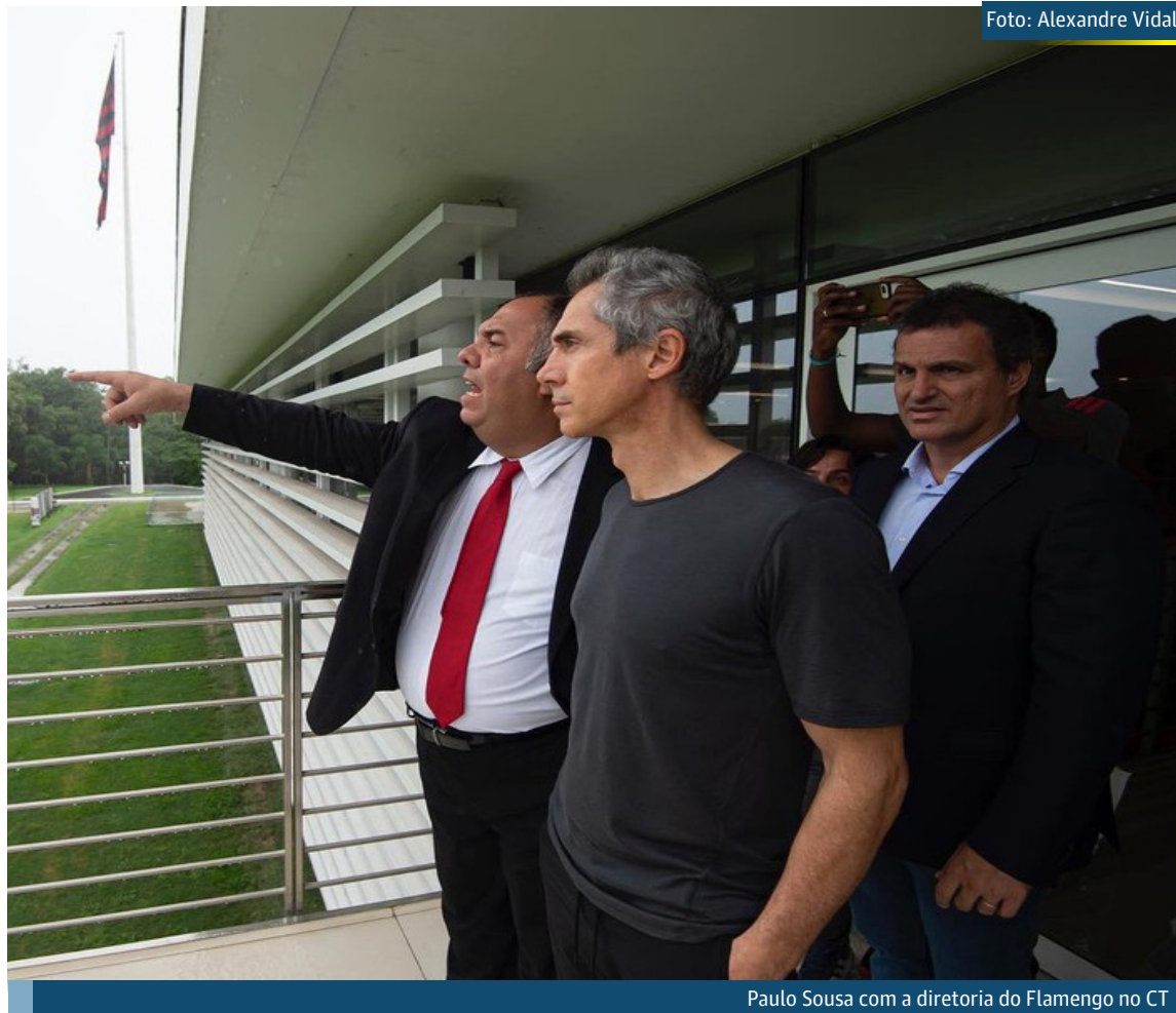
Paulo Sousa com a diretoria do Flamengo no CT