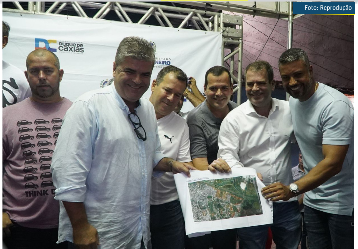
Entre as ruas beneficiadas no Jardim Vila Nova estão: Progressista, Maravilha, 12 de Julho e Travessa Barreira

Entre as ruas beneficiadas no Jardim Vila Nova estão: Progressista, Maravilha, 12 de Julho e Travessa Barreira.